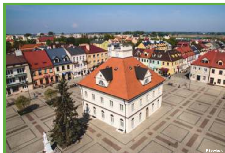
Łęczyca, ratusz - miejsce spotkań rowerzystów