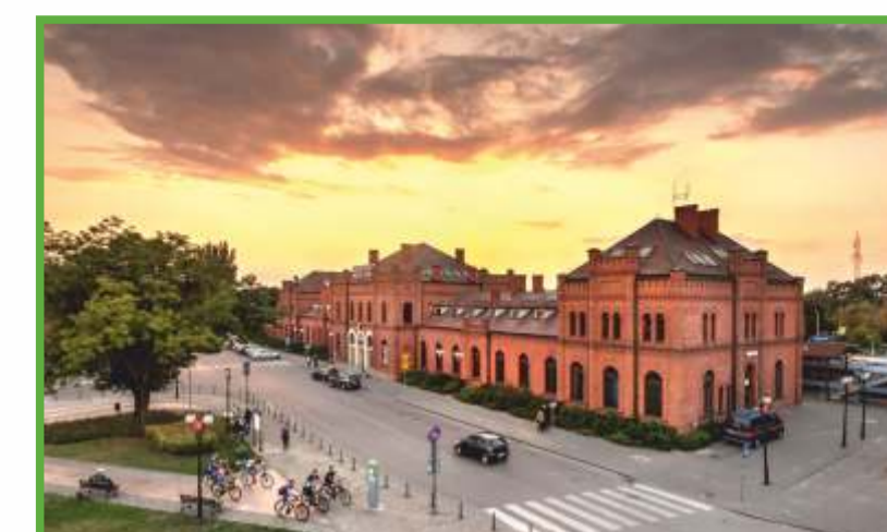
Skierniewice, dworzec kolejowy - węzeł szlaków rowerowych