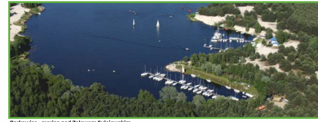
Barkowice - marina nad Zalewem Sulejowskim