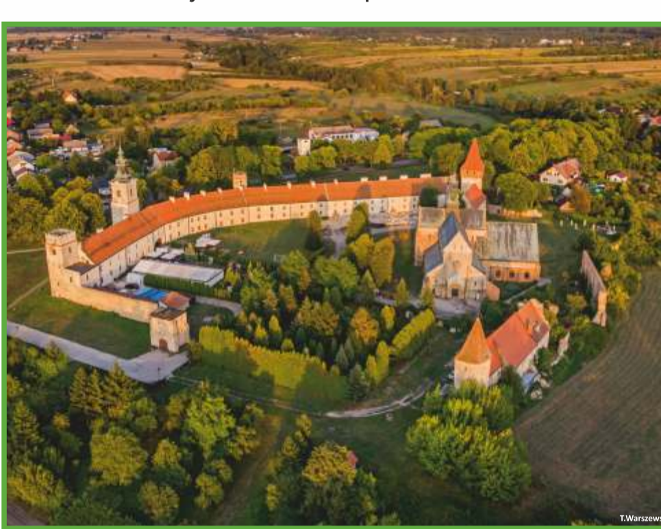
Sulejów - opactwo Cystersów na szlaku Grunwaldzkim