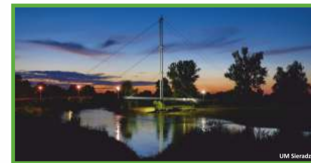
Sieradz - most na Warcie