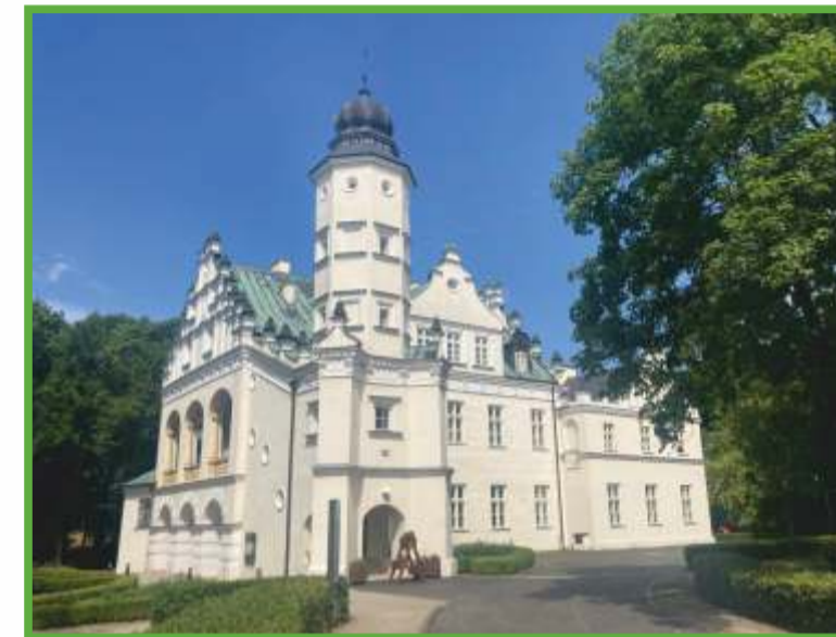
Poddębice - pałac Grudzińskich