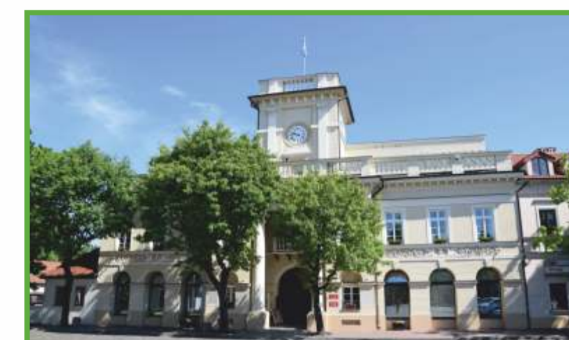
Łowicz, ratusz - początek łowickich szlaków turystycznych