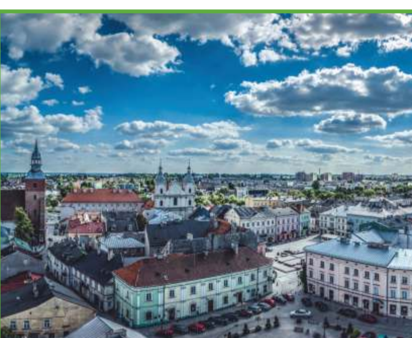
Piotrków Tryb. - Stare Miasto z lotu ptaka