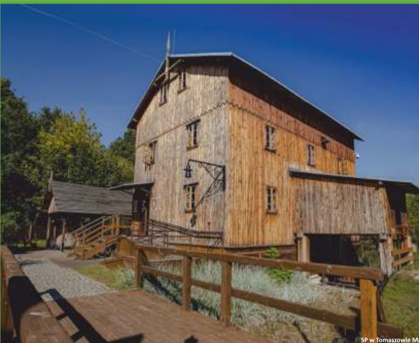
Tomaszów Maz. - Skansen Rzeki Pilicy