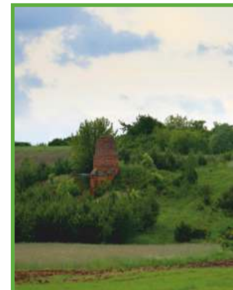
Majacze - wapienniki na trasie szlaku Bursztynowym