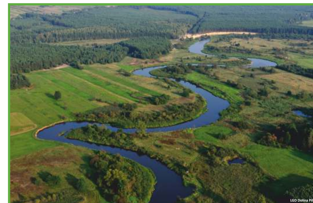
Rzeka Pilica w okolicach Przedborza