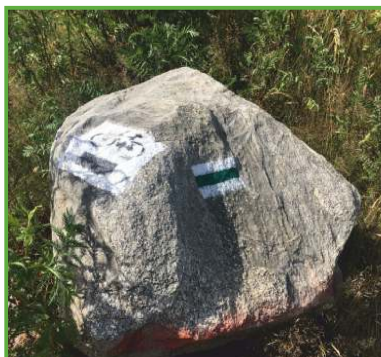
Oznakowanie szlaków turystycznych

Wydawca: Urząd Marszałkowski Województwa Łódzkiego, Departament Klimatu i Turystyki Wydział Turystyki turystyka@lodzkie.pl