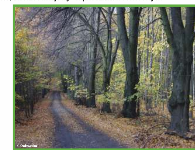
Las Lagiewnicki - szlak rowerowy