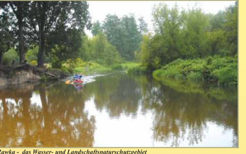
Rawka - das Wasser- und Landschaftsschutzgebiet