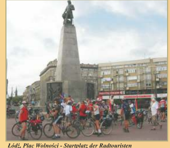
Łódź, Plac Wolności - Startplatz der Radwahrten

Wieruszowski Landkreis: ⇒ Przez Powiat Wieruszowski (rot - 133 km) ⇒ Rekreacyjny wokół Wieruszowa (grün - 28 km) ⇒ Świętego Wojciecha (blau - 20 km) ⇒ Nad Prosną (gelb - 13 km) 21 kurze lokale Routen Zgierski Landkreis: ⇒ Szlakiem Bojowym Kresowej Brygady (rot - 20 km) ⇒ Szlak Agroturystyczny (gelb und grün - 33 km) ⇒ Łódź Polesie-Malanów (grün - 21 km)