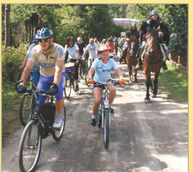
Mit dem Fahrrad zum Europäischen Bernsteinfest