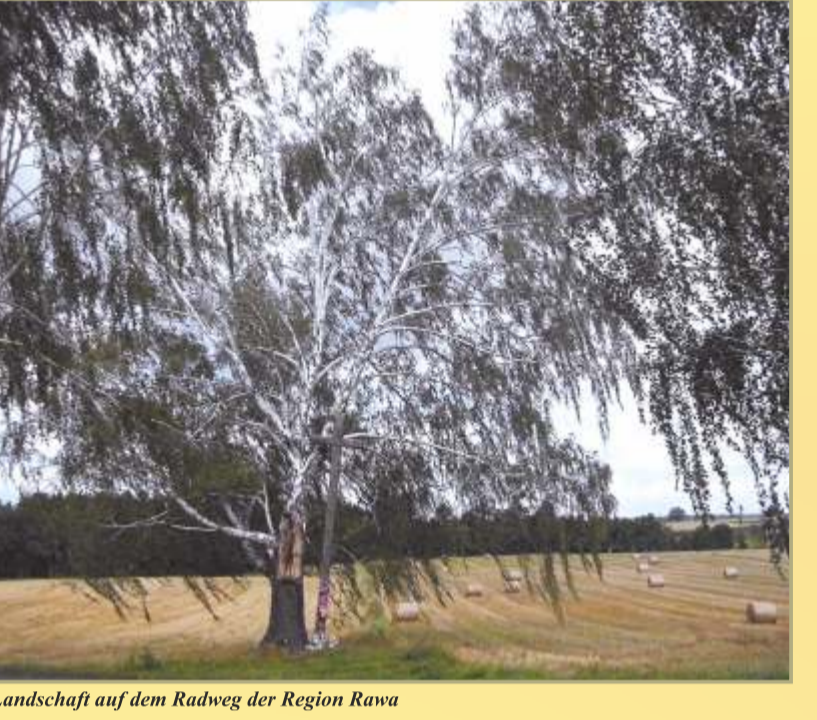
Landschaft auf dem Radweg der Region Rawka