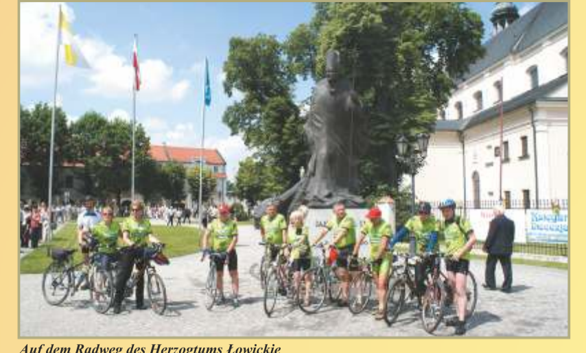
Auf dem Radweg des Herzogtums Łowickie