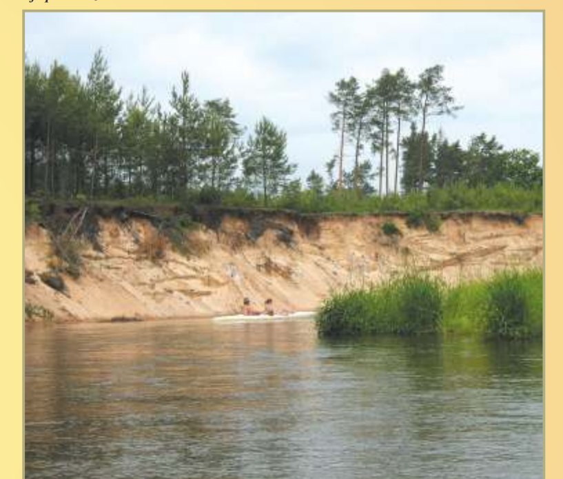
Fluss Pilica im Landschaftspark Sulejowski