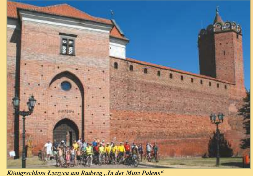
Königsschloss Łęczyca am Radweg „In der Mitte Polens“