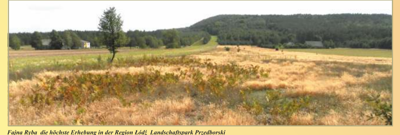
Pajna Ryba die höchste Erhebung in der Region Łódź, Landschaftspark Przedbórz