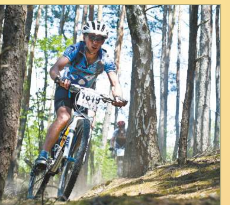
Radmarathon in Jura Wieluńska