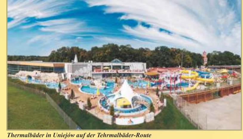
Thermalbäder in Uniejów auf der Thermalbäder-Route