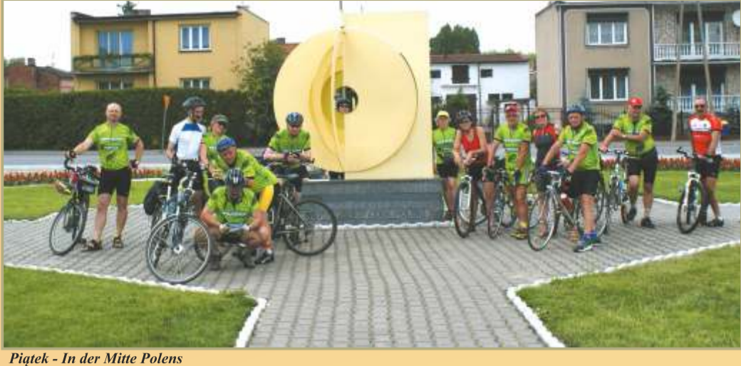
Piątek - In der Mitte Polens