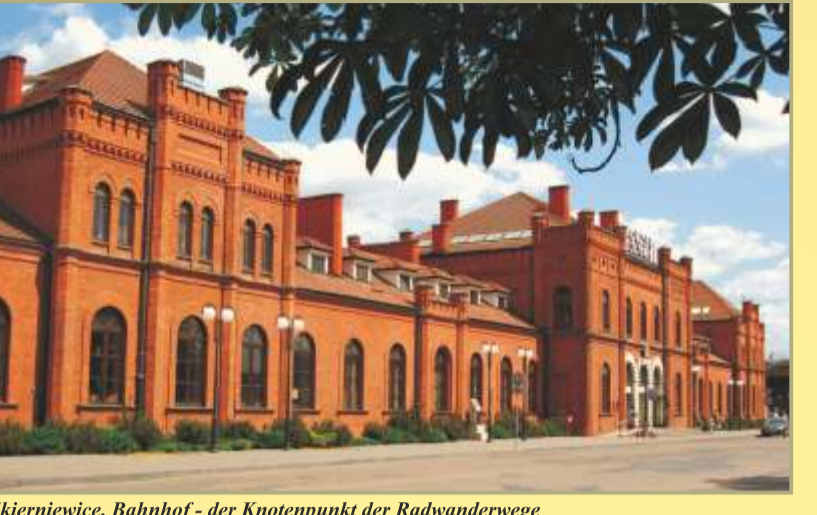
Skierniewice, Bahnhof - der Knotenpunkt der Radwanderwege