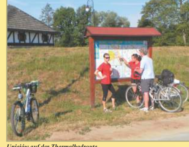
Uniejów auf der Thermalbäder-Route