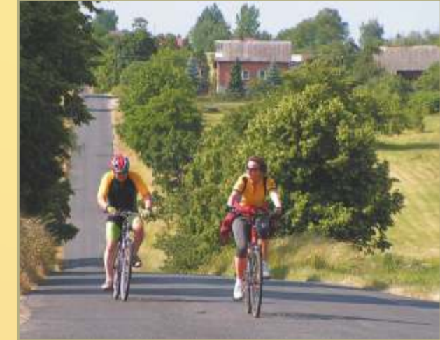
Hügellandschaft in der Gegend von Sowińsk auf der Nadwarciański-Bersteinroute