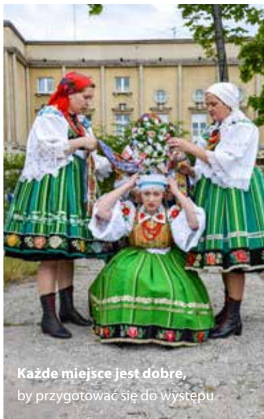
Każde miejsce jest dobre, by przygotować się do występu