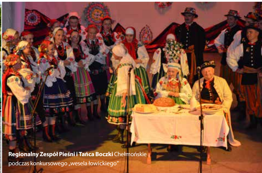
Regionalny Zespół Pieśni i Tańca Boczek Chelmońskie podczas konkursowego „wesela łowickiego”

Zarówno jurorów, jak i zgromadzoną publiczność, zachwycił program przygotowany przez zespół z Boczek Chelmońskich. „Wesele łowickie – obrzęd weselny” składało się z 4 części: Wieczór panieński, Odjazd do ślubu, Przyjazd Pary Młodej od ślubu i Oczepiny. Przyspiewki wykonywane przez drużby i drużny, przeplatane łoberkiem, kujowiakiem i chodzonym, a na zakończenie łocepiny, sprawiły, że dla miłośników kultury ludowej było to wyjątkowe widowisko. Zespół z Wiśniowej Góry pokazał się kieleckiej publiczności w „Suicie łowickiej – jo do Ciebie”, w której zawierały się tańce i przyspiewki Księstwa Łowickiego.