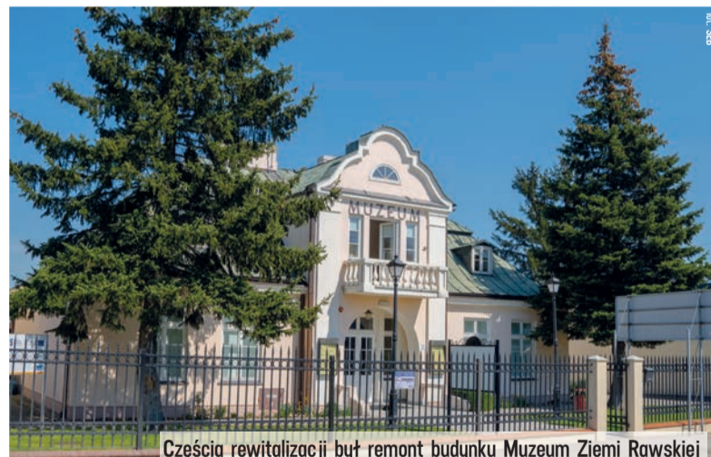
Częścią rewitalizacji był remont budynku Muzeum Ziemi Rawskiej