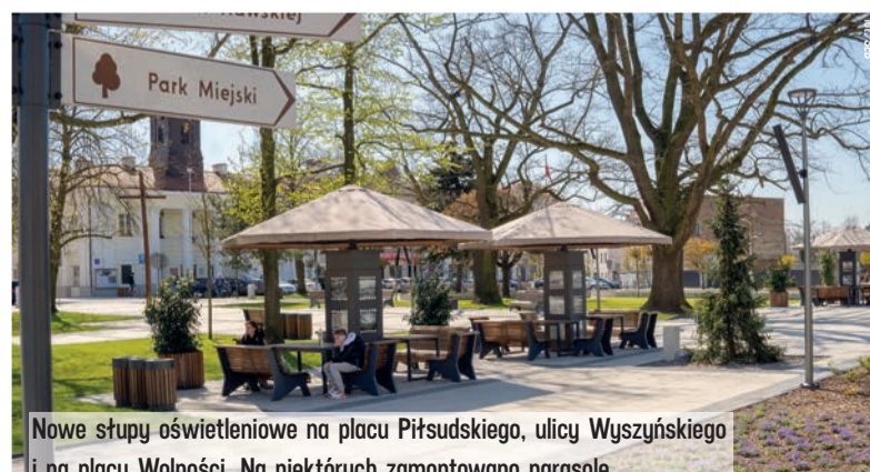
Nowe słupy oświetleniowe na placu Piłsudskiego, ulicy Wyszyńskiego i na placu Wolności. Na niektórych zamontowano parasole