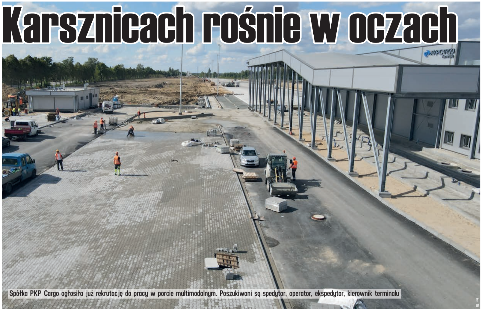
Spółka PKP Cargo ogłosiła już rekrutację do pracy w porcie multimodalnym. Poszukiwani są spedytor, operator, ekspedytor, kierownik terminalu

Prace w Karsznicach trwają od sierpnia 2022 roku. Na zlecenie PKP Cargo Terminale prowadzi je spółka ZUE. Zrealizowano już ponad 80 procent robót budowlanych. Jak zapowiada inwestor, ma to być jedno z największych multimodalnych centrów logistycznych w Polsce. Na 13 hektarach należącym do kolei terenu będą dwie suwnice bramowe, dziewięć torów, place rozładunkowe i magazynowe, hala naprawcza, a także infrastruktura towarzysząca, w tym drogi i parkingi. Całkowita wartość inwestycji to prawie 128 mln 600 tys. zł. Zarząd Województwa Łódzkiego wsparł budowę terminalu kwotą 51 milionów 700 tys. zł. To unijne dofinansowanie dla spółki PKP Cargo Terminale z Europejskiego Funduszu Rozwoju Regionalnego.