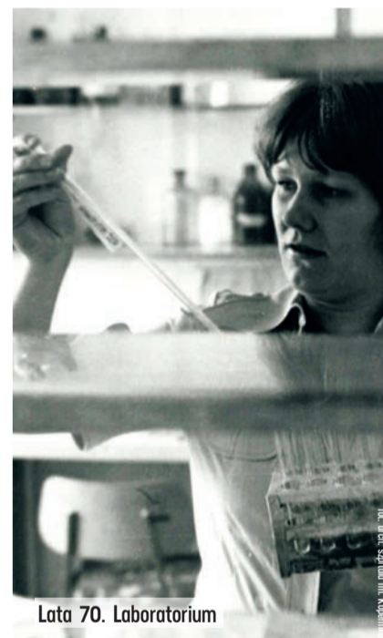
Lata 70. Laboratorium