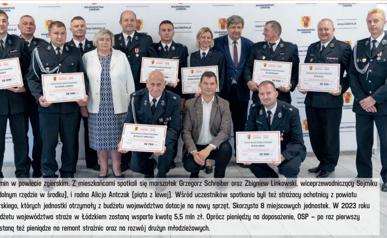
W miejscowości Wólka w powiecie zgierskim. Z mieszkańcami spotkali się marszałek Grzegorz Schreiber oraz Zbigniew Linkowski, wiceprzewodniczący Sejmiku województwa łódzkiego (czwarty z lewej), i radna Alicja Antczak (piąta z lewej). Wśród uczestników spotkania byli też strażacy ochotnicy z powiatu zgierskiego, których jednostki otrzymały z budżetu województwa dotacje na nowy sprzęt. Skorzysta 8 miejscowych jednostek. W 2023 roku z budżetu województwa straż w Łódzkiem zostaną wsparte kwotą 5,5 mln zł. Oprócz pieniędzy na wyposażenie, OSP – po raz pierwszy otrzymają też pieniądze na remont strażnic oraz na rozwój drużyn młodzieżowych.