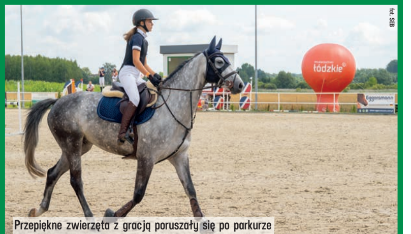
Przepiękne zwierzęta z gracją poruszały się po parkurze