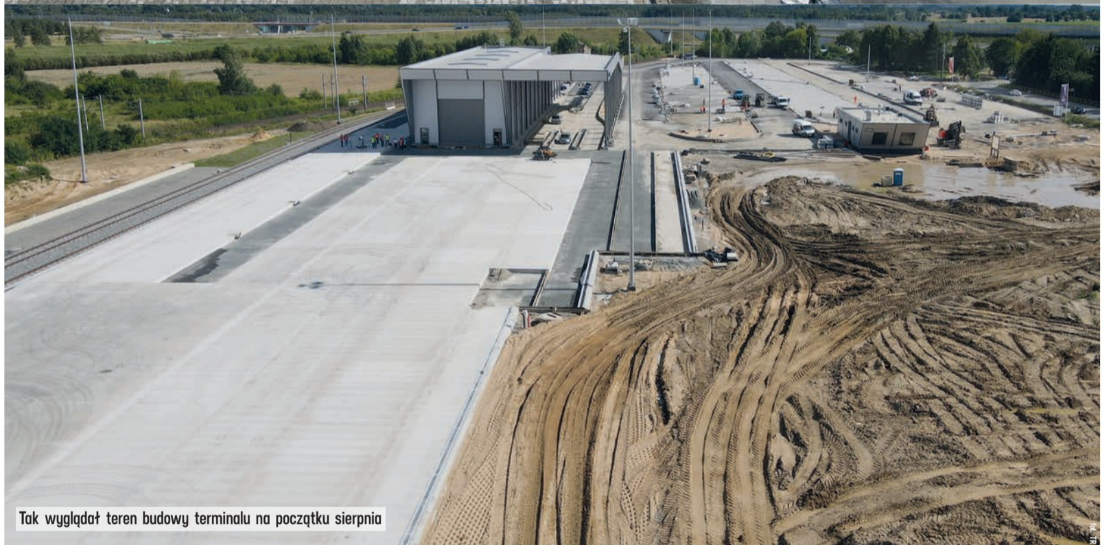
Tak wyglądał teren budowy terminalu na początku sierpnia

- Budowę portu przez lata obiecywało wielu lokalnych samorządowców. Ale z tych słów niewiele wynikało. Pewnie brakowało determinacji, brakowało niezbędnego porozumienia ponad podziałami. Mnie tej determinacji nie zabrakło. Tak jak chęci do rozmów na różnych szczeblach, aby ta inwestycja w końcu została zrealizowana - mówi marszałek Grzegorz Schreiber,