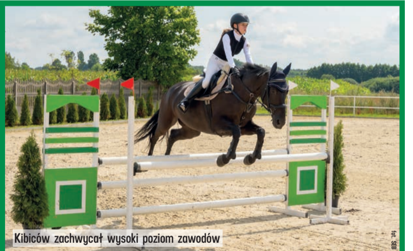
Kibiców zachwycał wysoki poziom zawodów