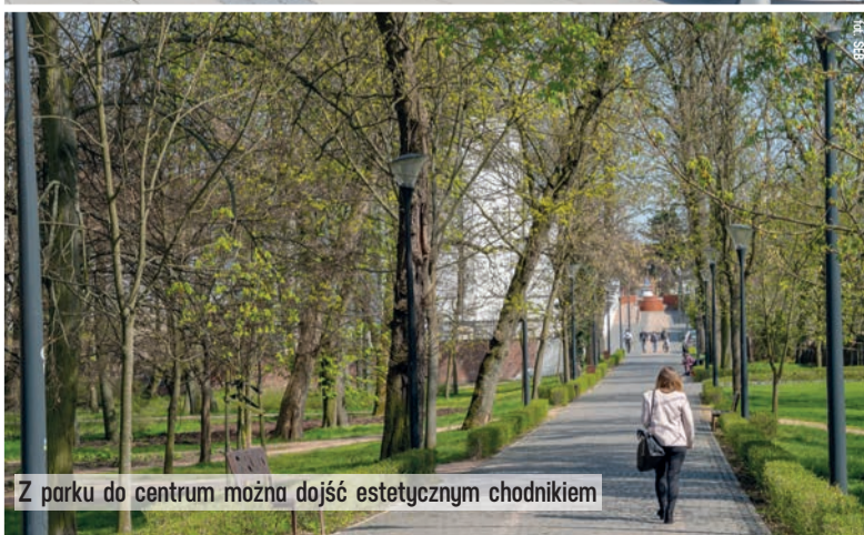
Z parku do centrum można dojść estetycznym chodnikiem