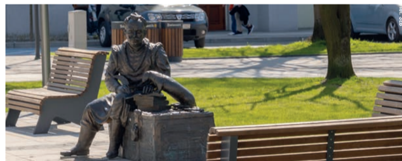
Na placu Piłsudskiego ustawiona została ławeczka Jana Chryzostoma Paska, marszałka sejmiku rawskiego w 1661 roku i autora pamiątek opisujących m.in. życie w Rawie i regionie. Pasek uczył się w dawnym Kolegium Jezuickim w Rawie