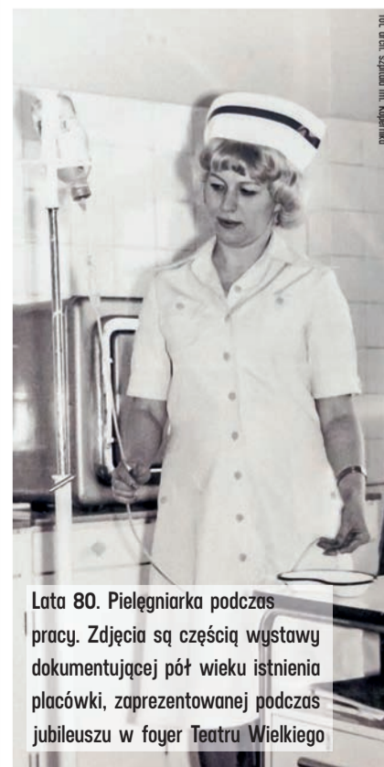
Lata 80. Pielęgniarka podczas pracy. Zdjęcia są częścią wystawy dokumentującej pół wieku istnienia placówki, zaprezentowanej podczas jubileuszu w foyer Teatru Wielkiego