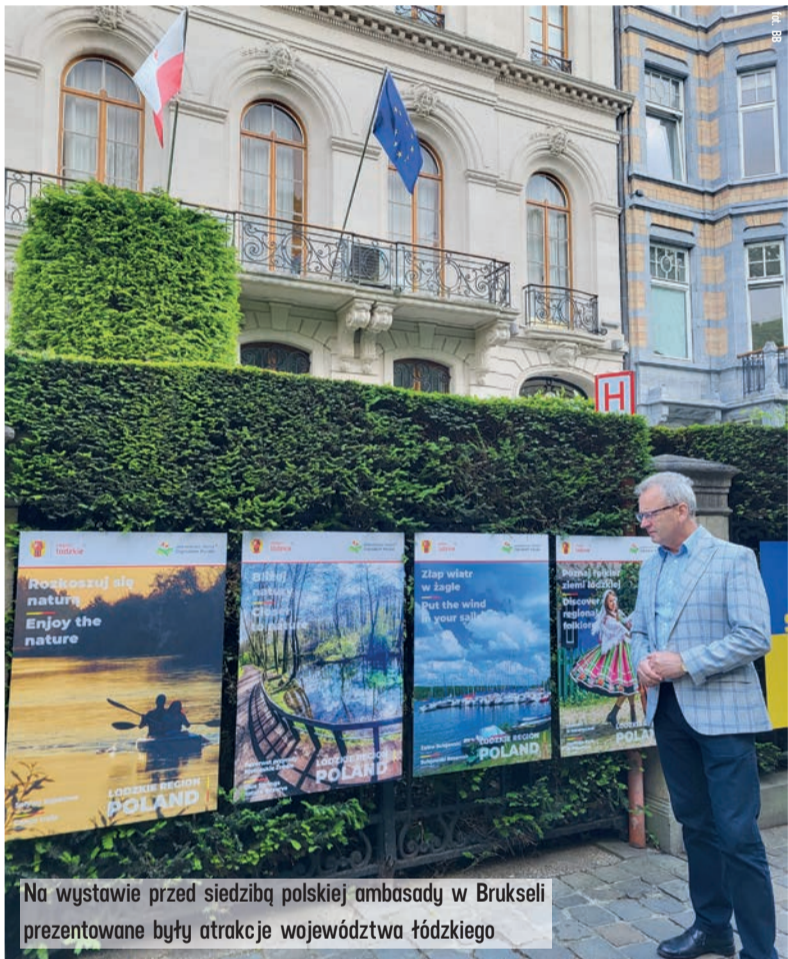
Na wystawie przed siedzibą polskiej ambasady w Brukseli prezentowane były atrakcje województwa łódzkiego