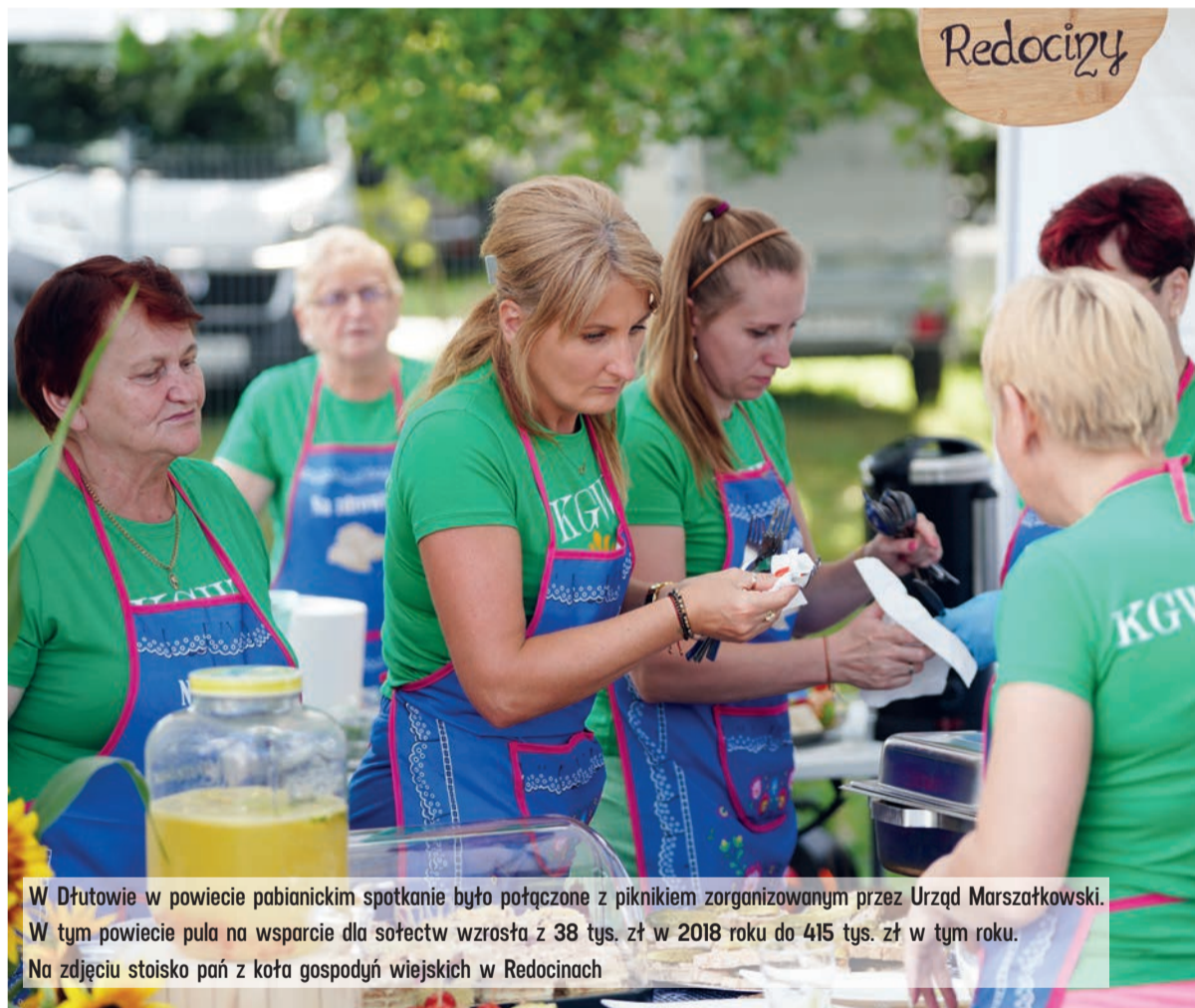
W Dłutowie w powiecie pabianickim spotkanie było połączone z piknikiem zorganizowanym przez Urząd Marszałkowski. W tym powiecie pula na wsparcie dla sołectw wzrosła z 38 tys. zł w 2018 roku do 415 tys. zł w tym roku. Na zdjęciu stoisko pań z koła gospodyń wiejskich w Redocinach