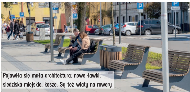
Pojawiła się mała architektura: nowe ławki, siedziska miejskie, kosze. Są też wiaty na rowery