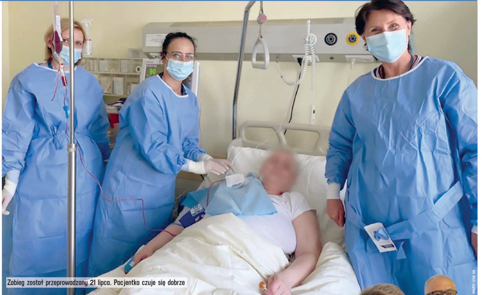
Zabieg został przeprowadzony 21 lipca. Pacjentka czuje się dobrze

- Ta nowoczesna terapia daje chorym nadzieję na całkowite wyleczenie. Jestem niezwykle dumny, że szpi-