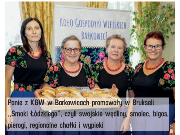
Panie z KGW w Barkowicach promowały w Brukseli „Smaki Łódzkiego”, czyli swojskie wędliny, smalec, bigos, pierogi, regionalne chałki i wypieki