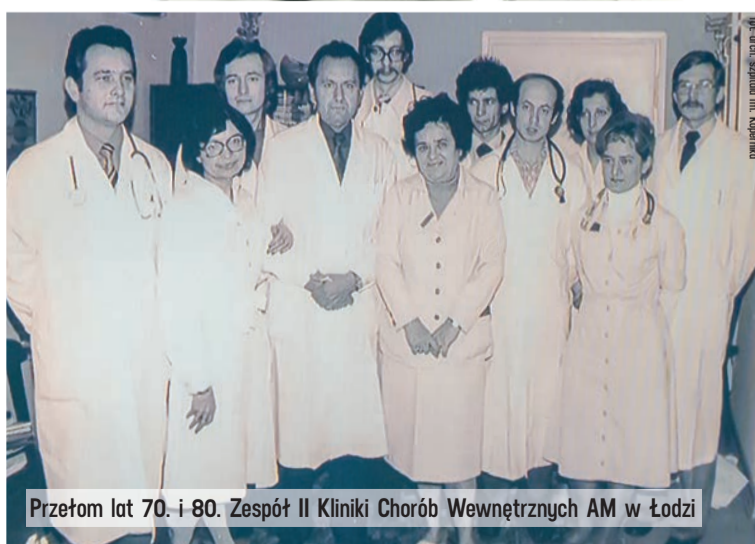
Przełom lat 70. i 80. Zespół II Kliniki Chorób Wewnętrznych AM w Łodzi