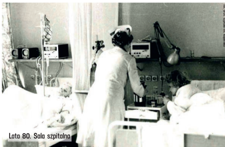
Lata 80. Sala szpitalna

- Szpital im. Kopernika to placówka ważna dla całego województwa łódzkiego i chluba naszego regionu. Jako samorząd województwa zdajemy sobie sprawę z jego znaczenia dla zdrowia mieszkańców, dlatego staramy się, aby był dobrze wyposażony i żeby personel miał świetne warunki pracy. To wsparcie przynosi bardzo wymierne korzyści pacjentom. Wybitni specjaliści oraz nowoczesny sprzęt pozwalają sięgać po nowatorskie, coraz skuteczniejsze metody leczenia. Ma to niebagatelne znaczenie, zwłaszcza w walce z nowotworami. Osobiście mam dużo wdzięczności dla personelu szpitala, ponieważ kilkanaście lat temu szybkie i skuteczne działania lekarzy uratowały zdrowie mojego syna tuż po urodzeniu. Z okazji jubileuszu gratuluję obecnym i byłym pracownikom oraz życzę dalszych sukcesów.