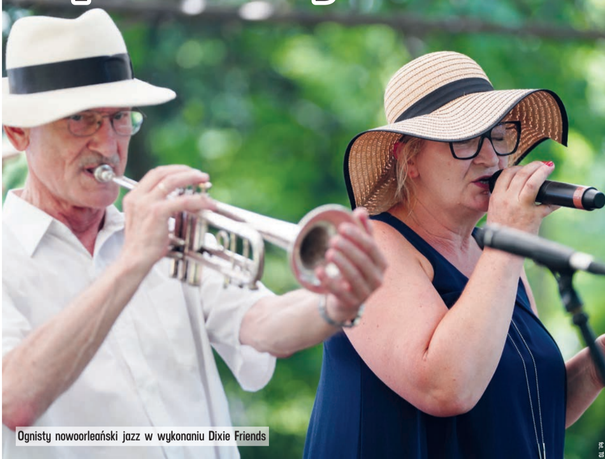
Ognisty nowoorleański jazz w wykonaniu Dixie Friends

W połowie lipca w Muzeum Pałac Herbsta w Łodzi rozpoczął się cykl letnich koncertów. W pięknym otoczeniu pałacowego ogrodu można posłuchać muzyki rozrywkowej we wspaniałych aranżacjach.