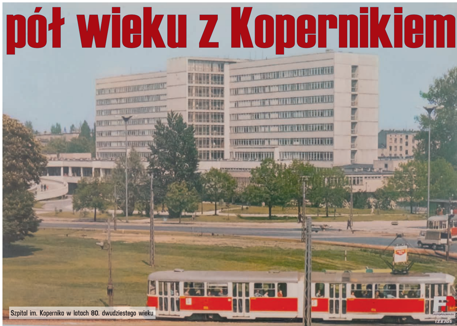
Szpital im. Kopernika w latach 80. dwudziestego wieku