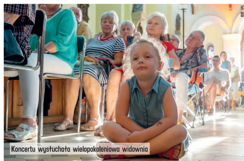
Koncertu wysłuchała wielopokoleniowa widownia