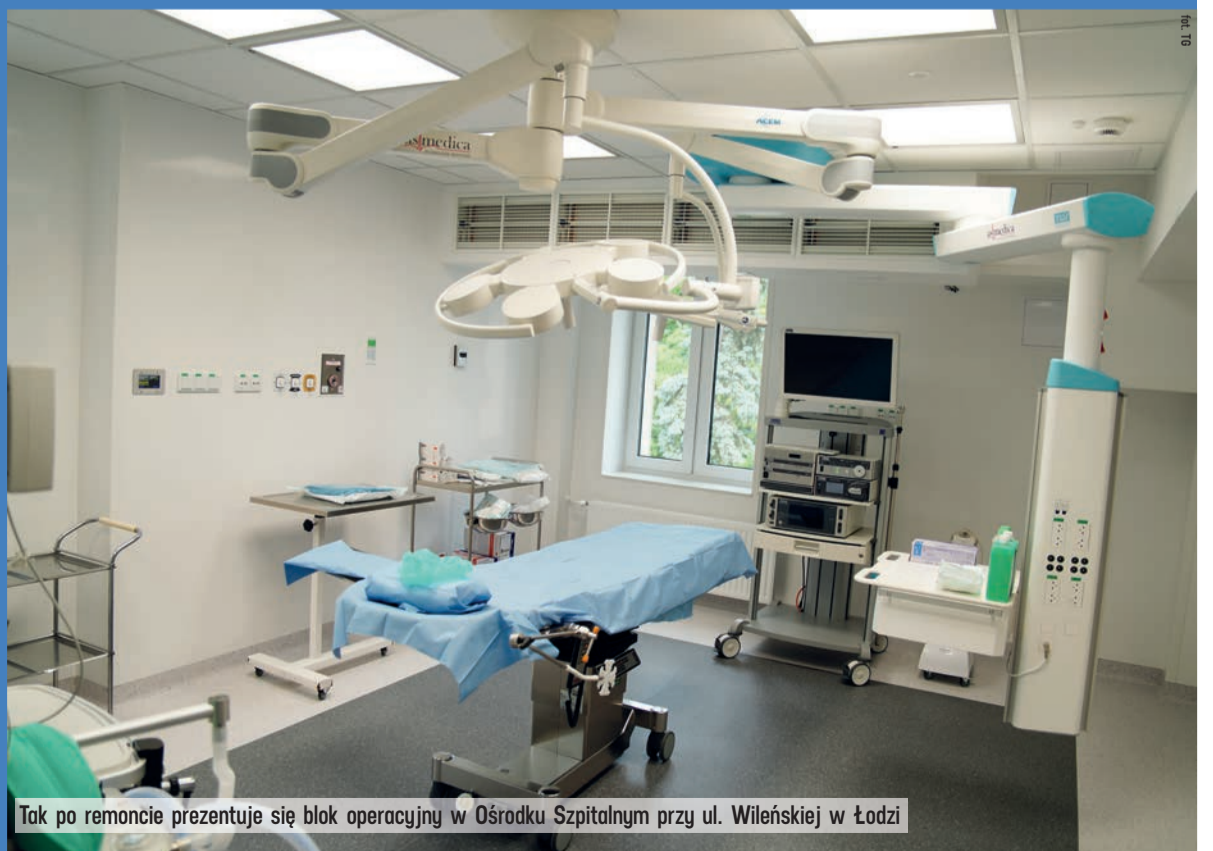
Tak po remoncie prezentuje się blok operacyjny w Ośrodku Szpitalnym przy ul. Wileńskiej w Łodzi