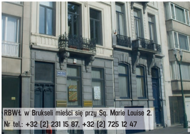
RBWŁ w Brukseli mieści się przy Sq. Marie Louise 2. Nr tel.: +32 (2) 231 15 87, +32 (2) 725 12 47

Regionalne Biuro Województwa Łódzkiego w Brukseli od dwóch dekad koordynuje działania między województwem a środowiskiem biznesu, sektorem publicznym i organizacjami społecznymi. Jest ważnym miejscem spotkań przedsiębiorców z naszego województwa, którzy chcą zdobywać europejskie rynki i pomaga firmom z Łódzkiego w nawiązywaniu kontaktów biznesowych w krajach Beneluksu, m.in. podczas targów międzynarodowych. Odgrywa też nieocenioną rolę w promowaniu kultury i dziedzictwa regionu łódzkiego podczas Dni Polskich w Brukseli.