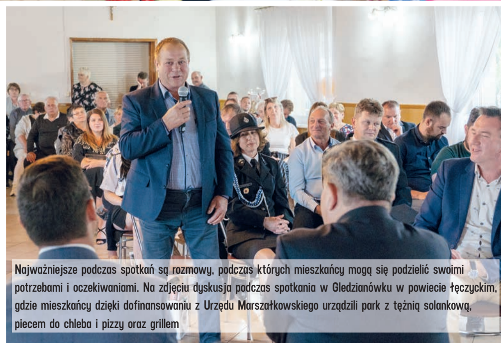
Najważniejsze podczas spotkań są rozmowy, podczas których mieszkańcy mogą się podzielić swoimi potrzebami i oczekiwaniemi. Na zdjęciu dyskusja podczas spotkania w Gledzianówku w powiecie łęczyckim, gdzie mieszkańcy dzięki dofinansowaniu z Urzędu Marszałkowskiego urządzili park z tętnią solankową, piecem do chleba i pizzy oraz grill