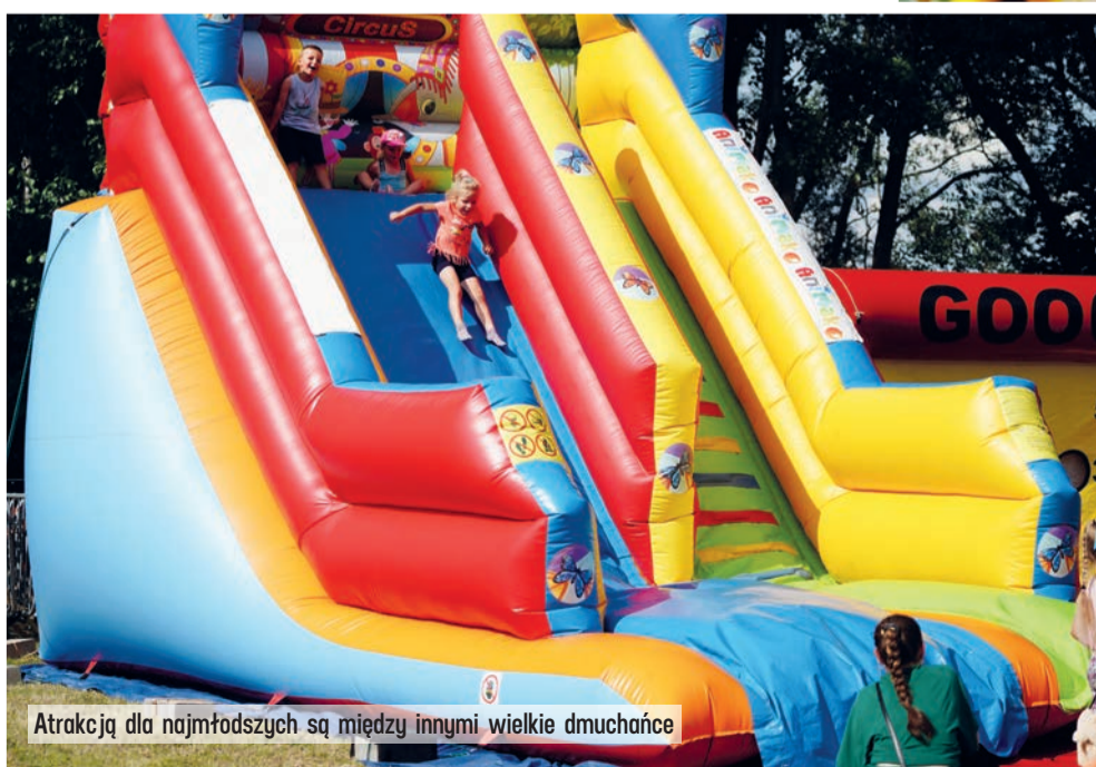
Atrakcją dla najmłodszych są między innymi wielkie dmuchańce