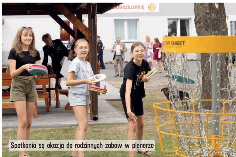
Spotkania są okazją do rodzinnych zabaw w plenerze