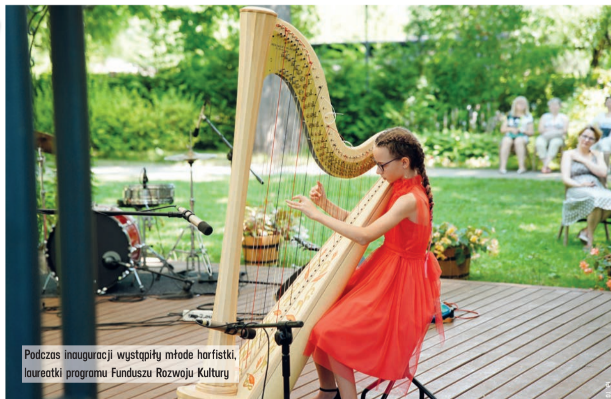
Podczas inauguracji wystąpiły młode harfistki, laureatki programu Funduszu Rozwoju Kultury