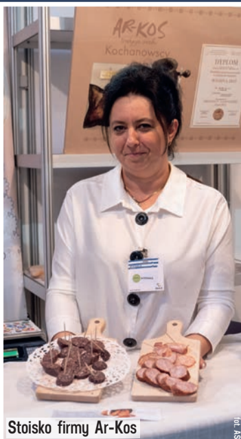
Stoisko firmy Ar-Kos