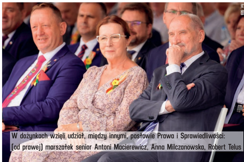
W dożynkach wzięli udział, między innymi, postawie Prawa i Sprawiedliwości: [od prawej] marszałek senior Antoni Macierewicz, Anna Milczanowska, Robert Telus