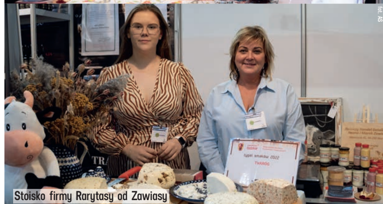
Stoisko firmy Rarytasy od Zawiasy