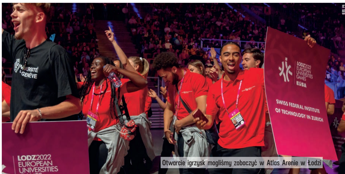
Otwarcie igrzysk mogliśmy zobaczyć w Atlas Arenie w Łodzi