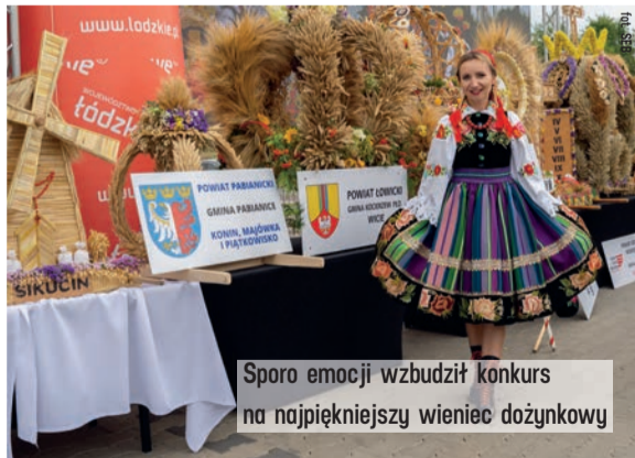
Sporo emocji wzbudził konkurs na najpiękniejszy wieniec dożynkowy