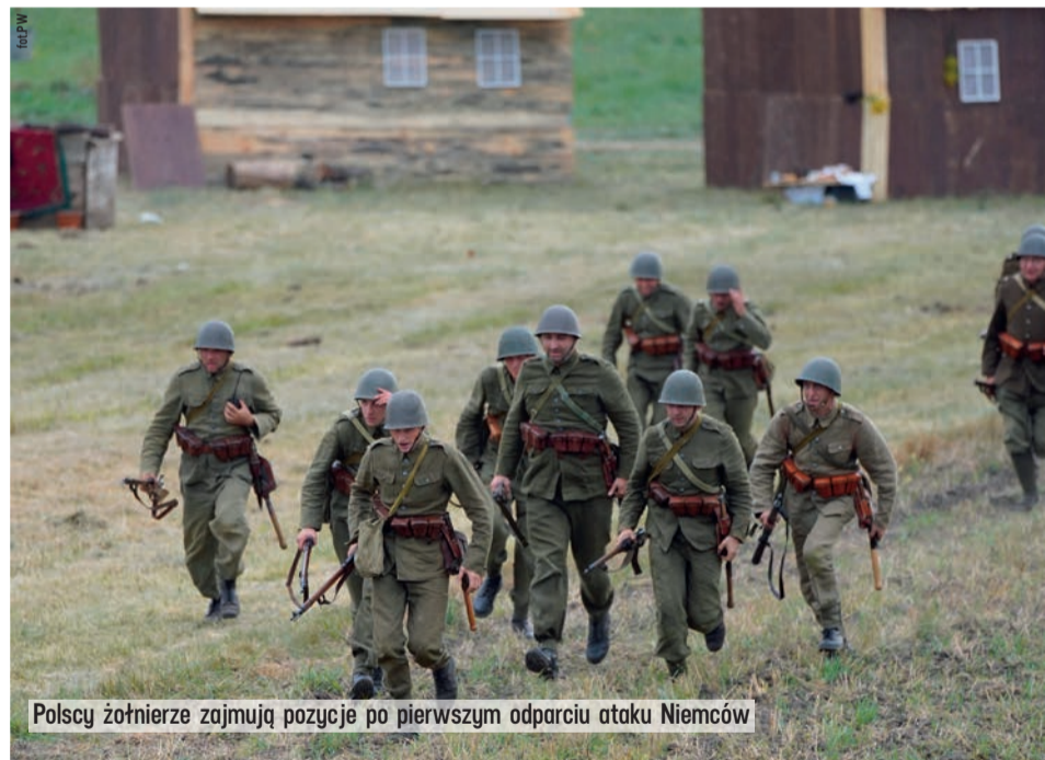
Polscy żołnierze zajmują pozycje po pierwszym odparciu ataku Niemców