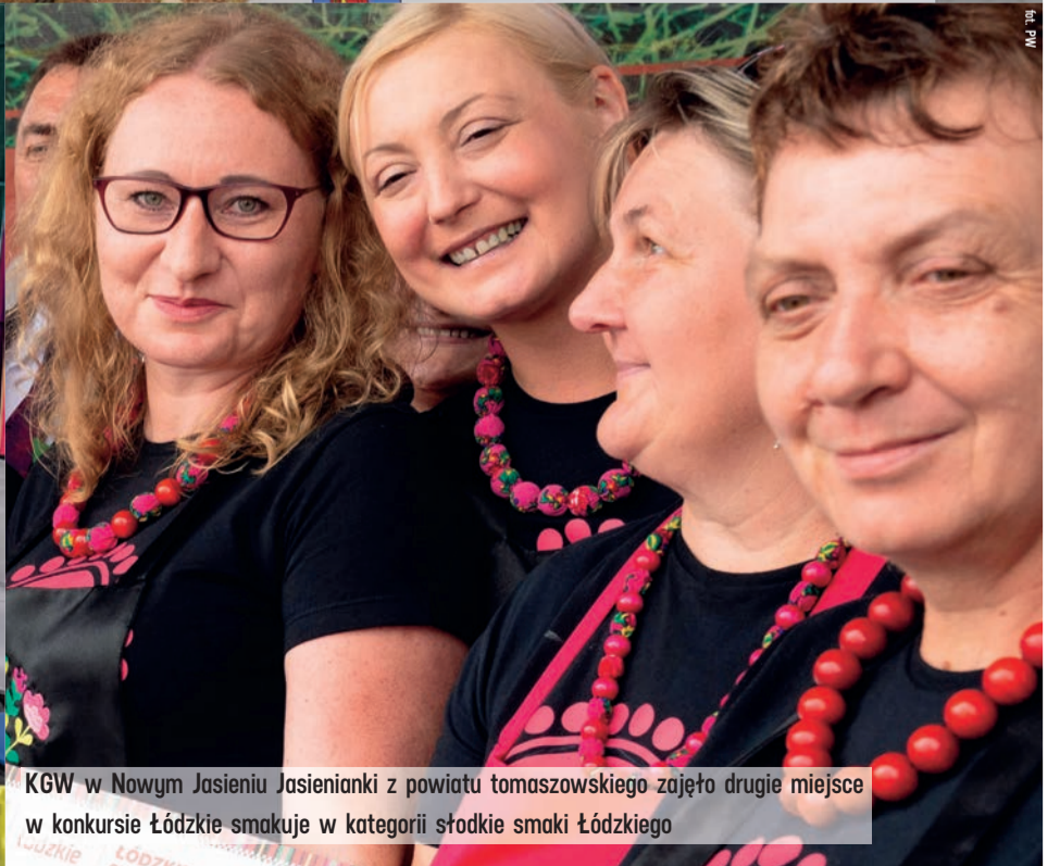
KGW w Nowym Jasieniu Jasienianki z powiatu tomaszowskiego zajęło drugie miejsce w konkursie Łódzkie smakuje w kategorii słodkie smaki Łódzkiego