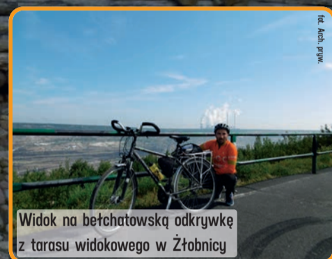
Widok na bełchatowską odkrywkę z tarasu widokowego w Żłobnicy