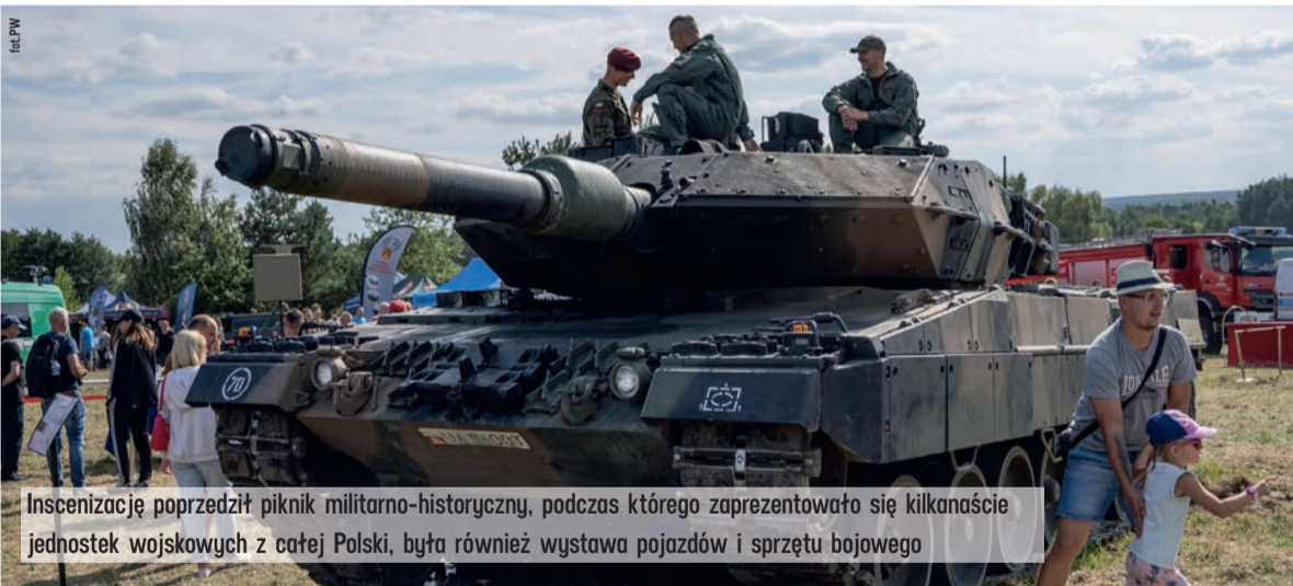
Inscenizację poprzedził piknik militarno-historyczny, podczas którego zaprezentowało się kilkanaście jednostek wojskowych z całej Polski, była również wystawa pojazdów i sprzętu bojowego