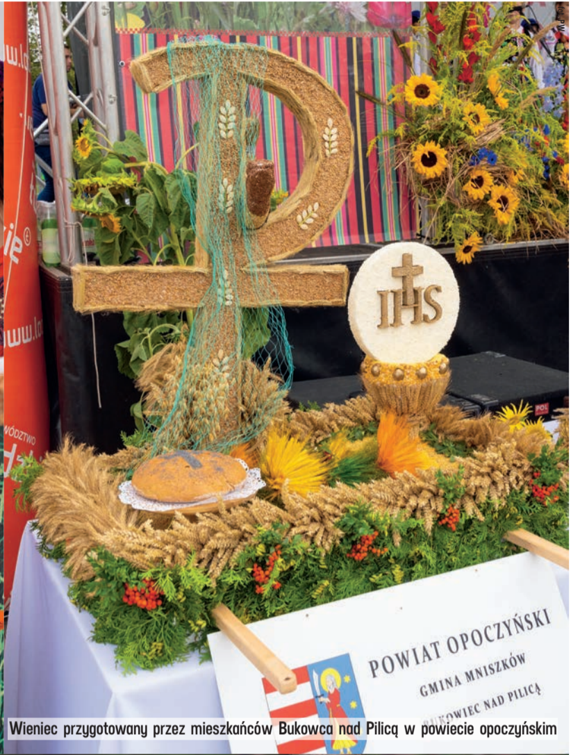
Wieniec przygotowany przez mieszkańców Bukowca nad Pilicą w powiecie opoczyńskim