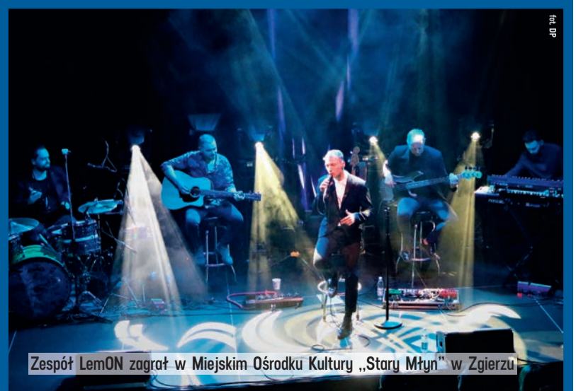
Zespół LemON zagrał w Miejskim Ośrodku Kultury „Stary Młyn” w Zgierzu