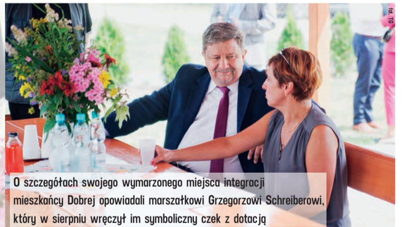
O szczegółach swojego wymarzonego miejsca integracji mieszkańcy Dobrej opowiadali marszałkowi Grzegorzowi Schreiberowi, który w sierpniu wręczył im symboliczny czek z dotacją

to tegoroczny budżet projektu Infrastruktura Sołecka Plus