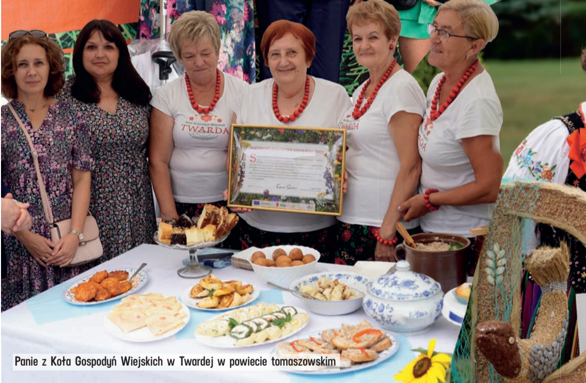
Panie z Koła Gospodyń Wiejskich w Twardej w powiecie tomaszowskim