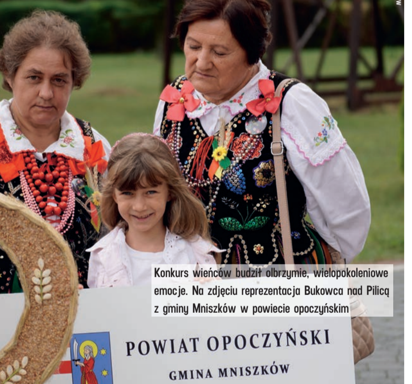
Konkurs wieńców budził olbrzymie, wielopokoleniowe emocje. Na zdjęciu reprezentacja Bukowca nad Pilicą z gminy Mniszków w powiecie opoczyńskim