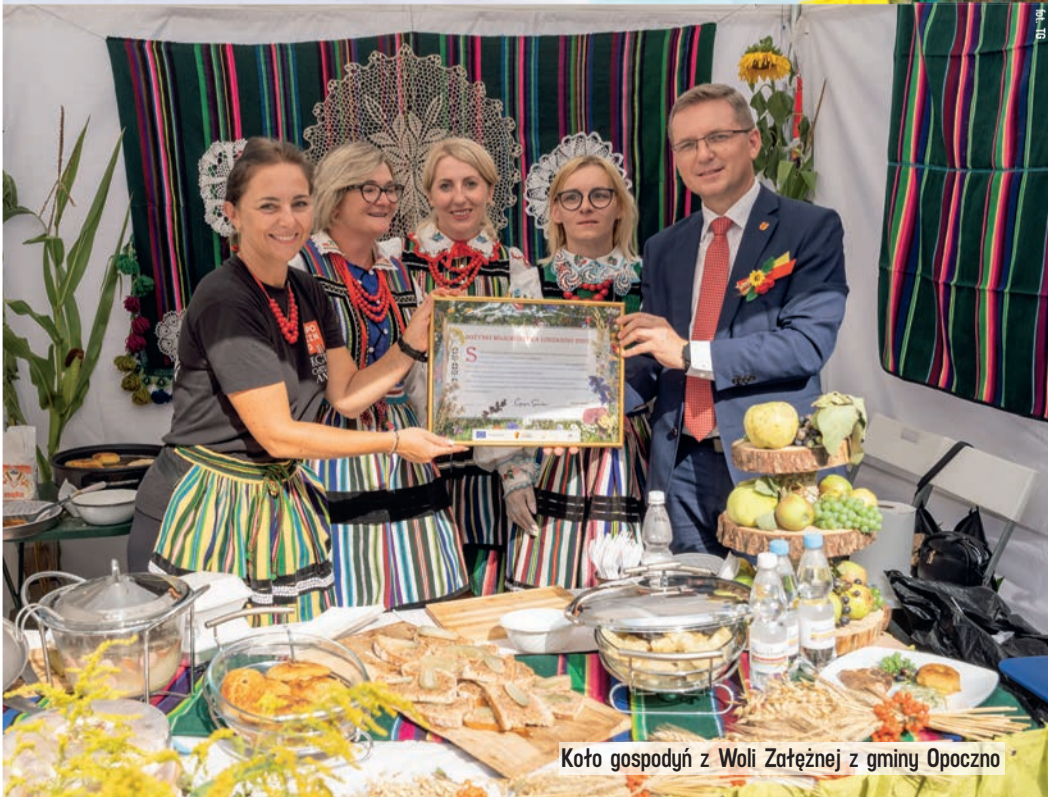
Koło gospodyń z Woli Załężnej z gminy Opoczno