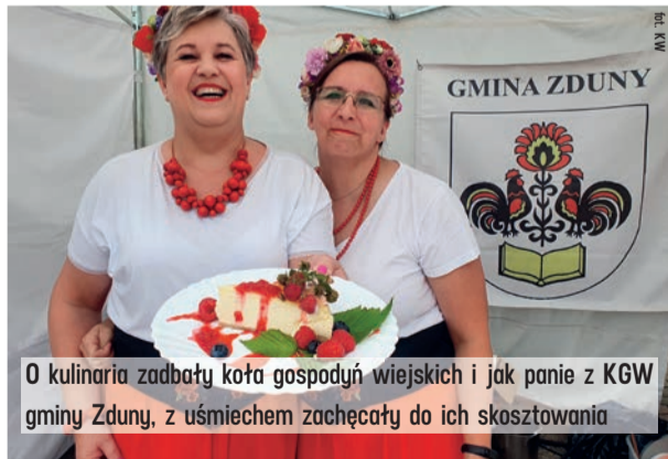
O kulinaria zadbały koła gospodyń wiejskich i jak panie z KGW gminy Zduny, z uśmiechem zachęcały do ich skosztowania

KGW Górczynianki (pow. łaski) - za tartę z konfiturą