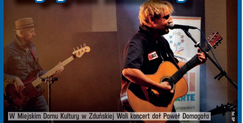
W Miejskim Domu Kultury w Zduńskiej Woli koncert dał Paweł Domagała

Koncerty gwiazd w Sieradzu, Piotrkowie Trybunalskim, Skierniewicach, Zgierzu, Bełchatowie i Zduńskiej Woli. Takie były tegoroczne Dni Otwarte Funduszy Europejskich.