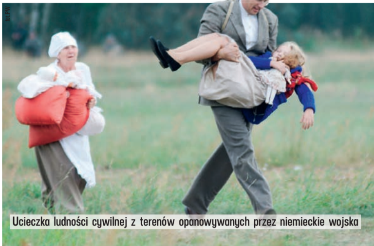
Ucieczka ludności cywilnej z terenów opanowywanych przez niemieckie wojska