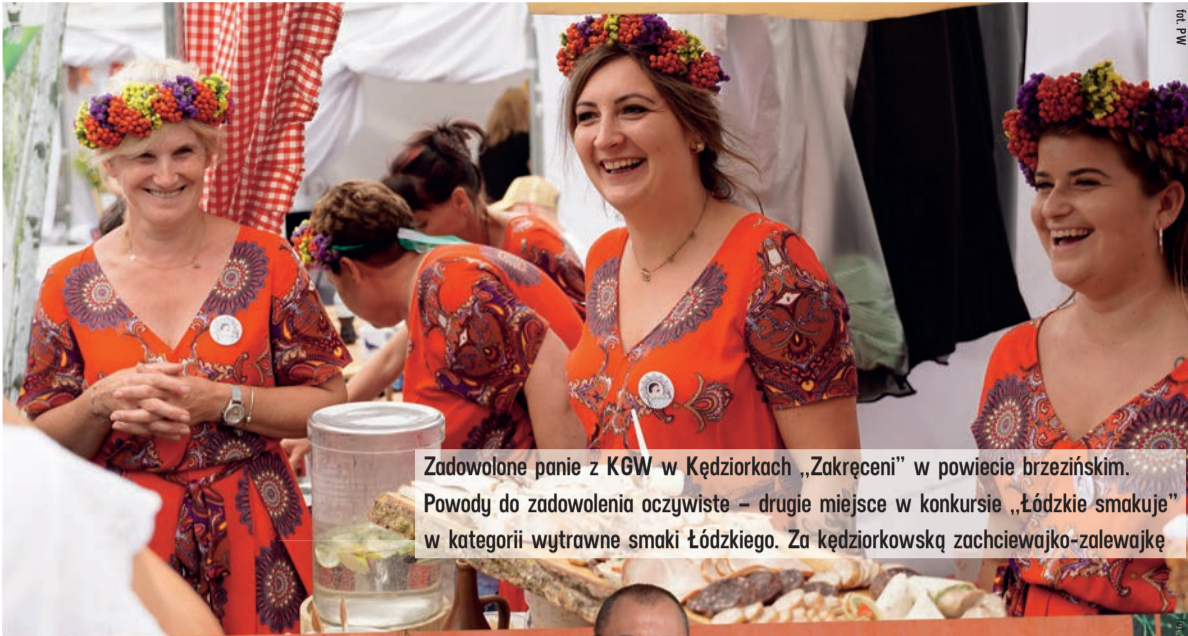
Zadowolone panie z KGW w Kędziorkach „Zakręceń” w powiecie brzezińskim. Powody do zadowolenia oczywiste – drugie miejsce w konkursie „Łódzkie smakuje” w kategorii wytrawne smaki Łódzkiego. Za kędziorkowską zachciewajko-zalewajkę