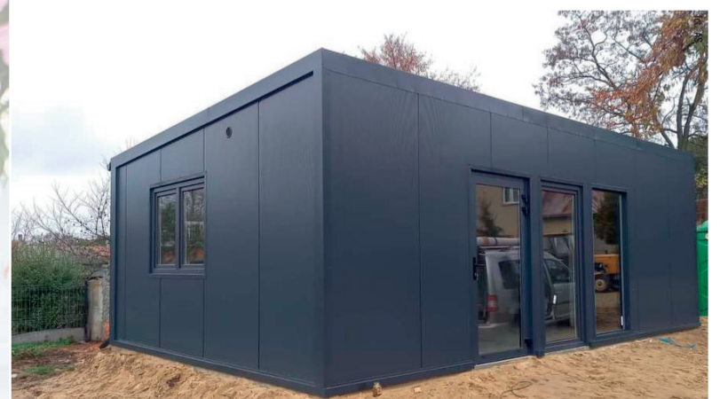
Nowoczesna kontenerowa świetlica w Dobrej już stoi. W połowie listopada rozpoczęło się urządzenie wnętrza