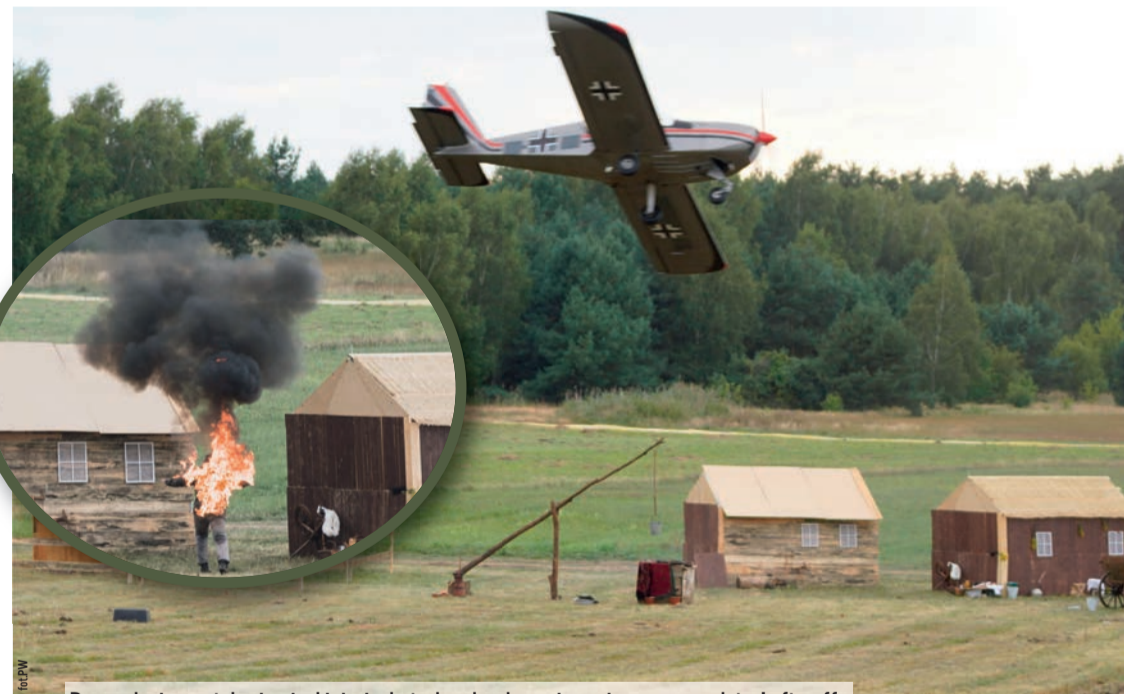
Poprzedzające atak niemieckiej piechoty bombardowanie wsi przez samoloty Luftwaffe