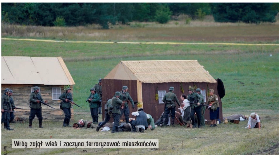
Wróg zajął wieś i zaczyna terroryzować mieszkańców