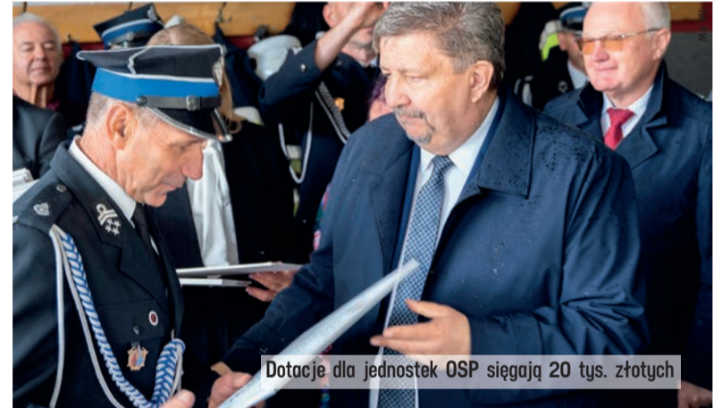
Dotacje dla jednostek OSP sięgają 20 tys. złotych