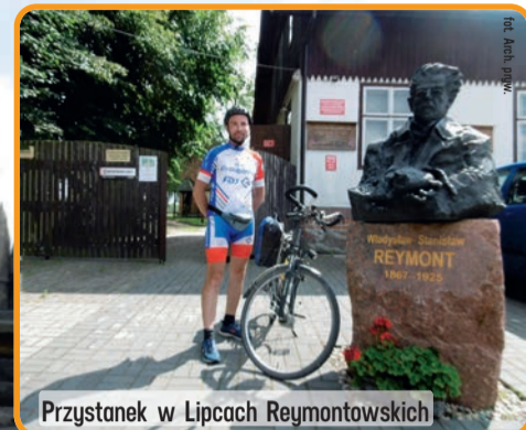
Przystanek w Lipcach Reymontowskich