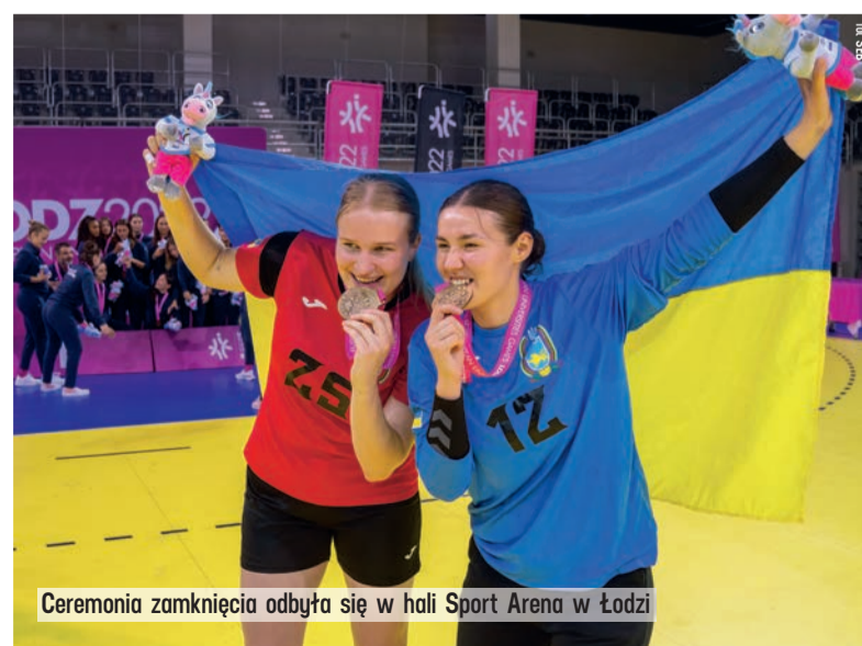
Ceremonia zamknięcia odbyła się w hali Sport Arena w Łodzi