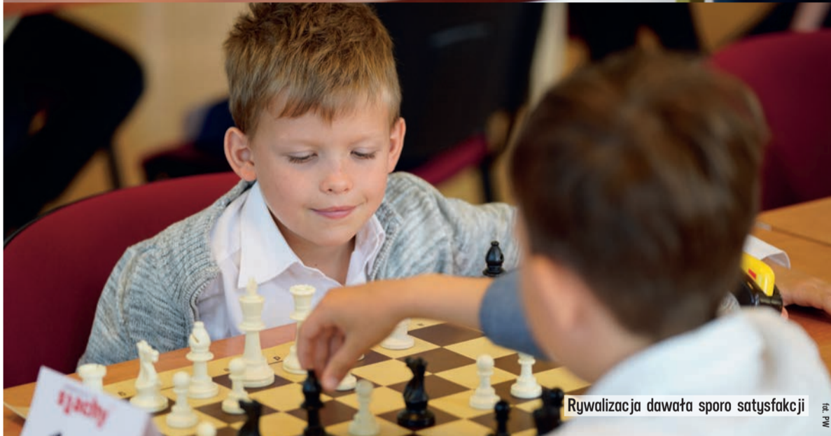
Rywalizacja dawała sporo satysfakcji