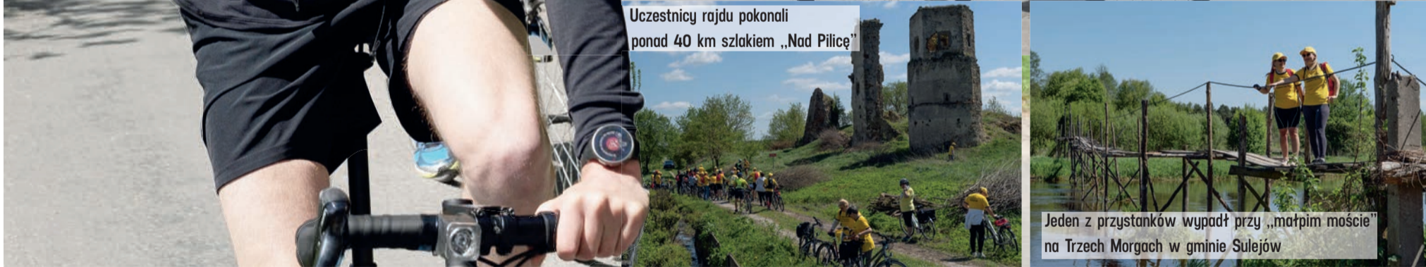
Jeden z przystanków wypadł przy „małpim moście” na Trzech Morgach w gminie Sulejów

Samorząd województwa chętnie dotuje także lokalne ścieżki rowerowe. Przykład? Oddany niedawno w gminie Nieborów pierwszy fragment ścieżki łączącej barokowy zespół pałacowo-parkowy oraz park romantyczny w Arkadii. To ważna trasa, bo Nieborów to jedno z cenniejszych miejsc na turystycznej mapie województwa. Oddany do użytku fragment liczy ponad kilometr. Biegnie równoległe do drogi krajowej nr 70, która jest jedynym połączeniem pałacu w Nieborowie i ogrodu w Arkadii, co ze względu na natężenie ruchu wyklucza możliwość turystyki rowerowej. Ścieżka stanowi część projektu gminy Nieborów, który został wsparty przez Urząd Marszałkowski kwotą ponad 600 tysięcy złotych z Regionalnego Programu Operacyjnego.