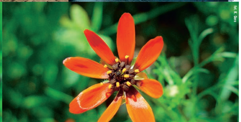
Park Krajobrazowy Międzyrzecza Warty i Widawki. Miłek letni