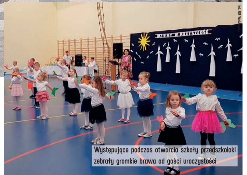
Występujące podczas otwarcia szkoły przedszkolaki zebrały gromkie brawa od gości uroczystości

- Inwestycje, które pozwalają podnosić standardy nauczania, to te, na których nam, jako samorządowi województwa, szczególnie zależy. Dzięki szkole w Kwiatkowicach dzieci w końcu będą mogły się uczyć na miejscu. To dla nich i dla ich rodzin wygodniejsze i bezpieczniejsze. Równie ważny jest fakt, że szkoła została zbudowana z wykorzystaniem nowoczesnych, ekologicznych technologii. Dbałość o środowisko to także jeden z naszych priorytetów.