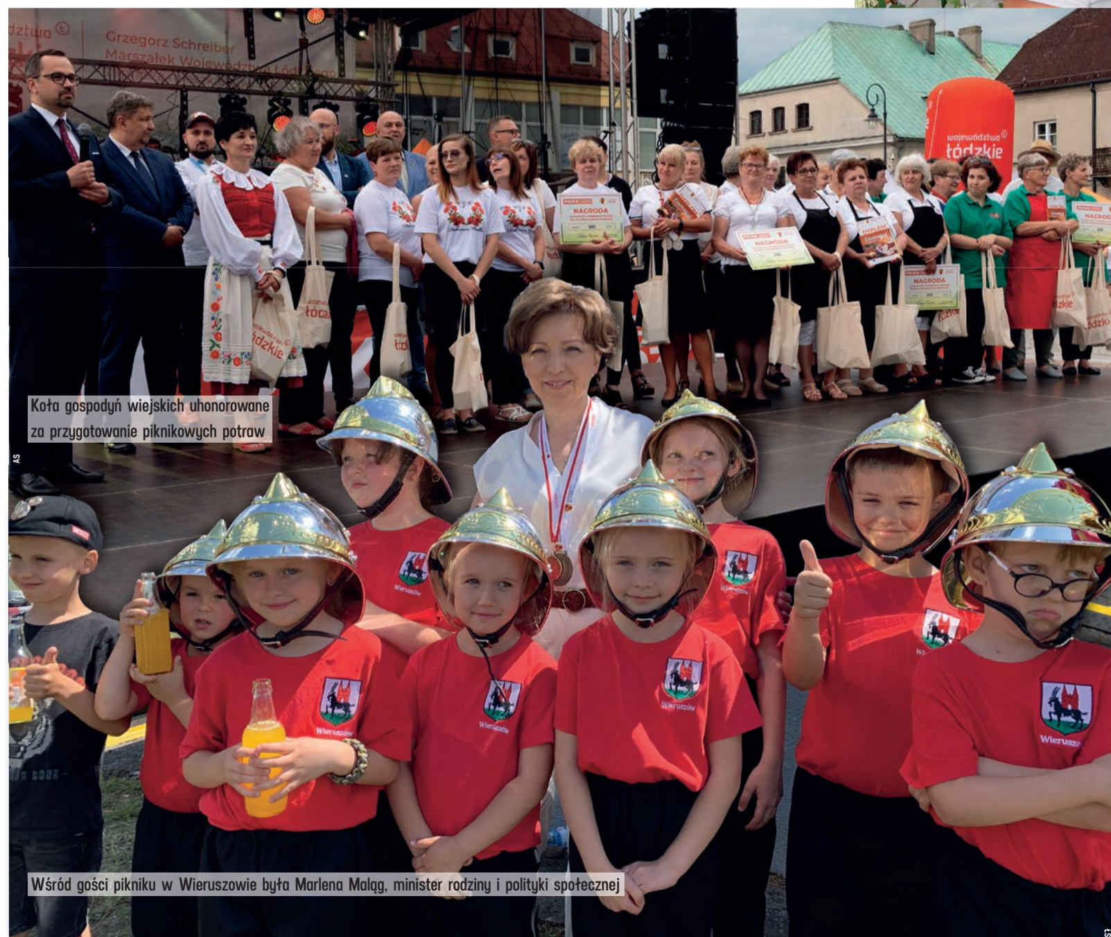
Koła gospodyń wiejskich uhonorowane za przygotowanie piknikowych potraw