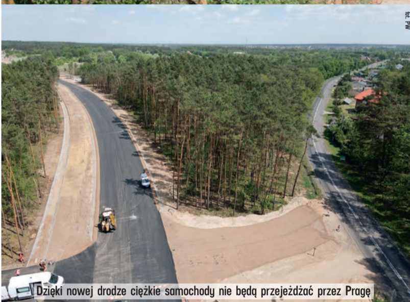
Dzięki nowej drodze ciężkie samochody nie będą przejeżdżać przez Pragę