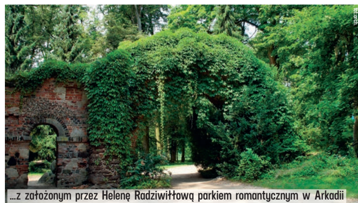
...z założonym przez Helenę Radziwiłłową parkiem romantycznym w Arkadii