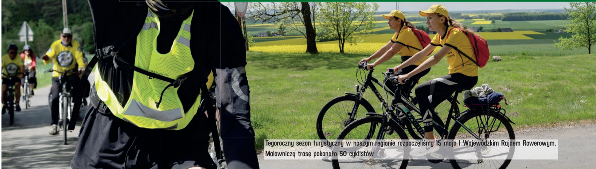
Tegoroczny sezon turystyczny w naszym regionie rozpoczęliśmy 15 maja I Wojewódzkim Rajdem Rowerowym. Malowniczą trasę pokonało 50 cyklistów