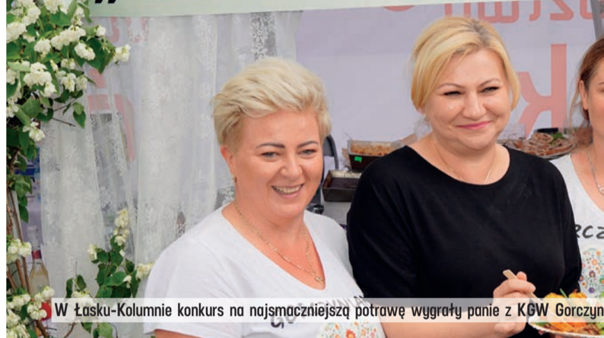
W Łasku-Kolumnie konkurs na najsmaczniejszą potrawę wygrały panie z KGW Gorczyńnianki

KOŁO GOSPODYNI WIEJSKICH „GORCZYŃNIANKI”