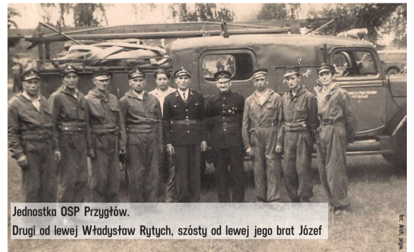
Jednostka OSP Przygłów.