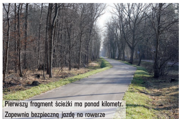
Pierwszy fragment ścieżki ma ponad kilometr. Zapewnia bezpieczną jazdę na rowerze