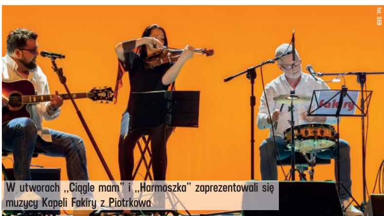
W utworach „Ciągłe mam” i „Harmoszka” zaprezentowali się muzycy Kapeli Fakiry z Piotrkowa