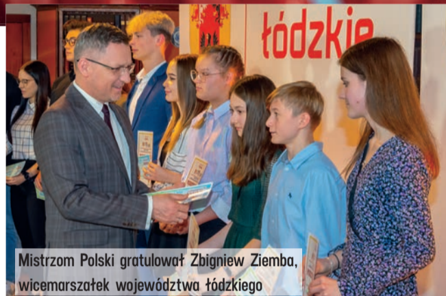
Mistrzom Polski gratulował Zbigniew Ziemia, wicemarszałek województwa łódzkiego