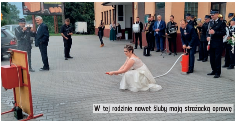
W tej rodzinie nawet śluby mają strażacką oprawę