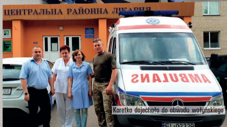
Karetka dojechała do obwodu wołyńskiego