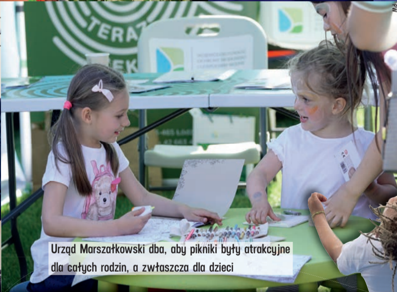
Urząd Marszałkowski dba, aby pikniki były atrakcyjne dla całych rodzin, a zwłaszcza dla dzieci