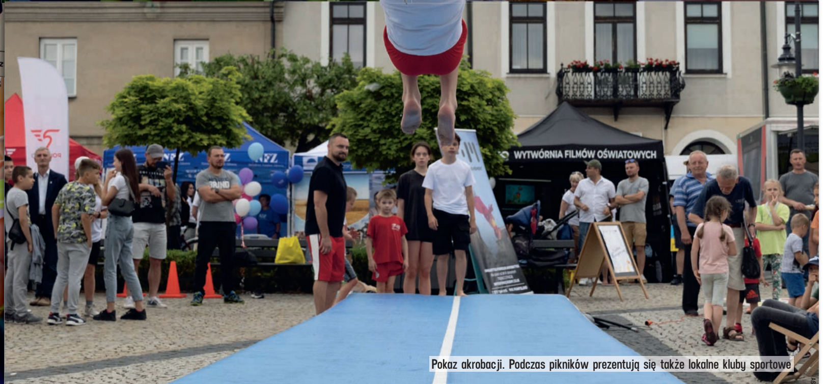
Pokaz akrobacji. Podczas pikników prezentują się także lokalne kluby sportowe