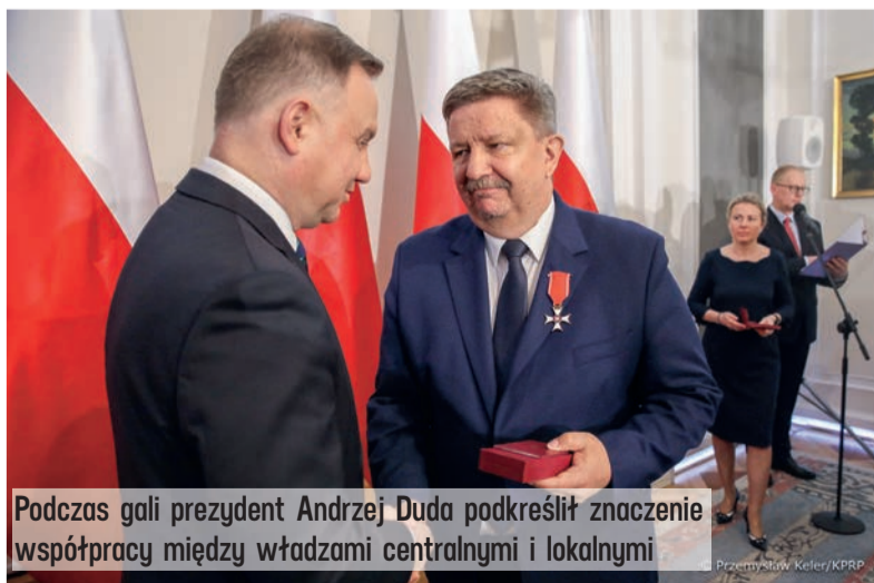
Podczas gali prezydent Andrzej Duda podkreślił znaczenie współpracy między władzami centralnymi i lokalnymi