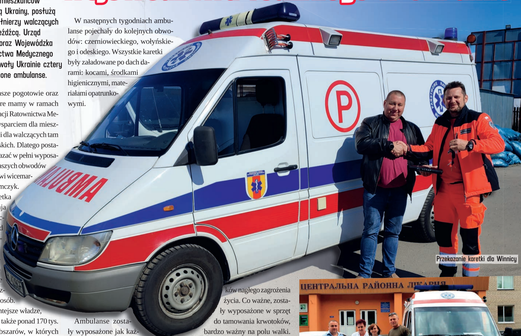
Przekazanie karetki dla Winnicy