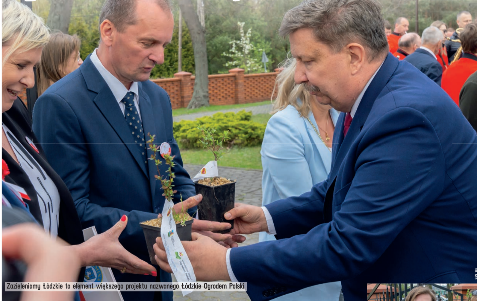
Zazieleniamy Łódzkie to element większego projektu nazwanego Łódzkie Ogrodem Polski

W Białej koło Zgierza zainaugurowany został projekt Zazieleniamy Łódzkie.