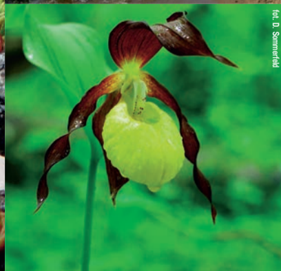
Przedborski Park Krajobrazowy. Obuwik