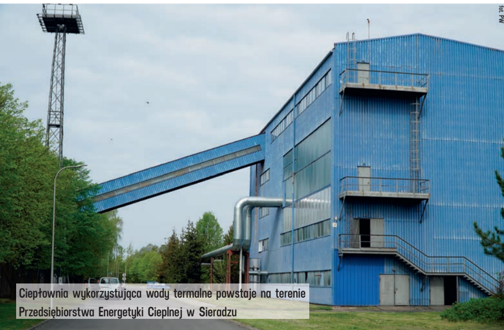
Ciepłownia wykorzystująca wody termalne powstaje na terenie Przedsiębiorstwa Energetyki Ciepłej w Sieradzu