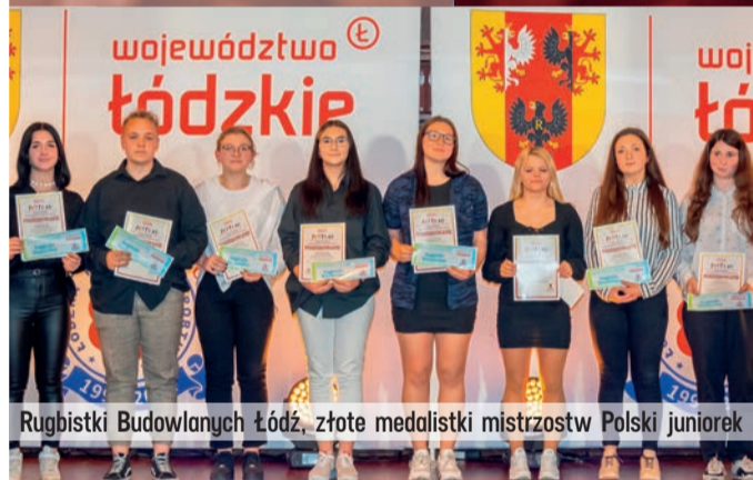
Rugbistki Budowlanych Łódź, złote medalistki mistrzostw Polski junierek