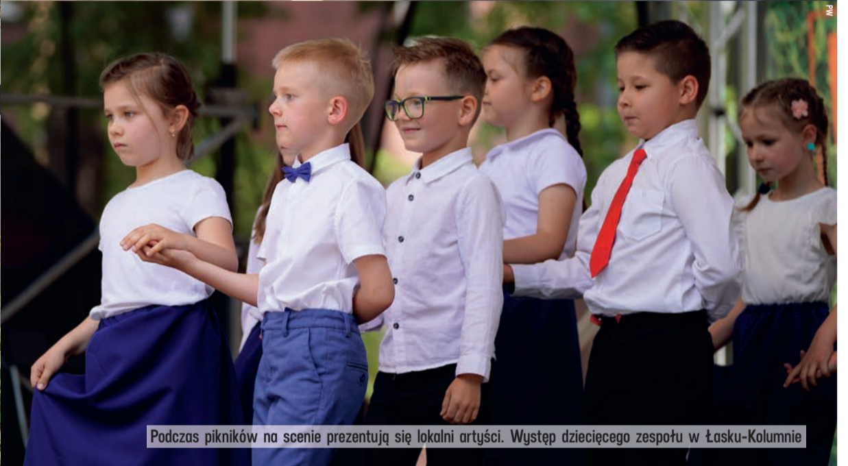
Podczas pikników na scenie prezentują się lokalni artyści. Występ dziecięcego zespołu w Łasku-Kolumnie