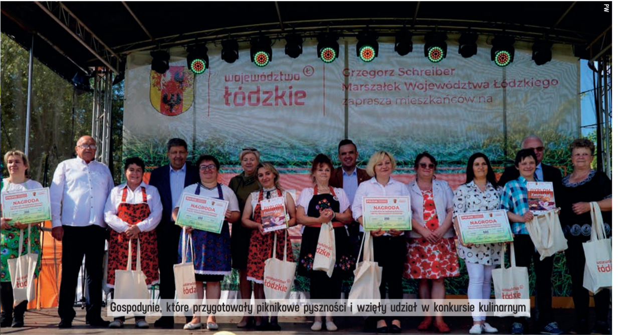
Gospodynie, które przygotowały piknikowe pyszności i wzięły udział w konkursie kulinarnym