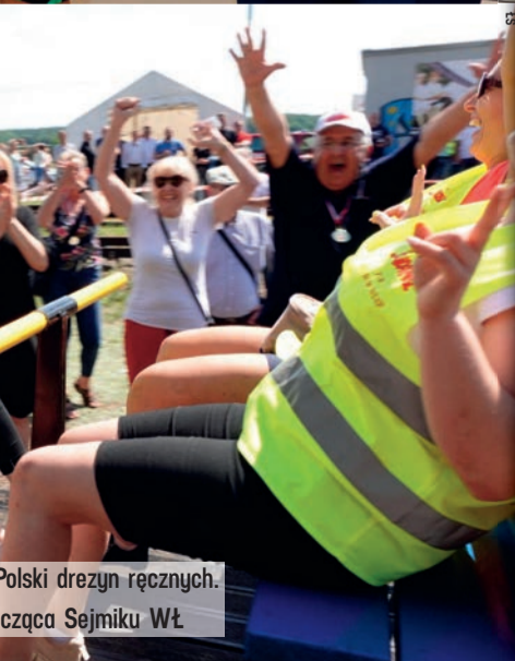
Polski drezyn ręcznych. cząca Sejmiku WŁ.