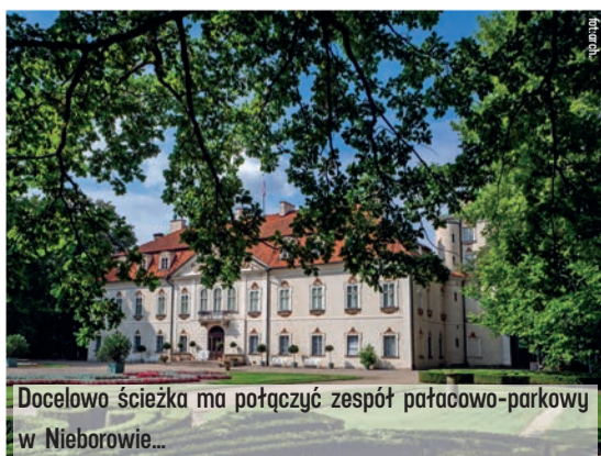
Docelowo ścieżka ma połączyć zespół pałacowo-parkowy w Nieborowie...