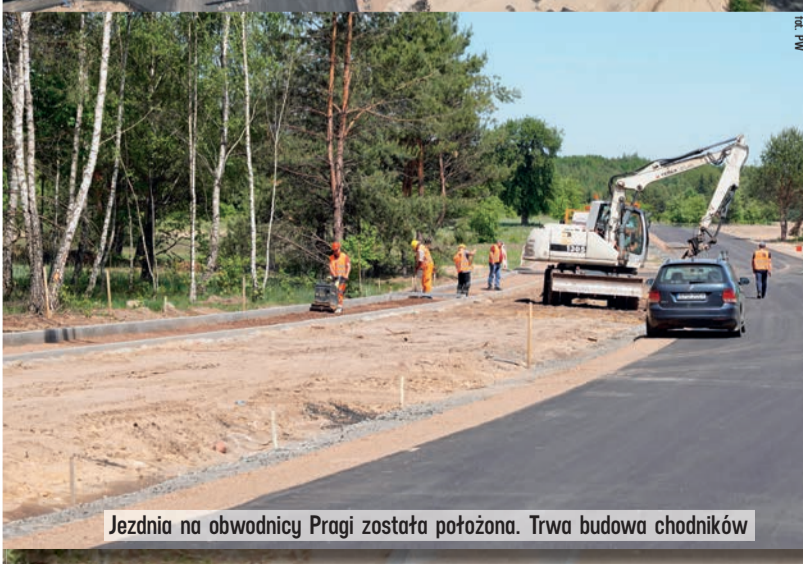
Jezdnia na obwodnicy Pragi została położona. Trwa budowa chodników