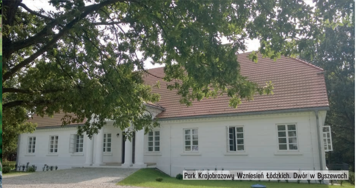
Park Krajobrazowy Wzniesień Łódzkich. Dwór w Byszewach