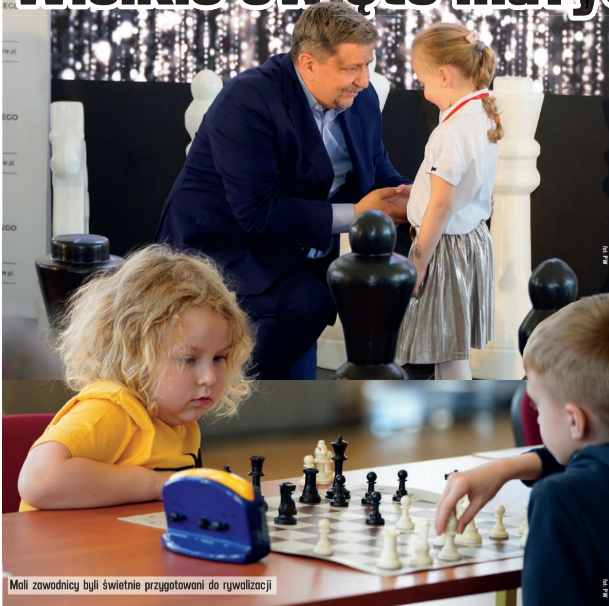
Mali zawodnicy byli świetnie przygotowani do rywalizacji