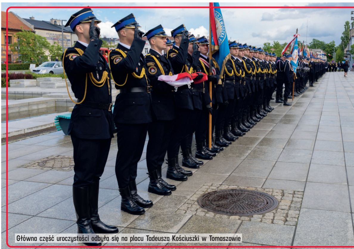
Główna część uroczystości odbyła się na placu Tadeusza Kościuszki w Tomaszowie