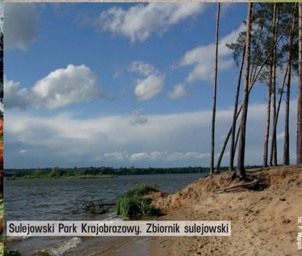
Sulejowski Park Krajobrazowy. Zbiornik sulejowski