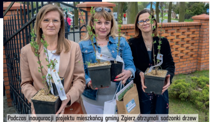
Podczas inauguracji projektu mieszkańcy gminy Zgierz otrzymali sadzonki drzew