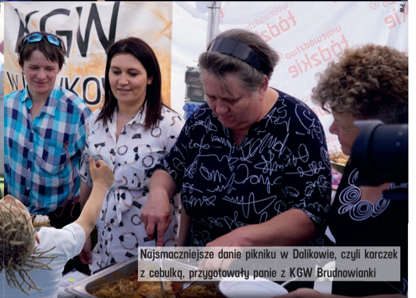
Najsmaczniejsze danie pikniku w Dalikowie, czyli karczek z cebulką, przygotowali panie z KGW Brudnowianki