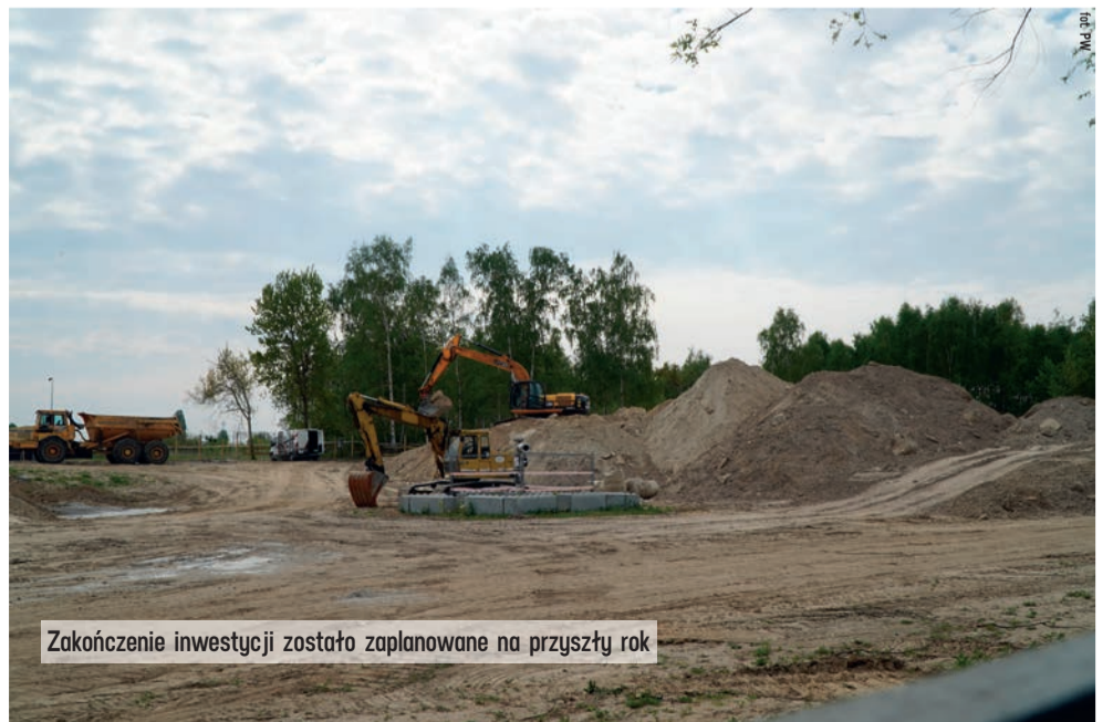
Zakończenie inwestycji zostało zaplanowane na przyszły rok