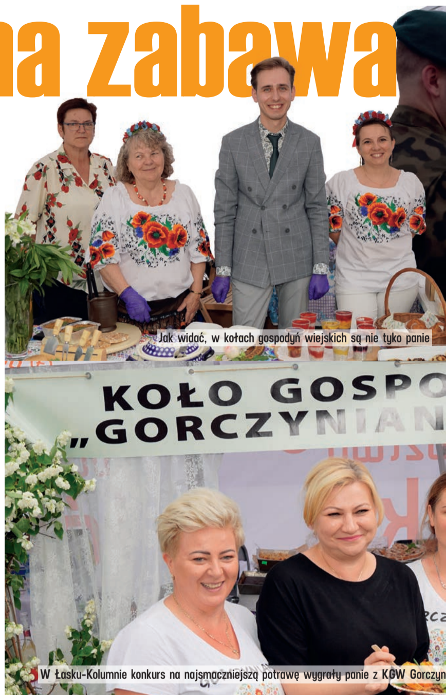
Jak widać, w kołach gospodyń wiejskich są nie tylko panie

KOŁO GOSPODYNI WIEJSKICH „GORCZYŃNIANKI”