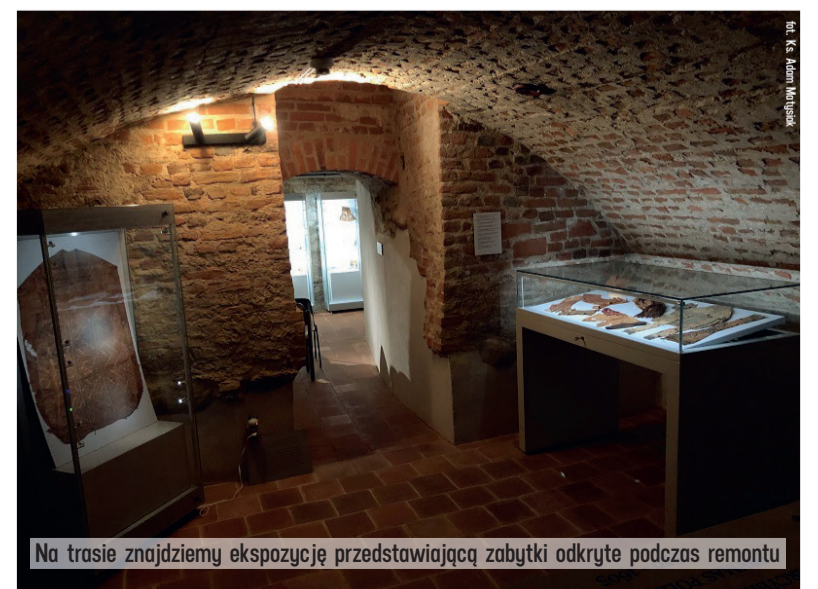
Na trasie znajdziemy ekspozycję przedstawiającą zabytki odkryte podczas remontu