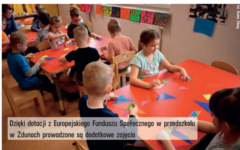
Dzięki dotacji z Europejskiego Funduszu Społecznego w przedszkolu w Zdunach prowadzone są dodatkowe zajęcia

- Jako samorząd województwa łódzkiego chętnie wspieramy projekty wzbogacające programy nauczania w niedużych miejscowościach. To niestety ważne, bo dzięki nim można dać dzieciom z terenów wiejskich większe szanse rozwoju i przy okazji wyrównać dysproporcje, jakie często występują w porównaniu z ofertą placówek w dużych miastach. To zaprezentuje w przyszłości, gdy dzisiejsi uczniowie trafią na rynek pracy.