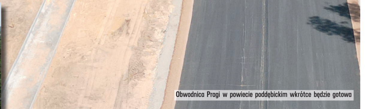
Obwodnica Pragi w powiecie poddębickim wkrótce będzie gotowa