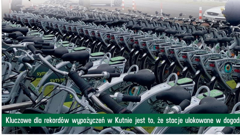
Kluczowe dla rekordów wypożyczeń w Kutnie jest to, że stacje ulokowane w dogodnych, łatwo dostępnych miejscach

Wojewódzki system roweru publicznego „Rowerowe Łódzkie” funkcjonuje od 2018 roku. Stacje z jednoślada znajdują się w dziesięciu miastach. Oprócz Kutna, Łowicza i Łodzi, rower można wypożyczyć również w Koluśkach, Łasku, Pabianicach, Sieradzu, Skierniewicach, Zduńskiej Woli i Zgierzu.