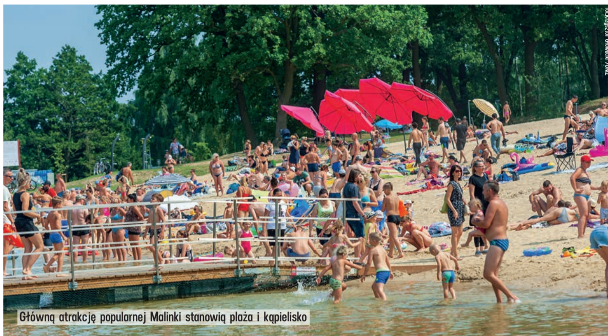
Główną atrakcją popularnej Malinki stanowią plaża i kąpielisko

- Miejski Ośrodek Sportu i Rekreacji w Zgierzu to teraz dumą województwa łódzkiego. Wszystkim zależy na zachęcaniu mieszkańców do aktywności fizycznej, a wiadomo, że im lepsza infrastruktura, tym więcej chętnych do uprawiania sportu. Po dalszej rozbudowie to będzie obiekt na miarę XXI wieku.