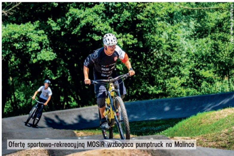
Ofertę sportowo-rekreacyjną MOSiR wzbogaca pumptruck na Malince