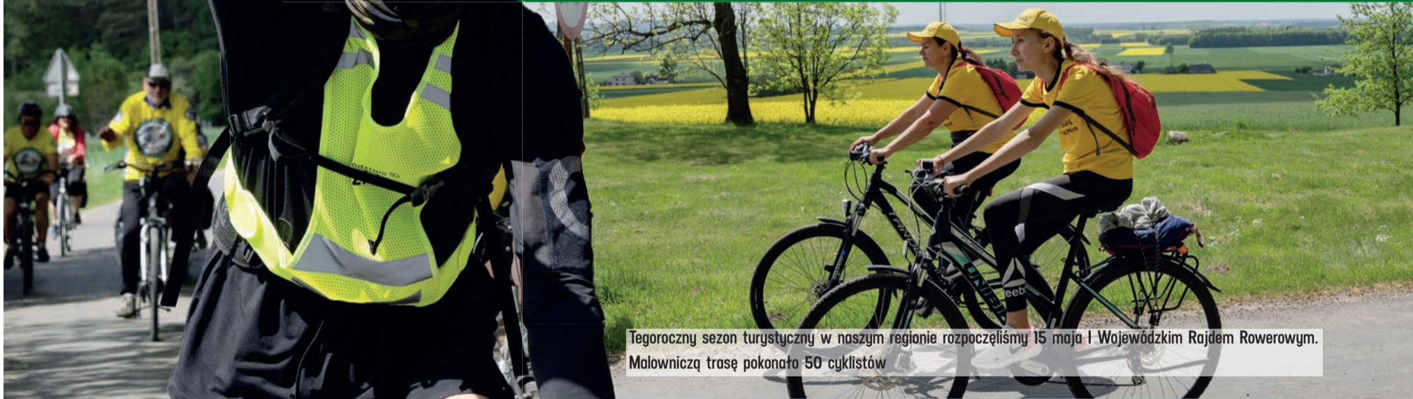
Tegoroczny sezon turystyczny w naszym regionie rozpoczęliśmy 15 maja I Wojewódzkim Rajdem Rowerowym. Malowniczą trasę pokonało 50 cyklistów