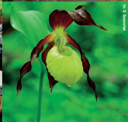
Przedborski Park Krajobrazowy. Obuwik