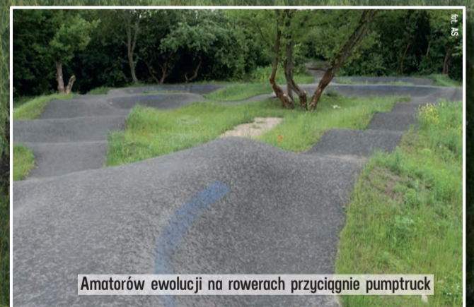
Amatorów ewolucji na rowerach przyciągnie pumphuck