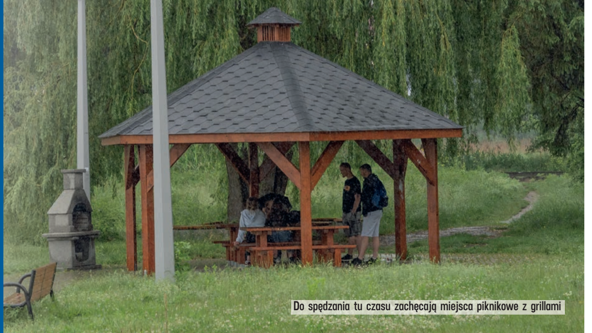
Do spędzania tu czasu zachęcają miejsca piknikowe z grillami

- Ta inwestycja ma niebagatelne znaczenie dla mieszkańców Łęczycy i dla przyjezdnych. Powstało świetnie miejsce wypoczynku, również aktywnego, na łonie natury, dzięki któremu będzie można jeszcze skuteczniej docenić walory przyrodnicze tego terenu. Nie bez znaczenia jest też fakt, że to kolejna cegiełka, która czyni okolice Łęczycy miejscem z potencjałem turystycznym. Doskonale uzupełniają wspaniałą zamek, grodzisko w Tumie, kolegiatę, skansen.