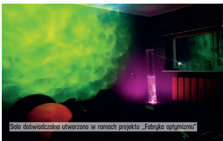
Sala doświadczalna utworzona w ramach projektu „Fabryka optymizmu”