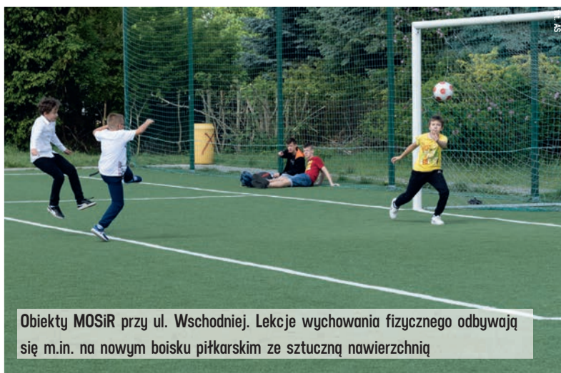
Obiekty MOSiR przy ul. Wschodniej. Lekcje wychowania fizycznego odbywają się m.in. na nowym boisku piłkarskim ze sztuczną nawierzchnią