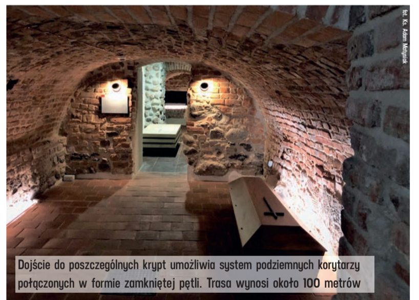
Dojście do poszczególnych krypt umożliwia system podziemnych korytarzy połączonych w formie zamkniętej pętli. Trasa wynosi około 100 metrów

Gośćmi jubileuszu diecezji byli marszałek Grzegorz Schreiber oraz wojewoda łódzki Tobiasz Bocheński. Częścią uroczystości było zwiedzanie odnowionych podziemi łowickiej bazyliki