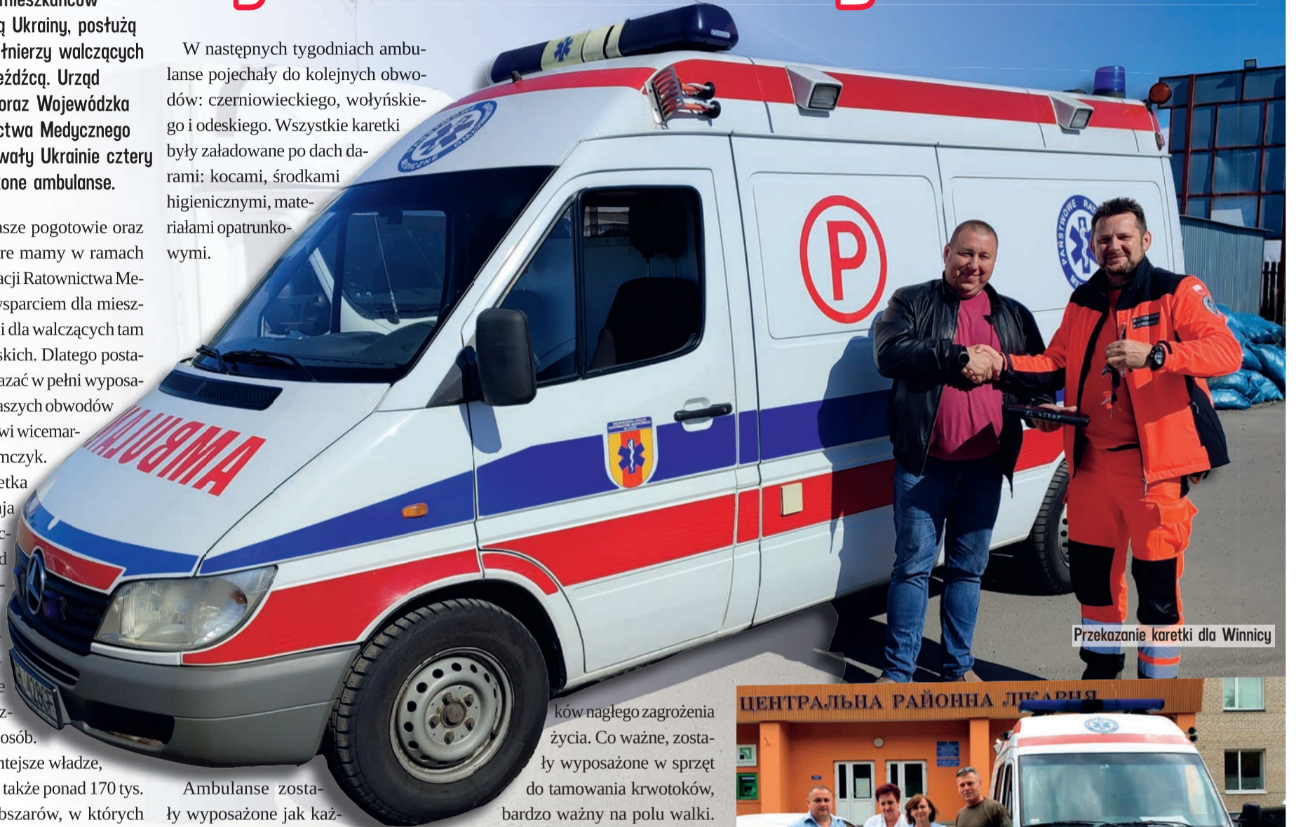
Przekazanie karetki dla Winnicy