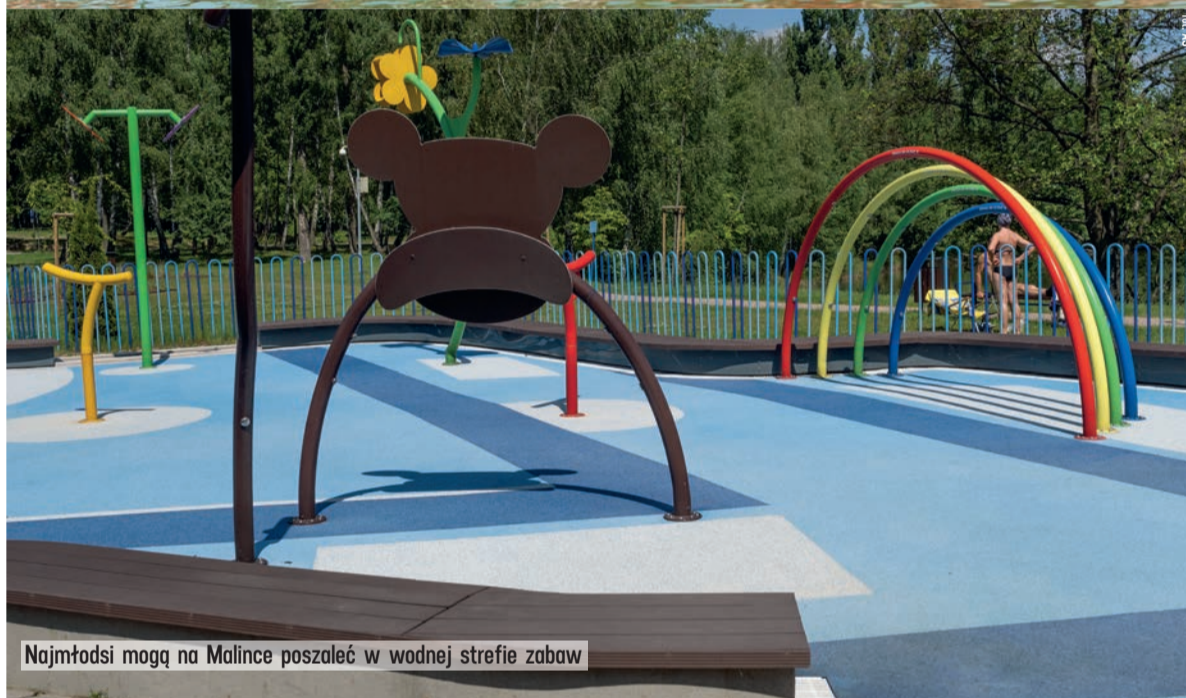
Najmłodsi mogą na Malince poszaleć w wodnej strefie zabaw