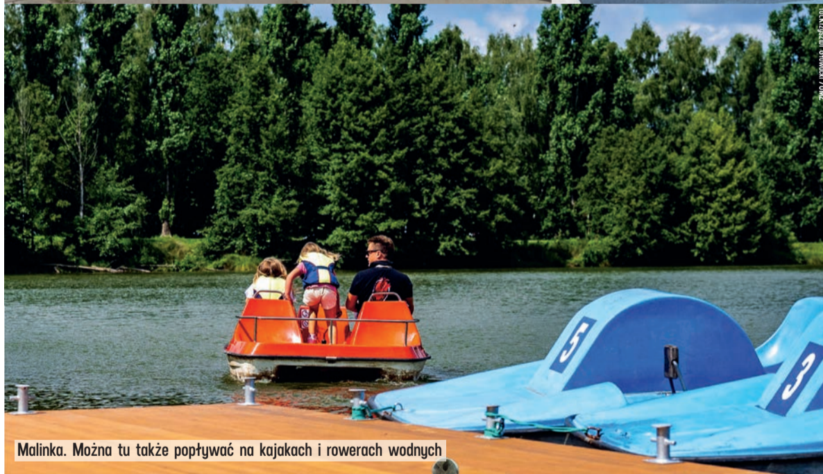
Malinka. Można tu także popływać na kajakach i rowerach wodnych