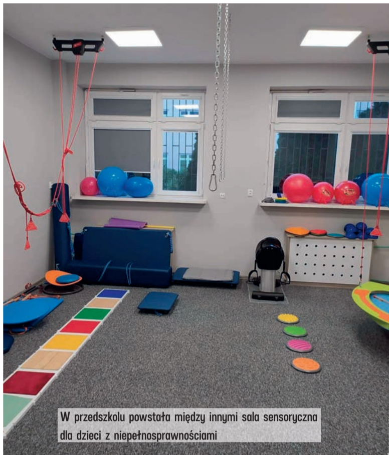
W przedszkolu powstała między innymi sala sensoryczna dla dzieci z niepełnosprawnościami