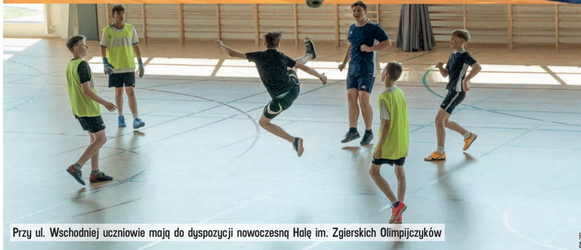
Przy ul. Wschodniej uczniowie mają do dyspozycji nowoczesną Halę im. Zgierskich Olimpijczyków