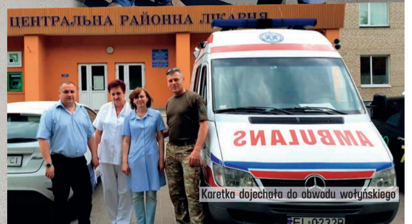
Karetka dojechała do obwodu wołyńskiego