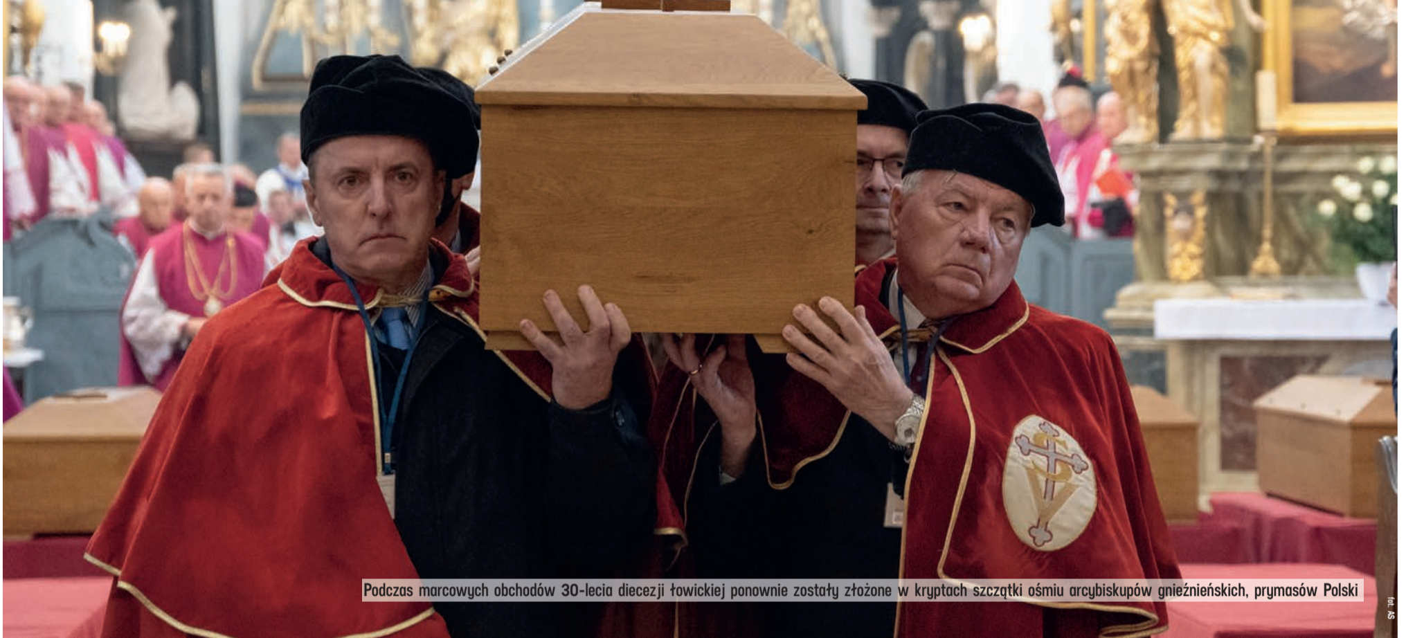
Podczas marcowych obchodów 30-lecia diecezji łowickiej ponownie zostały złożone w kryptach szczątki ośmiu arcybiskupów gnieźnieńskich, prymasów Polski

To jedno z miejsc na mapie naszego województwa, które trzeba koniecznie odwiedzić. W podziemiach bazyliki w Łowiczu można już zwiedzać groby arcybiskupów gnieźnieńskich. To ważna część historii Polski.