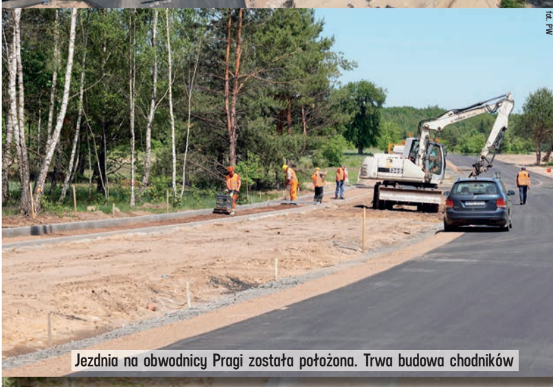
Jezdnia na obwodnicy Pragi została położona. Trwa budowa chodników