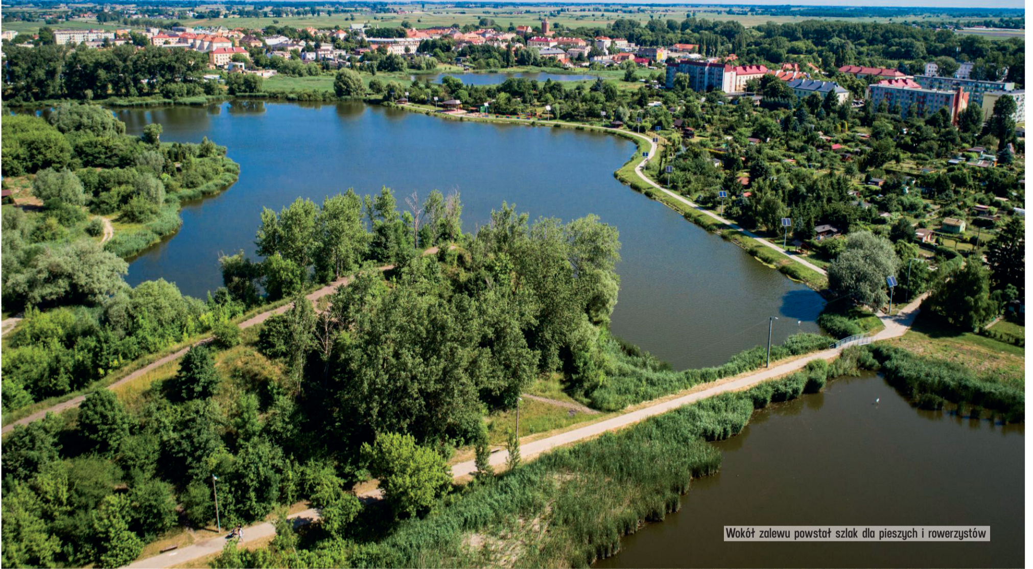
Wokół zalewu powstał szlak dla pieszych i rowerzystów

Okolice Łęczycy to rejon coraz bardziej atrakcyjny dla turystów. Niedawno w położonym nieopodal Łęczycy Tumie otwarte zostało zrewitalizowane średniowieczne grodzisko. Spragnionych wypoczynku mieszkańców naszego województwa mogą też skusić urządzone na nowo tereny nad zalewem w Łęczycy.