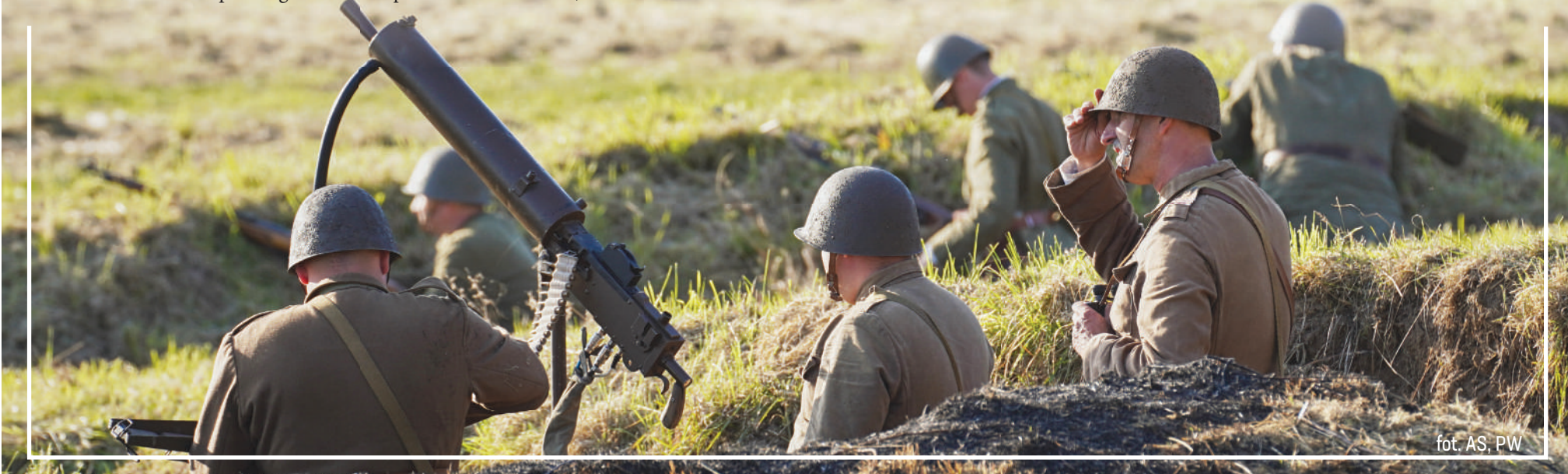
Beleń. Polscy żołnierze broniący umocnień, które były jednym ze strategicznych celów Niemców w tej bitwie. W Beleń zachował się oryginalny bunkier