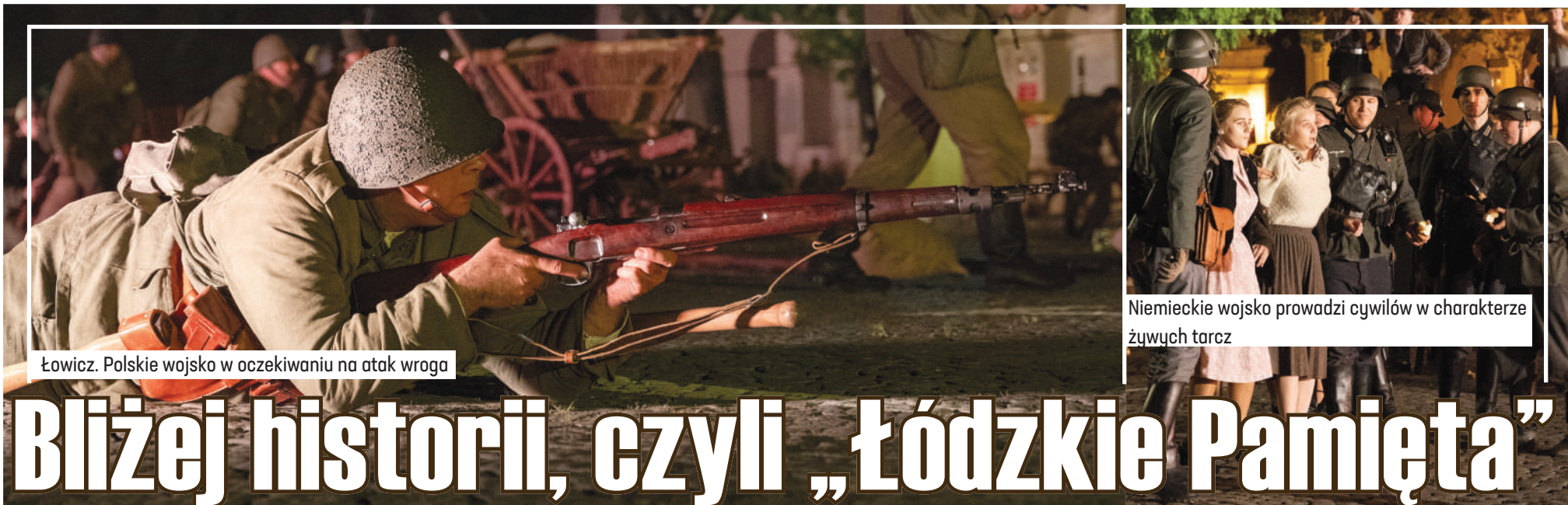
Łowicz. Polskie wojsko w oczekiwaniu na atak wroga