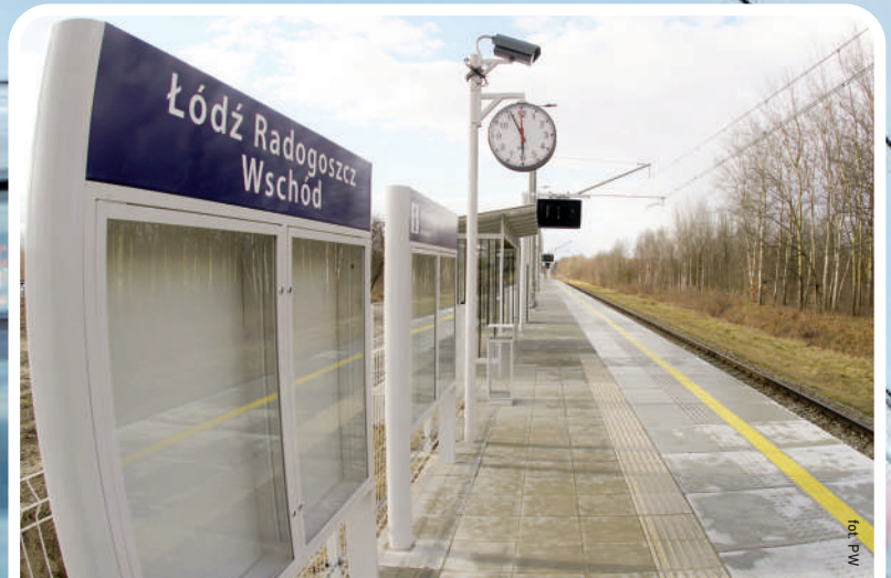
W 2021 roku łódzianie zyskali cztery nowe stacje kolejowe: Łódź Radogoszcz Wschód, Łódź Andrzejów Szosa, Łódź Retkinia i Łódź Warszawska

Rok 2021 był także przełomowy dla pasażerów podróżujących trasą z Łodzi do Ozorkowa. W grudniu zakończył się remont torów na linii Zgierz - Ozorków. Teraz kursuje na tej trasie więcej pociągów i jeżdżą one z prędkością do 120 km/godz., dwa razy szybciej niż przed remontem. Koszt robót sięgnął blisko pół miliarda złotych. 172 miliony pochodziły RPO WŁ. Przejazd z Łodzi do Ozorkowa skrócił się o 10 minut, co na półgodzinnej trasie ma wymierne znaczenie. Dzięki remontowi torowiska i dodatkowej mijance w Zgierzu na ten odcinek wróciły pociągi Intercity. Teraz kursuje tu 30 pociągów Łódzkiej Kolei Aglomeracyjnej, z czego sześć do i z Włocławka, oraz 12 pociągów Intercity. W planach jest budowa nowych przystanków