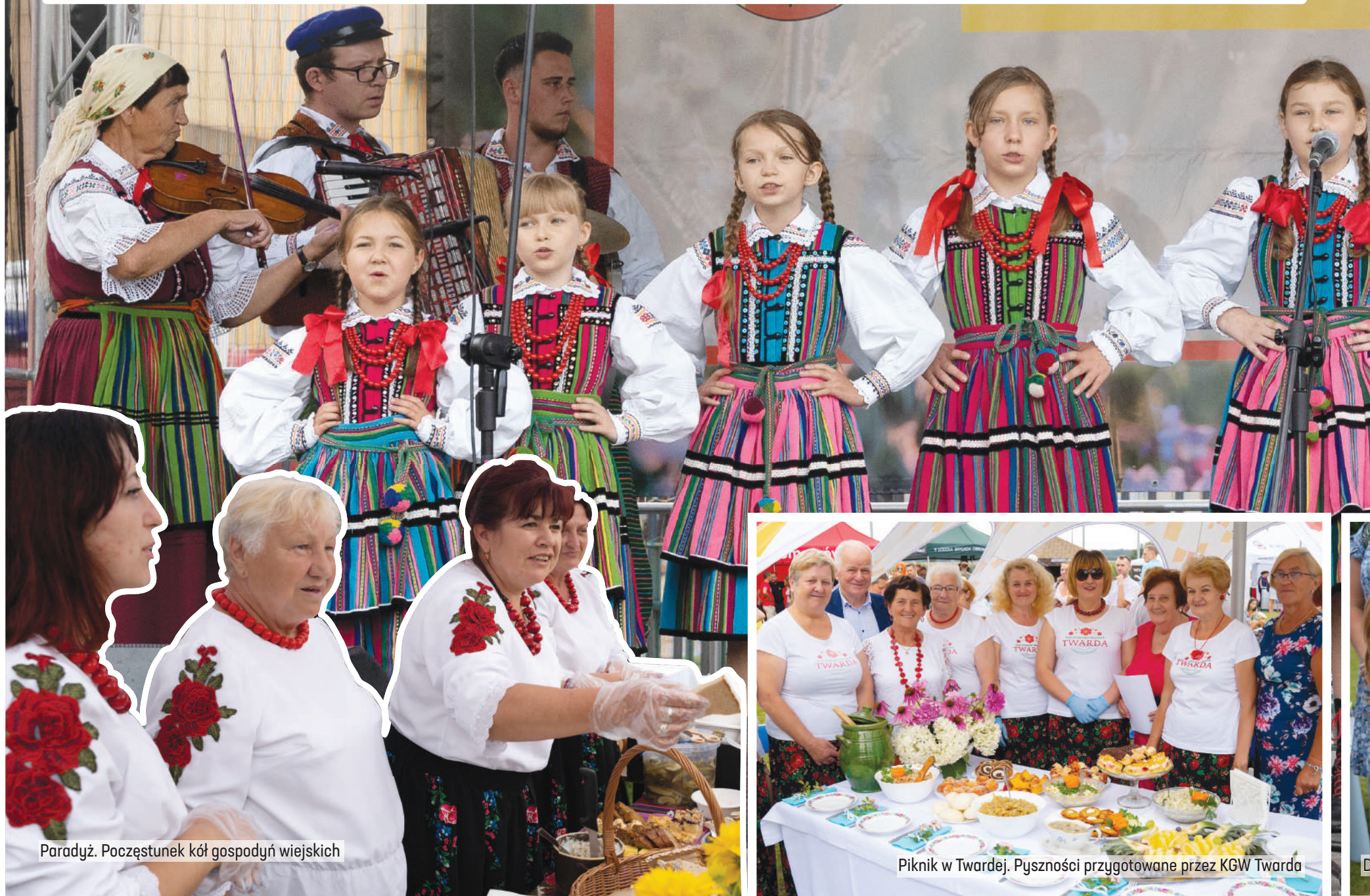
Paradyż. Poczęstunek kół gospodyń wiejskich