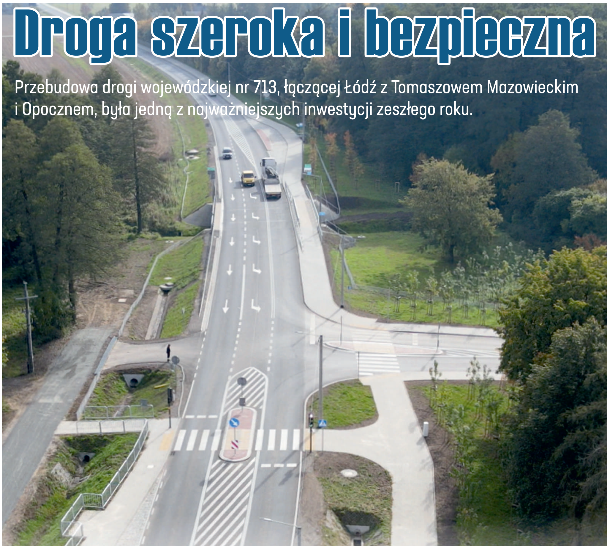
Tak z lotu ptaka wygląda fragment wyremontowanej drogi wojewódzkiej nr 713

Przebudowa drogi wojewódzkiej nr 713, łączącej Łódź z Tomaszowem Mazowieckim i Opoczmem, była jedną z najważniejszych inwestycji zeszłego roku.