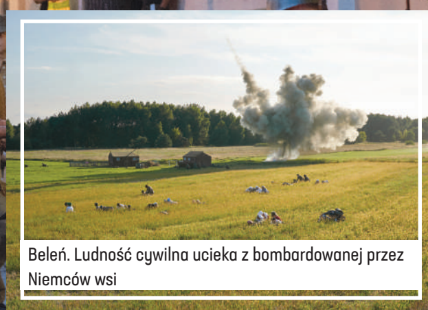
Beleń. Ludność cywilna ucieka z bombardowanej przez Niemców wsi

Ponad 200 rekonstruktorów – żołnierzy polskich i niemieckich oraz ludność cywilna, samolot, czołgi, ciężarówka, ciężkie karabiny maszynowe, armaty i moździerze. Około 10 tysięcy widzów doceniło rozmach i widowiskowość wojewódzkiej inscenizacji bitwy nad Wartą. Została ona przedstawiona na polach między Beleń i Strońskiem w gminie Zapolice pod Zduńską Wolą.