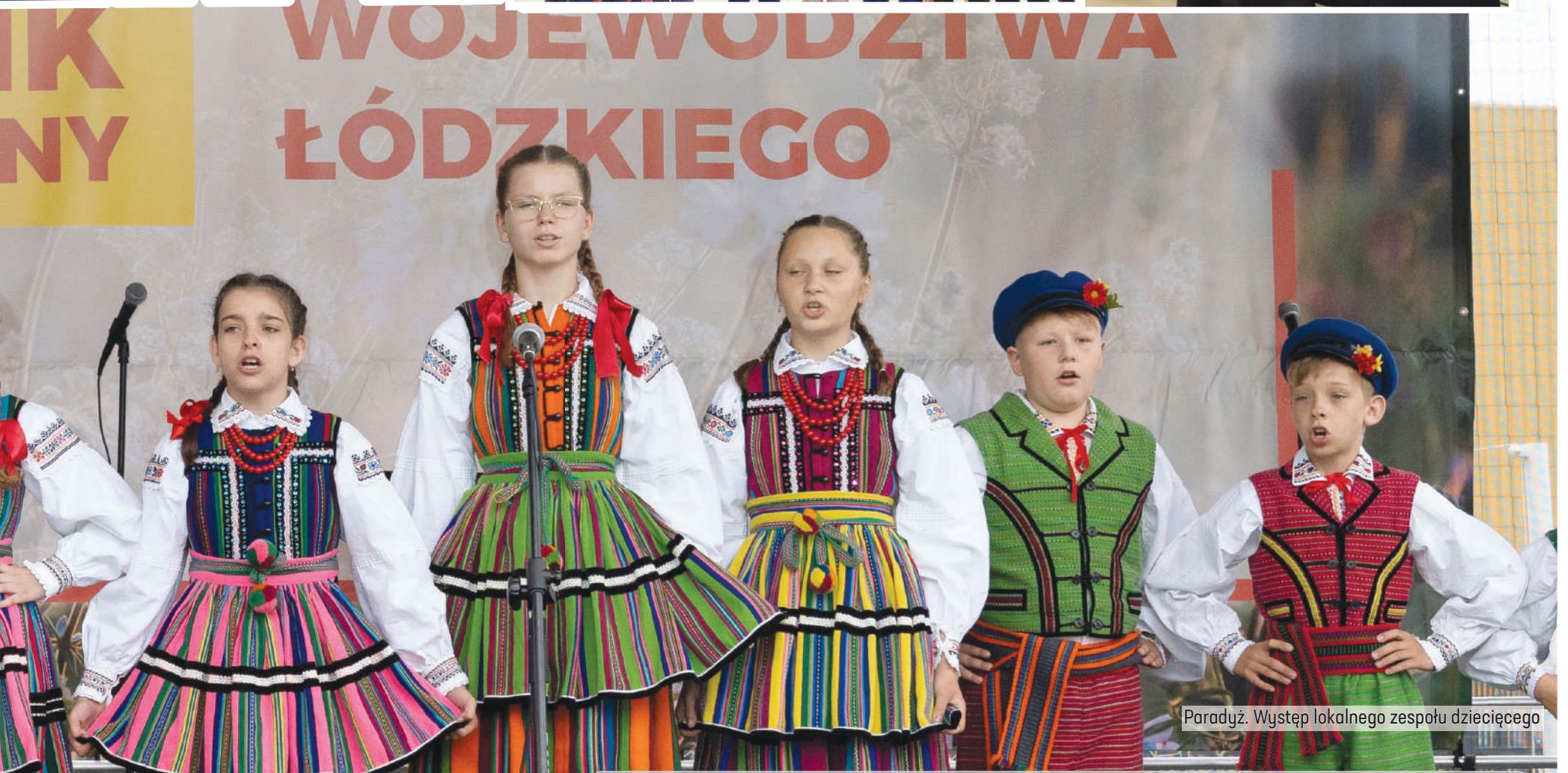
Paradyż. Występ lokalnego zespołu dziecięcego