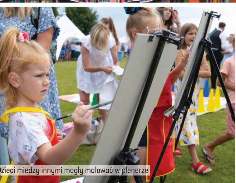
dzieci między innymi mogły malować w plenerze