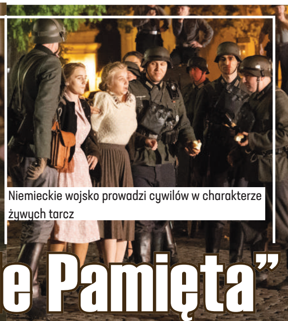
Niemieckie wojsko prowadzi cywilów w charakterze żywych tarcz