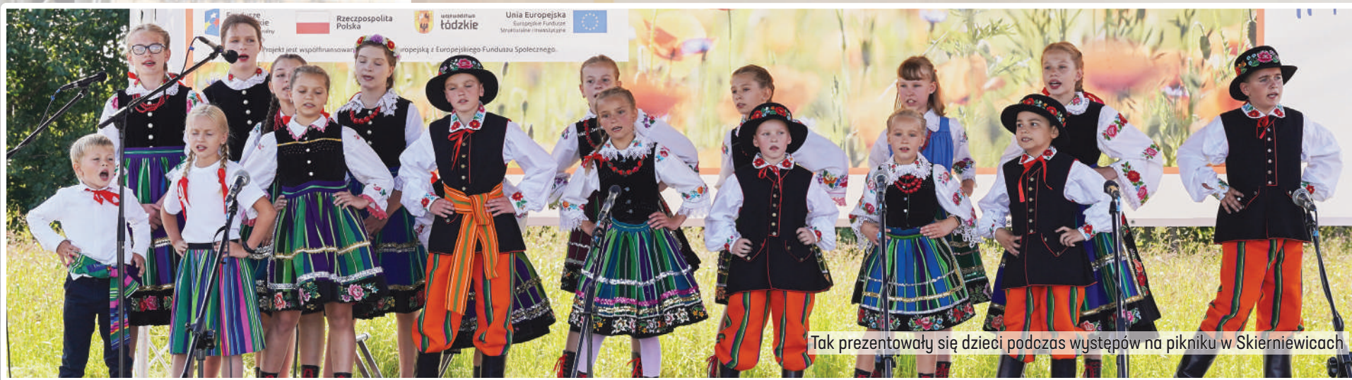
Tak prezentowały się dzieci podczas występów na pikniku w Skierniewicach

instytucji podległych samorządowi województwa przybliżyli m.in. aktualne i planowane konkursy unijne, realizowane programy wsparcia, możliwość pozyskania grantów. Podczas spotkań wręczane były symboliczne czekiki z dofinansowaniami na remonty lokalnych zabytków i inwestycje w infrastrukturę sportową.