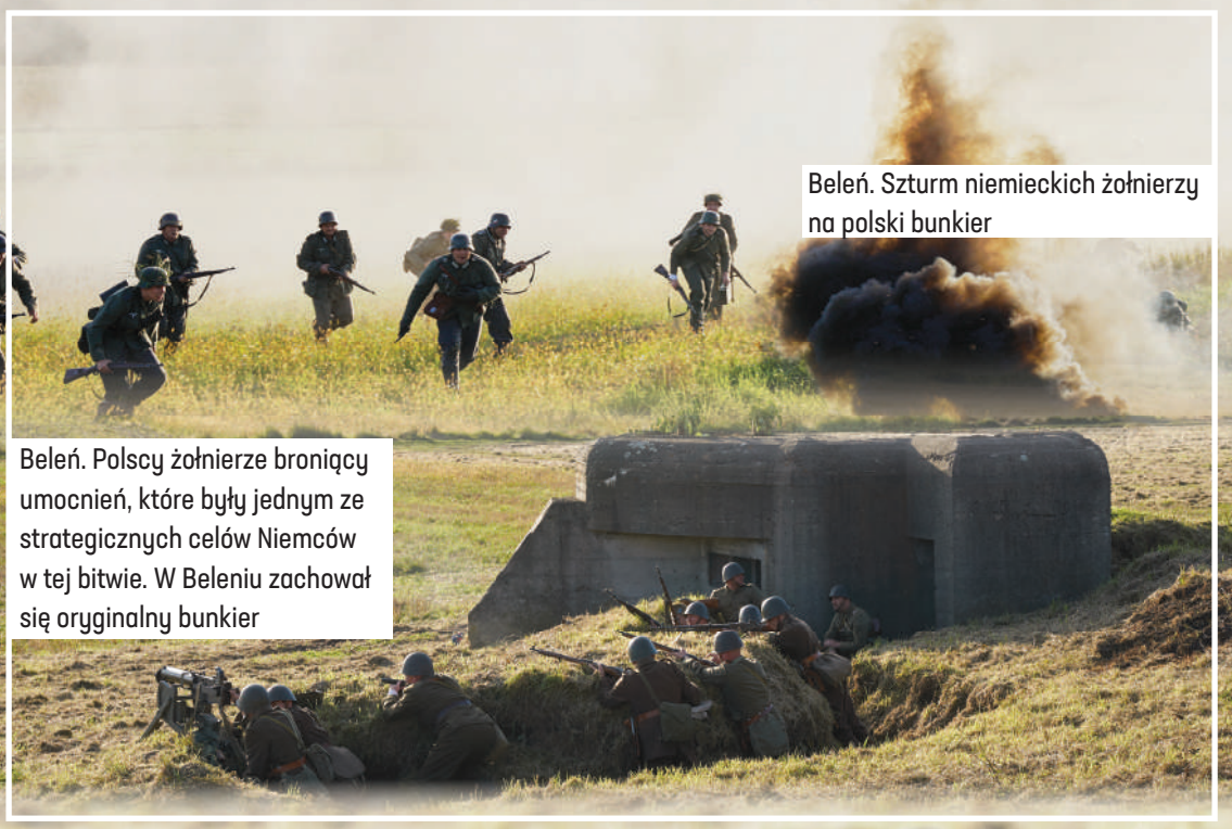
Beleń. Szturm niemieckich żołnierzy na polski bunkier

W Łowiczu dzięki projektowi „Łódzkie Pamięta” mieszkańcy regionu przenieśli się do 9 września 1939, kiedy to toczyła się bitwa o miasto. W inscenizacji wzięło udział 140 rekonstruktorów z 13 grup rekonstrukcyjnych oraz kilkudziesięciu uczniów łowickich szkół grających ludność cywilną. Widzowie mieli okazję zobaczyć kilkanaście pojazdów wojskowych z epoki oraz imponujące, ale też budzące trwogę pokazy pirotechniczne. Inscenizacja została podzielona na 4 epizody: przygotowanie do wojny, pierwsze zajęcie miasta przez Niemców i egzekucje ludności cywilnej, szturm Polaków na Łowicz i odbicie miasta, ponowne zajęcie Łowicza przez Niemców. AA, MAP