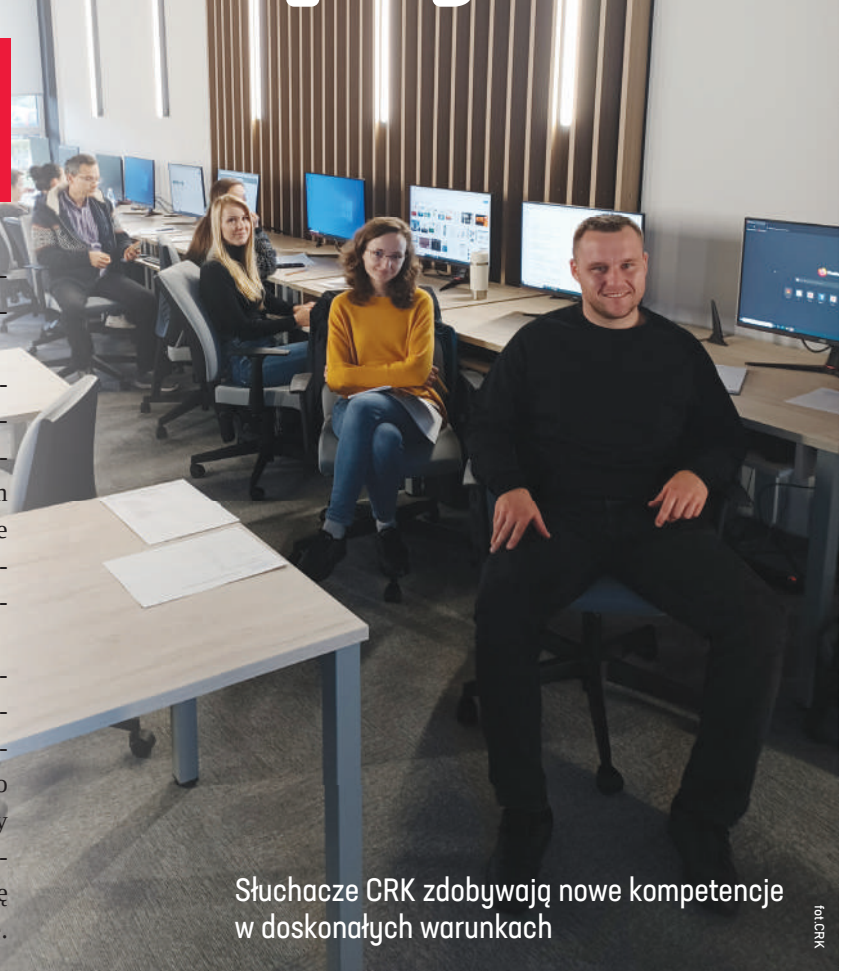
Słuchacze CRK zdobywają nowe kompetencje w doskonałych warunkach