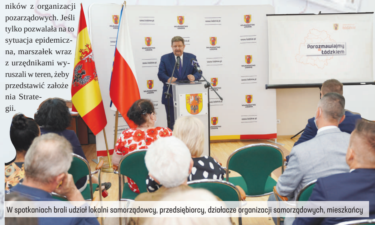
W spotkaniach brali udział lokalni samorządowcy, przedsiębiorcy, działacze organizacji samorządowych, mieszkańcy

korzystanie potencjału badawczego i stawianie na rozwój innowacyjności. Dla małych i średnich przedsiębiorstw przewidziano szeroki pakiet działań, zwiększających konkurencyjność. Istotny nacisk został położony na współpracę przedsiębiorstw i świata nauki. Zaplanowane jest również zwiększenie kompetencji pracowników dzięki wykorzystaniu potencjału uczelni oraz upowszechnieniu kształcenia zawodowego.