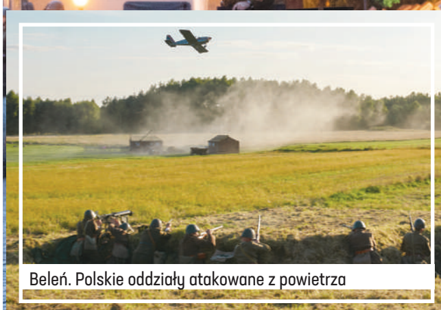
Beleń. Polskie oddziały atakowane z powietrza

Ten pomysł na kultywowanie ważnych wydarzeń z historii naszego regionu przypadł do gustu mieszkańcom województwa. Blisko 20 tysięcy osób obejrzało pełne rozmachu rekonstrukcje bitew nad Wartą i Bzurą. Urząd Marszałkowski zorganizował je w ramach projektu „Łódzkie Pamięta”.