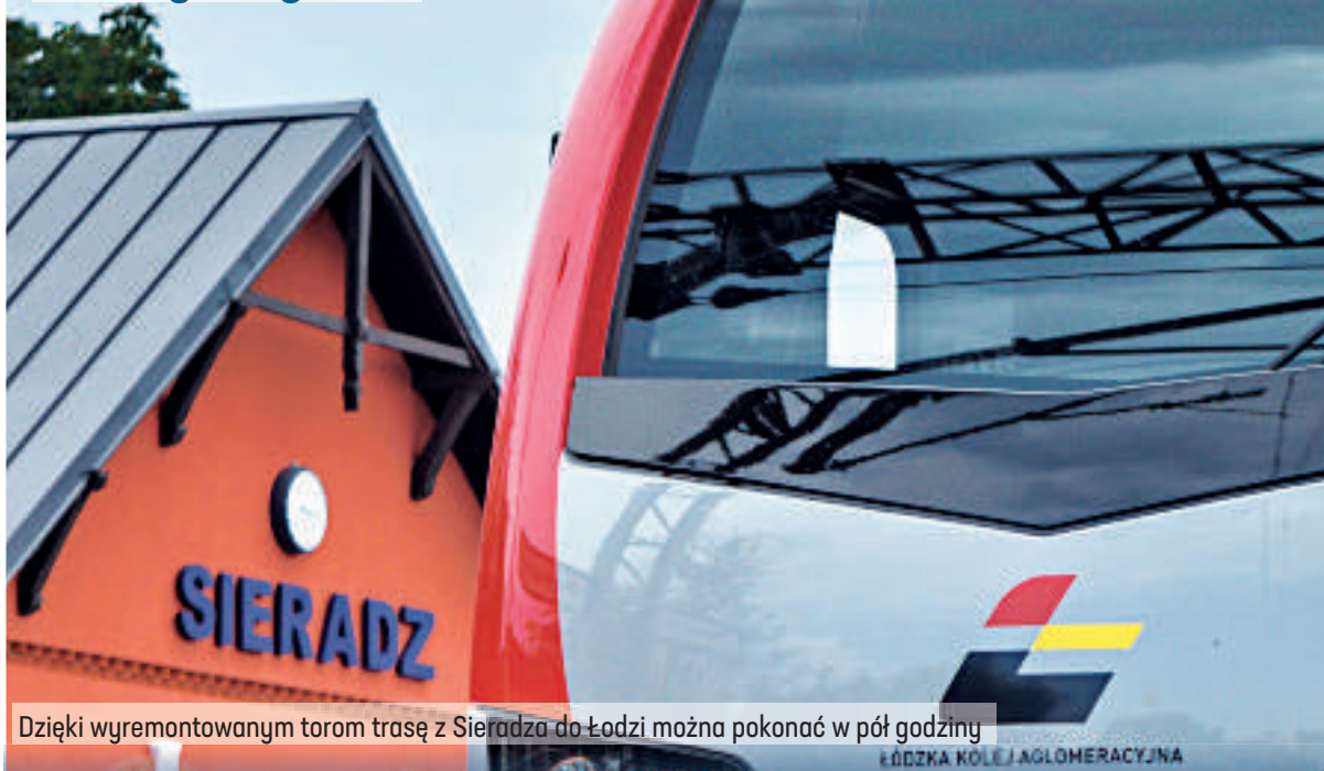
Dzięki wyremontowanym torom trasę z Sieradza do Łodzi można pokonać w pół godziny

Nowe połączenia, modernizacja torów kolejowych, budowa przystanków, modernizacja dworców. Rok 2021 był kolejnym, w którym zniknęło wiele białych plam na komunikacyjnej mapie naszego regionu.