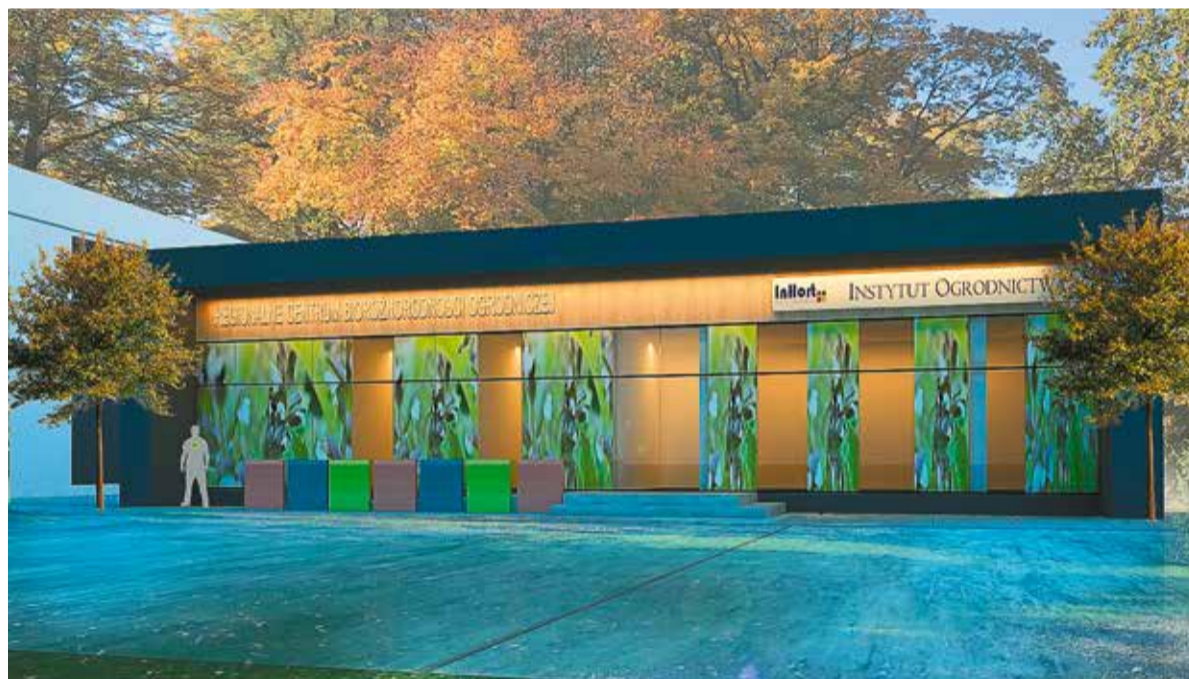
Tak będzie wyglądał po zakończeniu inwestycji