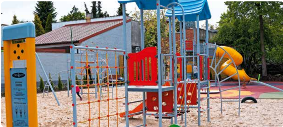
Plac zabaw w gminie Burzenin zbudowany z dotacją z poprzedniej edycji programu „Infrastruktura sportowa PLUS”

75 samorządów z naszego województwa otrzyma dotacje na budowę lub modernizację boisk, siłowni, placów zabaw. To pieniądze z programu Urzędu Marszałkowskiego „Infrastruktura sportowa PLUS”.