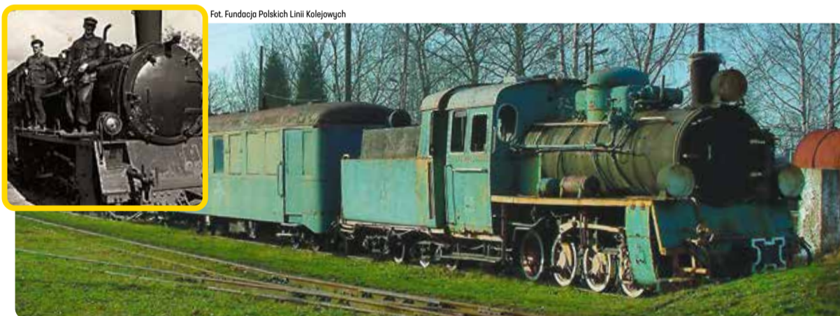
W ostatnią podróż z Rogowa przez Rawę Mazowiecką do Białej Rawskiej parowóz wyruszył w 1976 roku.