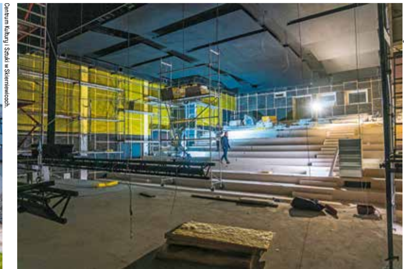
Nowa sala koncertowa