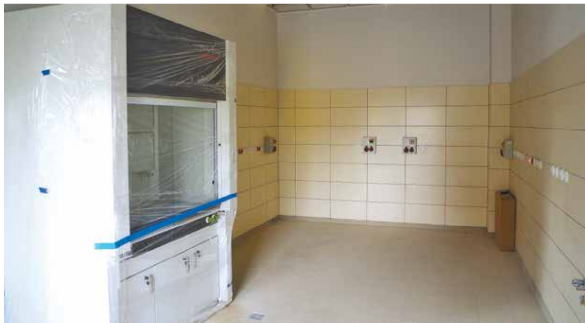
Powstające wnętrza będą nowoczesne i funkcjonalne

peraturze minus 20 stopni Celsjusza. Docelowo Regionalne Centrum Bioróżnorodności Ogrodniczej pozwoli na zgromadzenie, zachowanie i odtworzenie około 30 tysięcy genotypów roślin ogrodniczych. Nasiona będą przechowywane w zamkniętych próżniowo szklanych słoiczkach, z umieszczonym wewnątrz żelom ze wskaźnikiem wilgotności. W takich warunkach nasiona mogą być bezpiecznie przechowywane nawet do 150 lat.