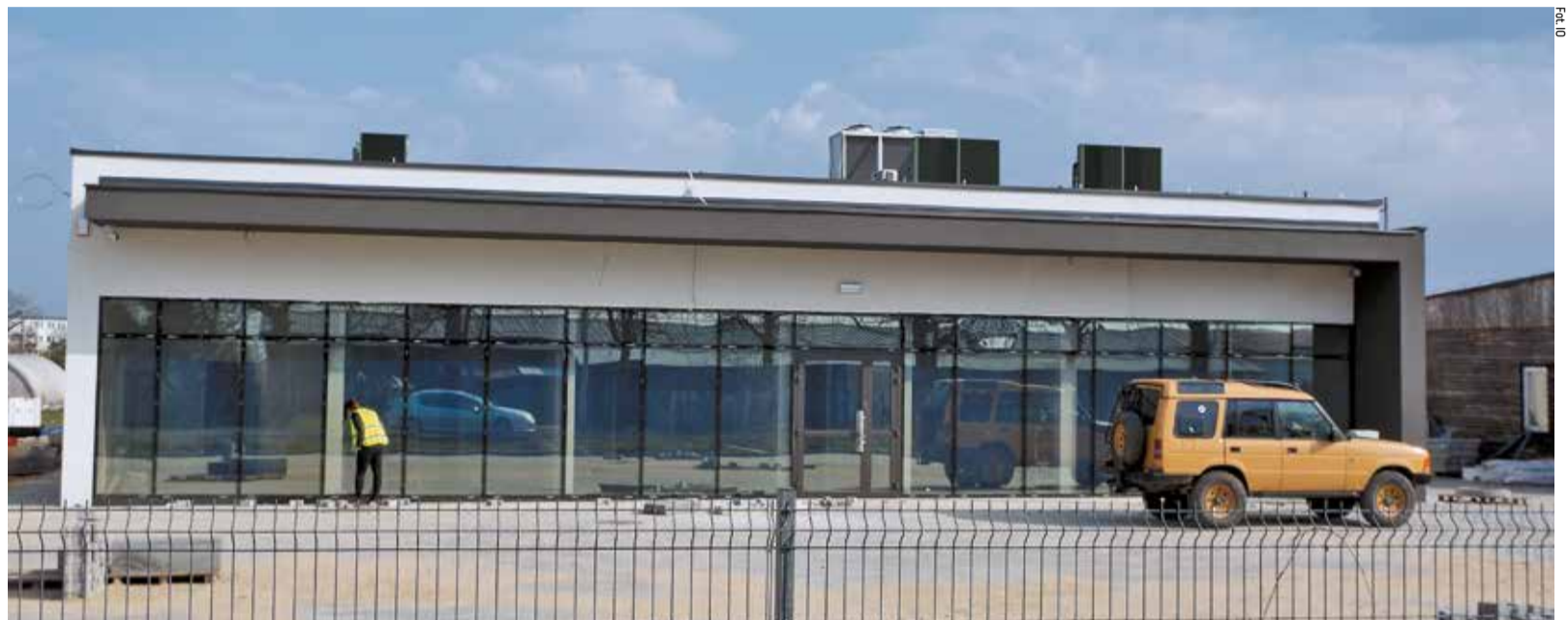
Tak już wygląda budynek banku nasion

Nasiona przechowywane będą w dwóch komorach mroźni, w tem-