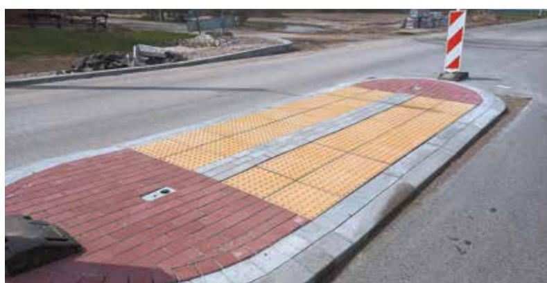
...powstaną także chodniki oraz bezpieczne przejścia dla pieszych...

Droga wojewódzka 713 należy do najważniejszych tras w tej części województwa łódzkiego, pozwala mieszkańcom powiatów tomaszowskiego i opoczyńskiego dostać się do stolicy regionu. Na co dzień korzystają z niej także pojazdy obsługujące wiele zakładów produkcyjnych, działających na terenie obu tych powiatów. Nie waham się stwierdzić, że to jedna z najbardziej obłożonych ruchem dróg wojewódzkich w Łódzkiem. Dlatego bardzo się cieszę, że samorząd województwa łódzkiego zdecydował się na inwestycję, która poprawi komfort jazdy i bezpieczeństwo kierowców oraz niechronionych uczestników ruchu, korzystających z tej trasy. Wszyscy zdajemy sobie sprawę, że prace związane z rozbudową wiązą się z uciążliwościami dla kierowców. Ale przy tej skali robót utrudnień uniknąć się nie da i jako użytkownicy tej drogi po prostu musimy uzbroić się w cierpliwość. Za to niebawem będziemy mogli korzystać z nowej drogi, która latami będzie służyć mieszkańcom. Jako radny Sejmiku będę zabiegał, żeby Zarząd Województwa Łódzkiego zabezpieczył środki na rozbudowę drogi wojewódzkiej 713 na kolejnych odcinkach w kierunku Opoczna.