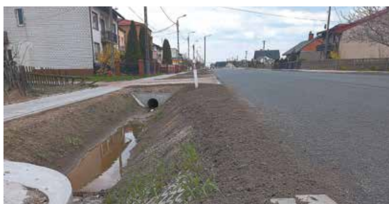
...wybudowana zostanie kanalizacja deszczowa, pojawią się zjazdy do posesji