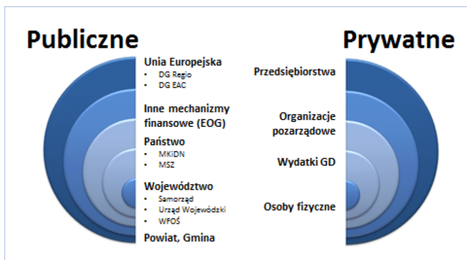
Wykres 2. Architektura finansowania polityki kulturalnej

Rekomendowane działania wskazane do realizacji w latach 2014-2020 mogą być finansowane z wielu różnych źródeł: zarówno środków publicznych (UE, środki krajowe, jednostek samorządu terytorialnego: wojewódzkie, powiatowe, gminne) jak i prywatnych (przedsiębiorstwa, organizacje pozarządowe, osoby fizyczne). W tym rozdziale przedstawione zostaną głównie możliwości finansowania Programu ze środków publicznych 72 .