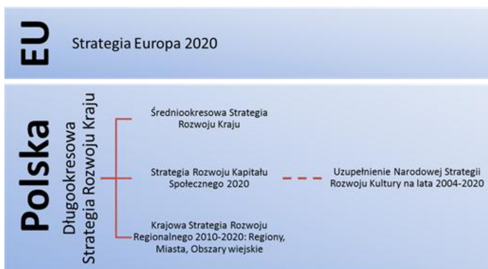
Wykres 1. Dokumenty strategiczne do których odwołuje się Program rozwoju kultury.

Poniżej przedstawiono dokumenty strategiczne, do których w sposób bezpośredni odwołuje się niniejszy Program oraz wskazano miejsce Programu w tym układzie.