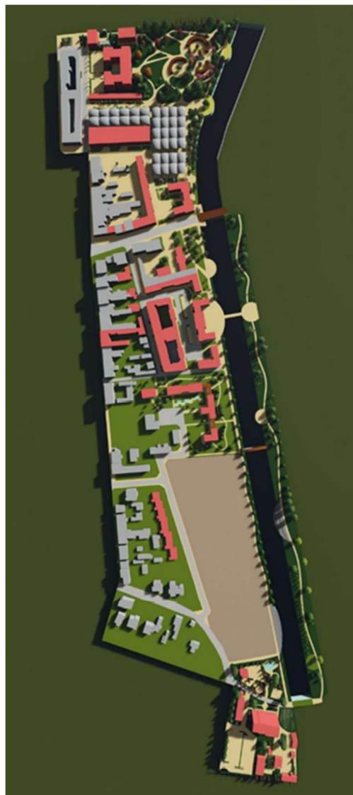
Fot. 1 Wizualizacja przekształceń bulwarów poddębickich - rzut z góry. Obiekty objęte przekształceniami zostały oznaczone kolorem czerwonym.

życiu, przez co należy rozumieć wykorzystanie istniejących zasobów, opieranie gospodarki o własne produkty, uwydatnianie wartości historyczno-kulturowych oraz środowiska naturalnego. Członkostwo może ułatwić miastu wiele pozytywnych zmian i nadać nowy kierunek rozwoju. Uwaga autora koncentruje się na terenach nadrzecznych i kształtowaniu bulwarów miejskich jako obszarów ukierunkowanych na potrzeby mieszkańców, turystów i kuracjuszy. Praca stanowi próbę odpowiedzi na pytanie o sposoby kształtowania atrakcyjnej, bezpiecznej, wielofunkcyjnej przestrzeni