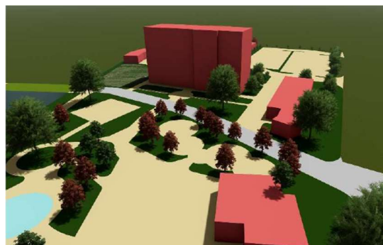
Fot. 3 Wizualizacja przekształcenia terenu młyna na zespół obiektów hotelarsko-gastronomicznych wraz ze skansenem dotyczącym tematyki rzemieślniczej.

Aktywizacja i promocja małych miast regionu łódzkiego to bardzo ważny temat, który jest kluczem do promocji województwa łódzkiego i rozwojem jego potencjału. Praca stanowi autorską koncepcję przekształceń urbanistycznych w powiązaniu z potrzebami mieszkańców Poddębic . Autorka skoncentrowała swoje działania na poprawnym zagospodarowaniu obszaru obu brzegów rzeki Ner . Dziedzictwo kulturowe i tożsamość miejsca to kolejny uniwersalny cel jaki zawarto podczas wprowadzania rozwiązań koncepcyjnych. Projekt został przeprowadzony o szereg szczegółowych analiz pozwalających na dokładne zbadanie charakteru miasta, rzeki i jej bulwarów . Bogactwo analiz i dobrze przeanalizowane zagadnienie wprowadzenia ruchu Cittaslow na terenie Poddębic może być źródłem inspiracji w procesie aktywizacji poddębickich bulwarów. Takie działania mogą bezpośrednio przyczyniać się do podnoszenia jakości regionów łódzkich i ich turystycznego działu w powiązaniu z promocją dziedzictwa narodowego . Szczególną uwagę należy kierować do władz miasta Poddębice, które w ramach swoich działań mogą się zainspirować przedstawioną pracą i rozważyć członkostwo w ruchu miast Cittaslow.