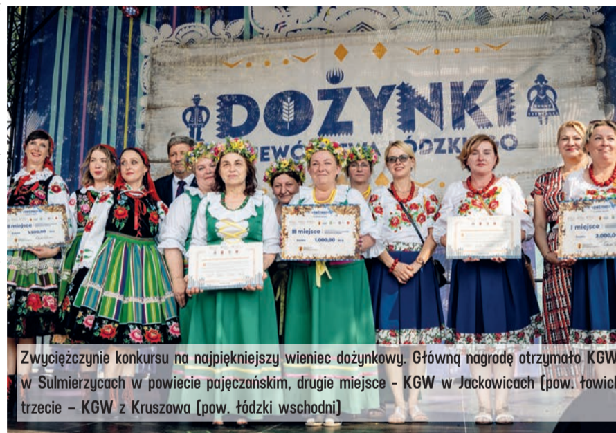
Zwycięzcy konkursu na najpiękniejszy wieniec dożynkowy. Główną nagrodę otrzymała KGW w Sulmierzycach w powiecie pączęzańskim, drugie miejsce - KGW w Jackowicach (pow. łowicki), trzecie - KGW z Kruszowa (pow. łódzki wschodni)