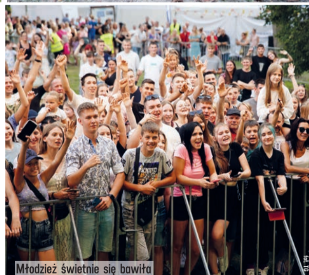
Młodzież świetnie się bawiła