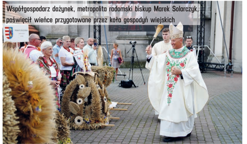
Współgospodarz dożynek, metropolita radomski biskup Marek Solarczyk, poświęcił wieniec przygotowane przez koła gospodyń wiejskich