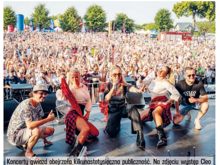
Koncert gwiazd obejrzała kilkunastotysięczna publiczność. Na zdjęciu występ Cleo