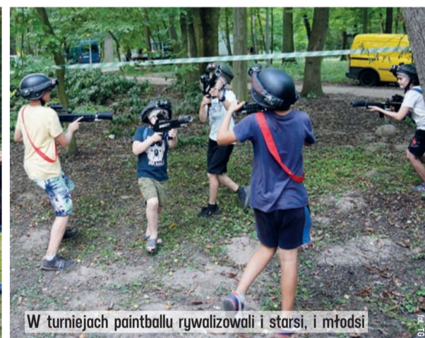
W turniejach paintballu rywalizowali i starsi, i młodszy