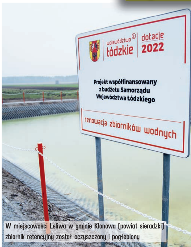
W miejscowości Leliwa w gminie Klonowa (powiat sieradzki) zbiornik retencyjny został oczyszczony i pogłębiony

przeznaczył w tym roku Samorząd Województwa łódzkiego na program wsparcia remontów zbiorników małej retencji. To pieniądze dla lokalnych samorządów