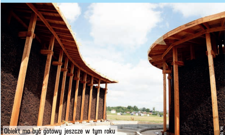
Obiekt ma być gotowy jeszcze w tym roku

- Gdyby nie wsparcie unijne i rządowe realizacja tego pomysłu nie byłaby możliwa - powiedział Józef Kaczmarek. MM