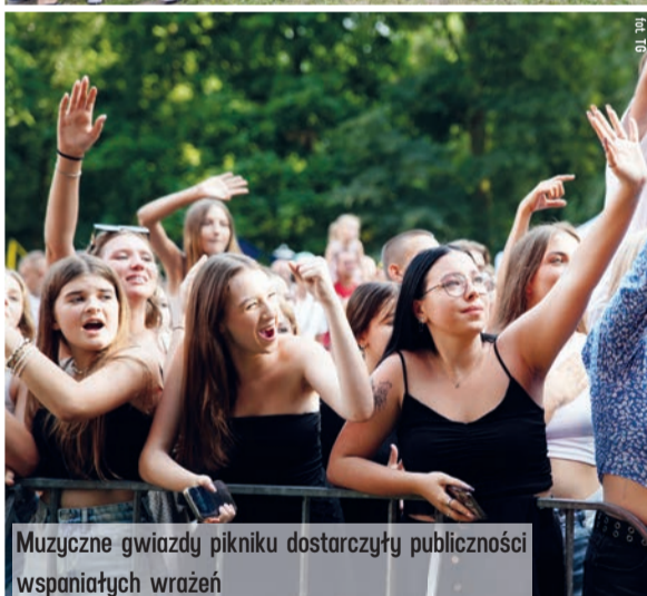
Muzyczne gwiazdy pikniku dostarczyły publiczności wspaniałych wrażeń