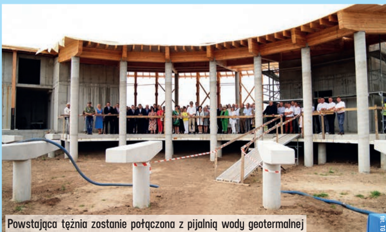
Powstająca tężnia zostanie połączona z pialnią wody geotermalnej