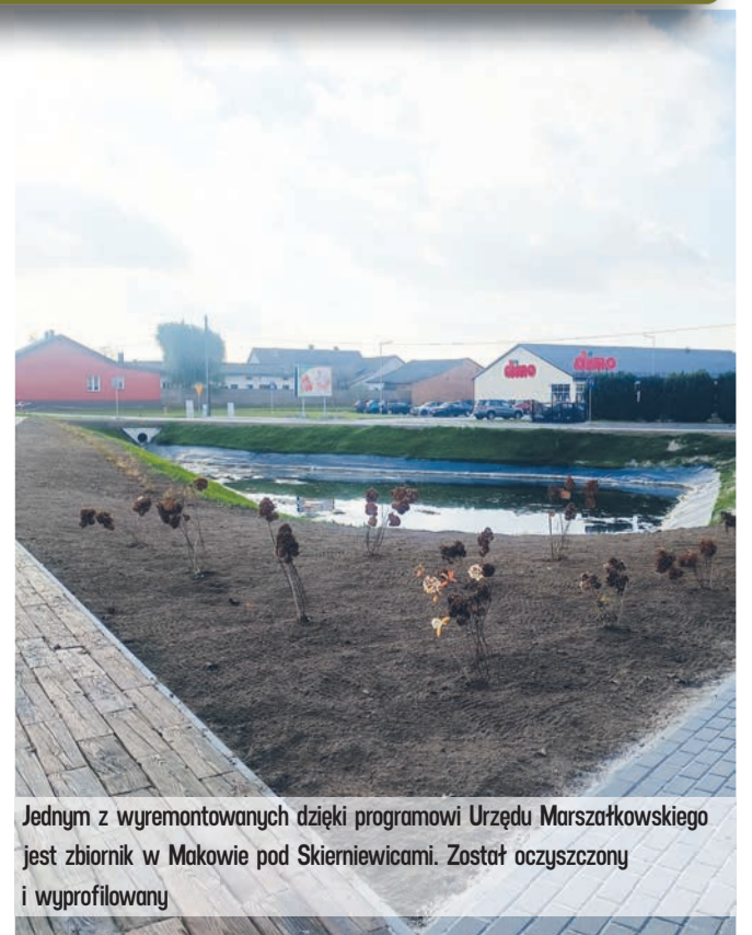
Jednym z wyremontowanych dzięki programowi Urzędu Marszałkowskiego jest zbiornik w Makowie pod Skierniewicami. Został oczyszczony i wyprofilowany

- Wyremontowany dzięki wsparciu Urzędu Marszałkowskiego zbiornik już służy mieszkańcom. To ważna inwestycja, na którą czekaliśmy kilkanaście lat, ale też impuls do działania, bo przygotowujemy wnioski o dofinansowanie remontów dwóch kolejnych zbiorników małej retencji