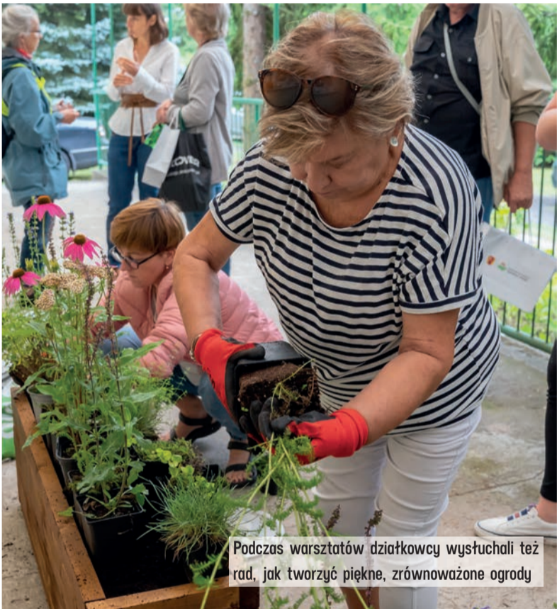
Podczas warsztatów działkowcy wysłuchali też rad, jak tworzyć piękne, zrównoważone ogrody