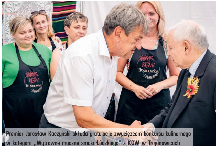
Premier Jarosław Kaczyński składa gratulacje zwycięzcom konkursu kulinarnego w kategorii „Wytrawne mączne smaki Łódzkiego” z KGW w Trojanowicach