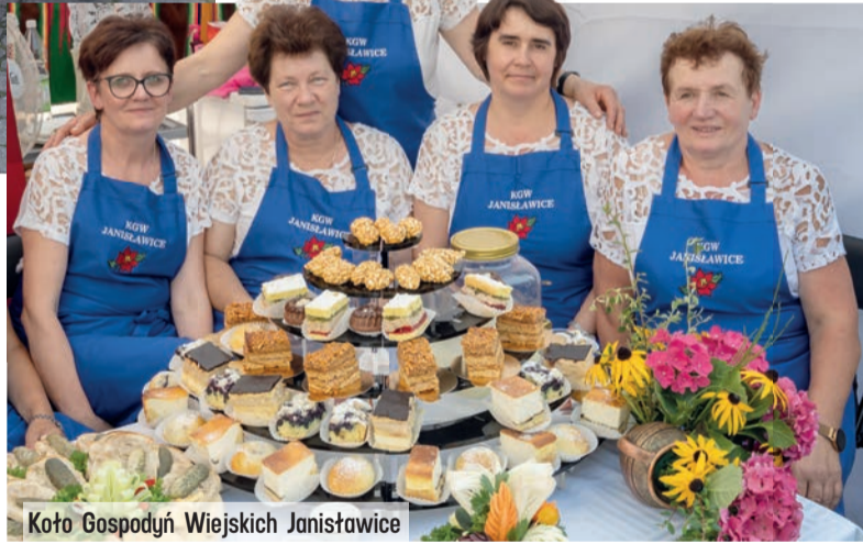
Koło Gospodyń Wiejskich Janiszewice