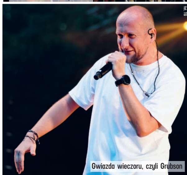
Gwiazda wieczoru, czyli Grubson