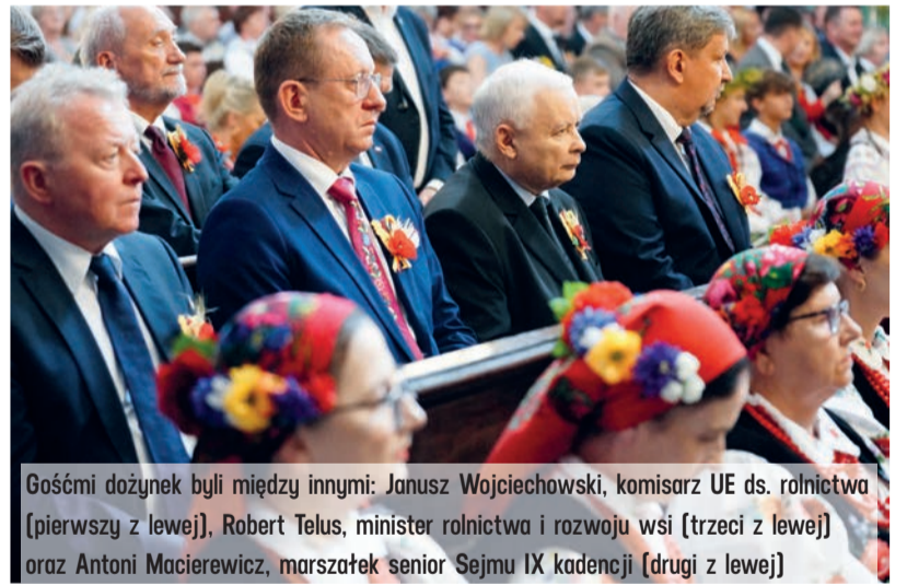
Gośćmi dożynek byli między innymi: Janusz Wojciechowski, komisarz UE ds. rolnictwa (pierwszy z lewej), Robert Telus, minister rolnictwa i rozwoju wsi (trzeci z lewej) oraz Antoni Macierewicz, marszałek senior Sejmu IX kadencji (drugi z lewej)