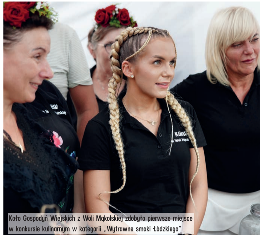
Koło Gospodyń Wiejskich z Woli Mąkolskiej zdobyło pierwsze miejsce w konkursie kulinarnym w kategorii „Wytrawne smaki Łódzkiego”