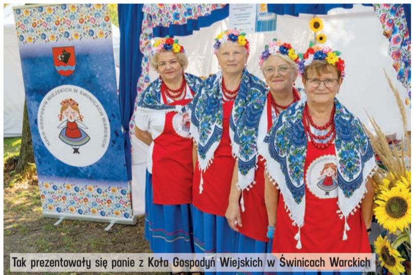
Tak prezentowały się panie z Koła Gospodyń Wiejskich w Świnicach Warckich