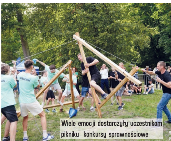
Wiele emocji dostarczyły uczestnikom pikniku konkursy sprawnościowe