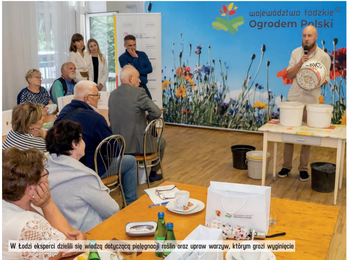
W Łodzi eksperci dzielili się wiedzą dotyczącą pielęgnacji roślin oraz upraw warzyw, którym grozi wyginięcie

W tym roku na wsparcie dla działkowców Samorząd Województwa Łódzkiego przeznaczył milion złotych. O pieniądze mogły się starać stowarzyszenia prowadzące rodzinne ogrody działkowe w naszym regionie. Wpłynęły pięćdziesiąt dwa wnioski. Dotację otrzymało 36 stowarzyszeń. Maksymalna kwota dofinansowania wynosiła 30 tys. zł. Pieniądze można przeznaczyć na projekty zmierzające do poprawy jakości gruntów, między innymi na zakup nasion i sadzonek drzew, krzewów oraz kwiatów, wy-