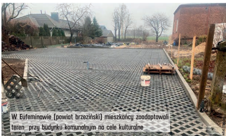
W Eufeminowie (powiat brzeziński) mieszkańcy zaadaptowali teren przy budynku komunalnym na cele kulturalne

10 mln zł przeznaczył w tym roku Samorząd Województwa łódzkiego na programy wspierające sołectwa. W 2017 roku, czyli zanim Prawo i Sprawiedliwość przejęło władzę w Sejmiku Województwa łódzkiego i Urzędzie Marszałkowskim, dotacje dla terenów wiejskich wynosiły dziesięć razy mniej, czyli zaledwie 1 milion złotych