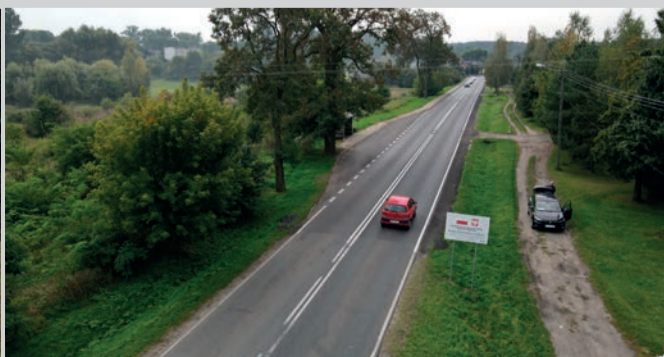
Nowa nakładka asfaltowa na drodze wojewódzkiej 482 między Dębołęką a Zapolem w powiecie sieradzkim