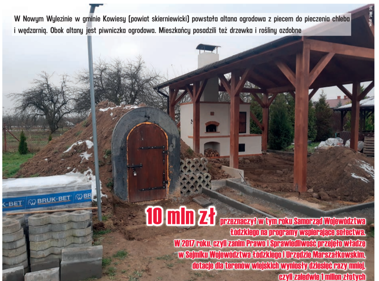
W Nowym Wylezinie w gminie Kowiesy (powiat skierniewicki) powstała altana ogrodowa z piecem do pieczenia chleba i wędzarnią. Obok altany jest piwniczka ogrodowa. Mieszkańcy posadzili też drzewka i rośliny ozdobne

10 mln zł przeznaczył w tym roku Samorząd Województwa łódzkiego na programy wspierające sołectwa. W 2017 roku, czyli zanim Prawo i Sprawiedliwość przejęło władzę w Sejmiku Województwa łódzkiego i Urzędzie Marszałkowskim, dotacje dla terenów wiejskich wynosiły dziesięć razy mniej, czyli zaledwie 1 milion złotych