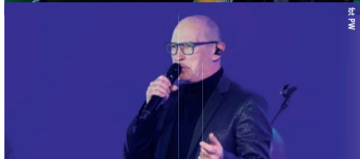
Zespół De Mono był gwiazdą Gali Nagrody Gospodarczej Województwa Łódzkiego podczas Europejskiego Forum Gospodarczego w Łodzi