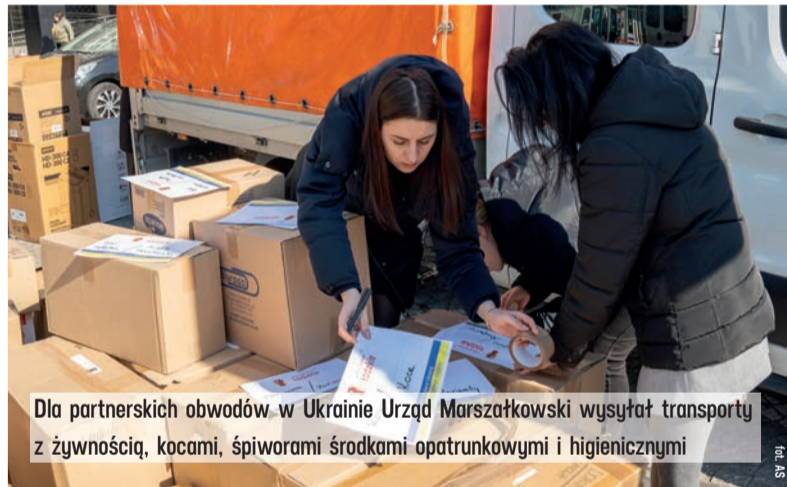
Dla partnerskich obwodów w Ukrainie Urząd Marszałkowski wysyłał transporty z żywnością, kocami, śpiworami środkami opatrunkowymi i higienicznymi