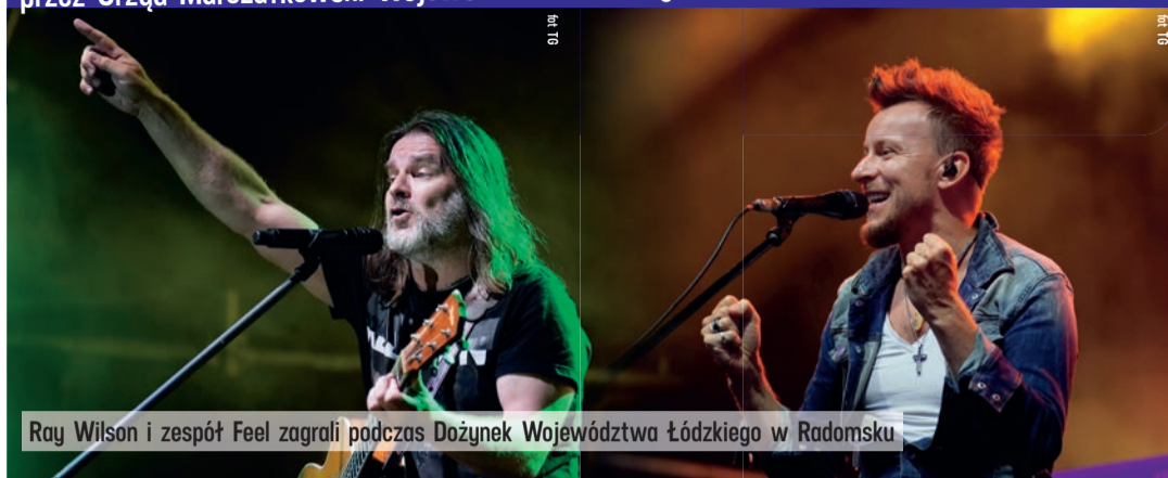
Ray Wilson i zespół Feel zagrali podczas Dożynek Województwa Łódzkiego w Radomsku

Popularni artyści zagrali i zaśpiewali podczas imprez organizowanych w 2022 roku przez Urząd Marszałkowski Województwa Łódzkiego.