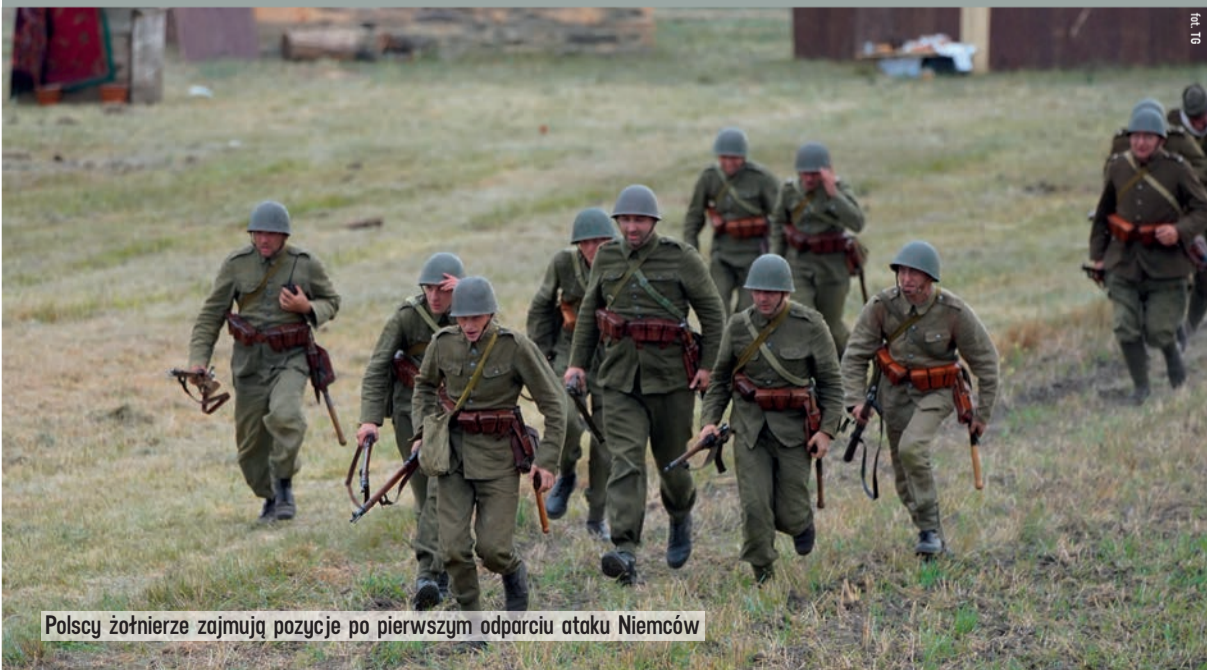
Polscy żołnierze zajmują pozycje po pierwszym odparciu ataku Niemców

zostały zapalone znicze symbolizujące śmierć około 260 polskich żołnierzy. Piknik zakończył się koncertami na scenie. Wystąpiła Orkiestra Reprezentacyjna Wojsk Lądowych we Wrocławiu. Gwiazdą wieczoru był Piotr Cugowski z zespołem. AA