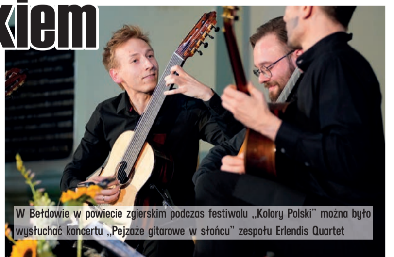
W Bełdowie w powiecie zgierskim podczas festiwalu „Kolory Polski” można było wysłuchać koncertu „Pejzaże gitarowe w stońcu” zespołu Erlendis Quartet

W 2022 roku w teren wychodziły także inne instytucje kultury prowadzone przez Samorząd Województwa Łódzkiego.