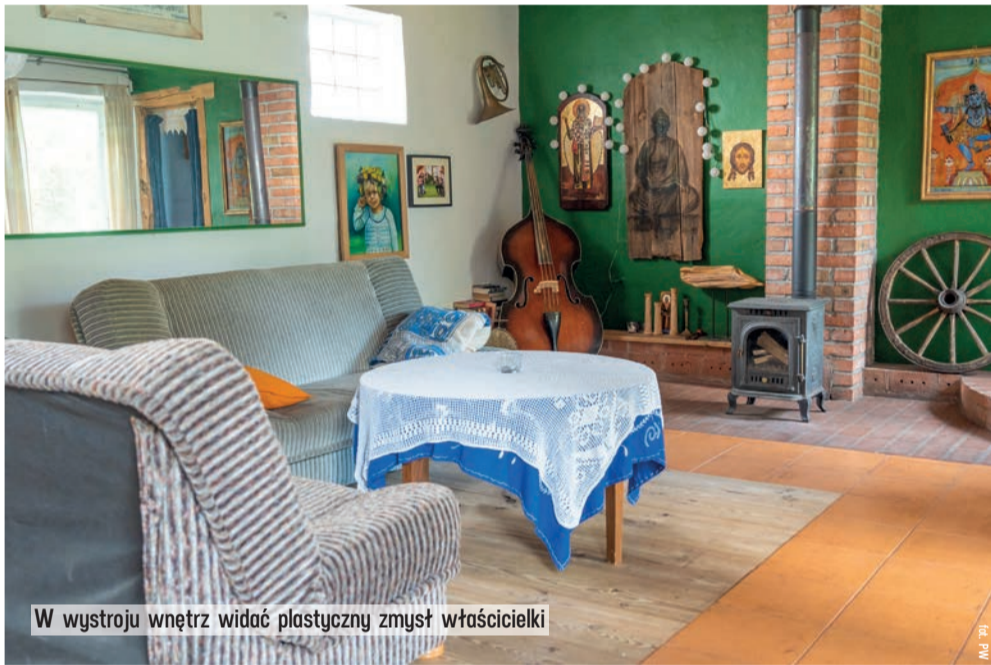
W wystroju wewnątrz widać plastyczny zmysł właścicielki