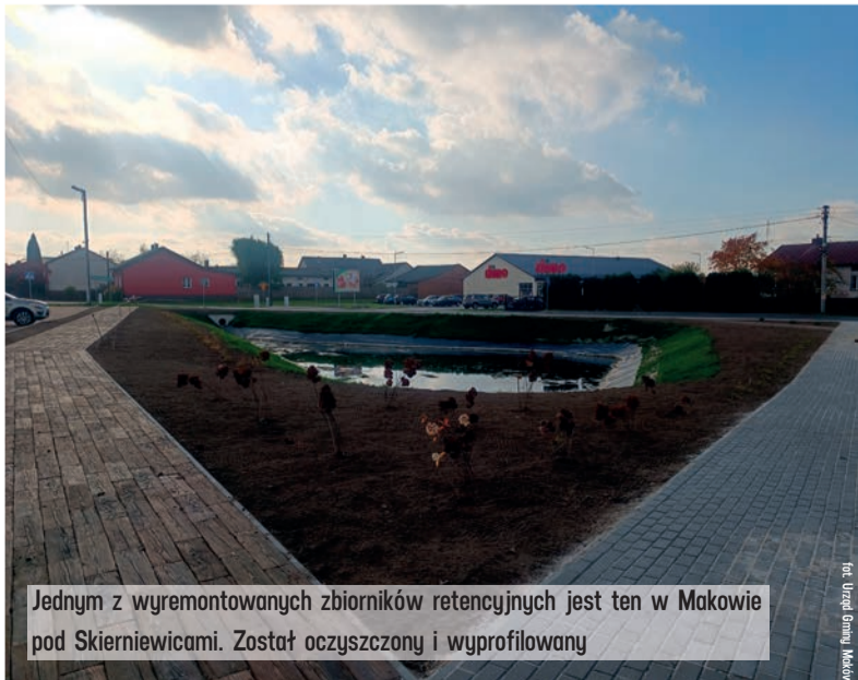
Jednym z wyremontowanych zbiorników retencyjnych jest ten w Makowie pod Skierniewicami. Został oczyszczony i wyprofilowany