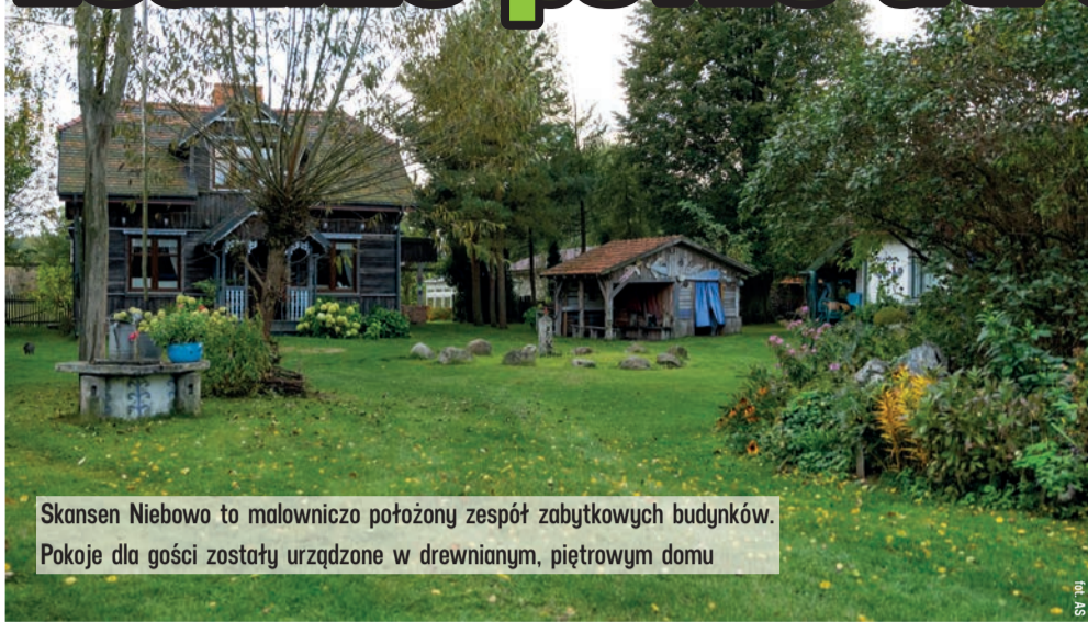
Skansen Niebowo to malowniczo położony zespół zabytkowych budynków. Pokoje dla gości zostały urządzone w drewnianym, piętrowym domu