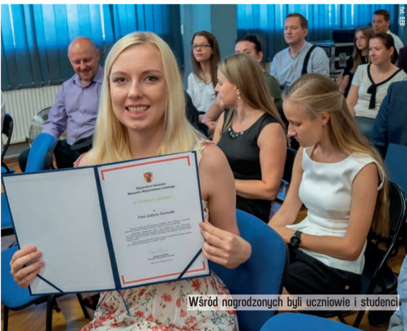
Wśród nagrodzonych byli uczniowie i studenci

nach, olimpijczykami i zwycięzcami konkursów przedmiotowych. Wśród stypendystów było też 12 studentów z Uniwersytetu Medycznego w Łodzi, 8 z Politechniki Łódzkiej, 2 z Uniwersytetu Łódzkiego oraz 1 student piotrkowskiej filii Uniwersytetu Jana Kochanowskiego w Kielcach. Łącznie