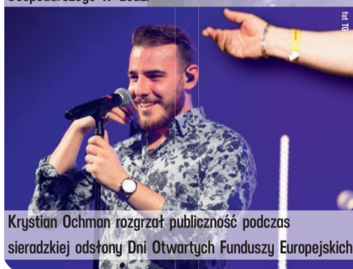
Krystian Ochman rozgrzał publiczność podczas sieradzkiej odsłony Dni Otwartych Funduszy Europejskich