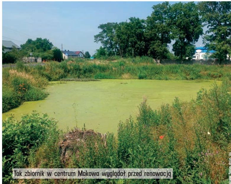
Tak zbiornik w centrum Makowa wyglądał przed renowacją