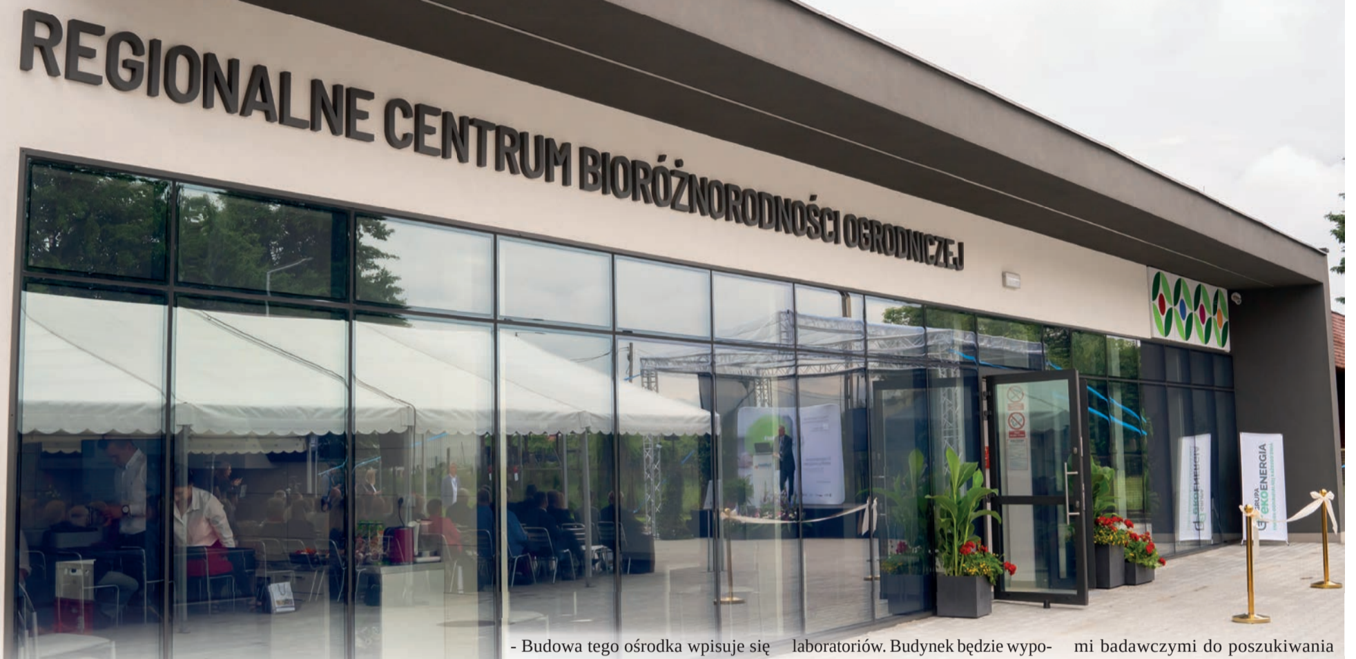
W czerwcu 2022 roku otwarte zostało Regionalne Centrum Bioróżnorodności Ogrodniczej z bankiem nasion

W listopadzie oficjalnie została rozpoczęta budowa centrum nowych technologii ogrodniczych, czyli nowoczesnego laboratorium w Instytucie Ogrodnictwa w Skierniewicach. Ta największa z dotychczasowych inwestycji w placówce została wsparta przez Samorząd Województwa Łódzkiego.