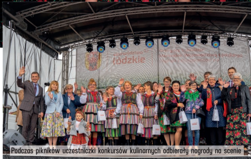
Podczas pikników uczestniczki konkursów kulinarnych odbierały nagrody na scenie