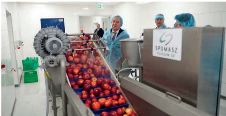
Rozpoczęcie budowy centrum było okazją do zwiedzenia wcześniejszych inwestycji wspartych przez Samorząd Województwa Łódzkiego

Centrum Innowacyjnych i Zrównoważonych Technologii Ogrodniczych to już trzecia w ostatnim czasie potężna inwestycja zwiększająca możliwości Instytutu Ogrodnictwa - Państwowego Instytutu Badawczego. W czerwcu 2022 roku otwarte zostało Regionalne Centrum Bioróżnorodności Ogrodniczej z bankiem nasion, w którym przetrzymywane są zasoby genowe roślin ogrodniczych. Jego budowa kosztowała ponad 6,8 mln zł, z czego przeszło 4,7 mln to unijne dofinansowanie z Urzędu Marszałkowskiego. W roku 2021 działalność zainaugurowało Centrum Przetwórstwa Produktów Ogrodniczych - nowoczesny obiekt badawczo-rozwojowy, dzięki któremu zwiększony został dostęp do innowacyjnych technologii stosowanych w przetwórstwie owoców i warzyw.