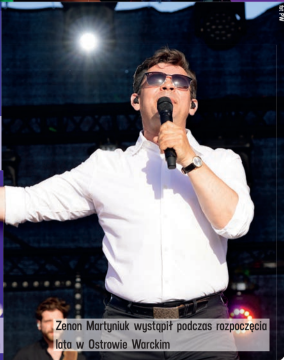
Zenon Martyniuk wystąpił podczas rozpoczęcia lata w Ostrowie Warckim