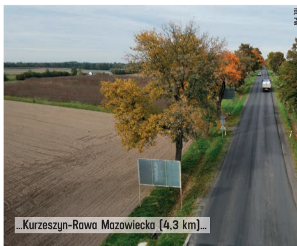
...Kurzeszyn-Rawa Mazowiecka [4,3 km]...

Dzięki wsparciu z rządowego funduszu Polski Ład rozbudowana zostanie droga wojewódzka nr 726 na odcinkach Ostrów-Wąglany (ok 4,5 km) i Miedzna Murwana-Trojanowice (ok 3 km).