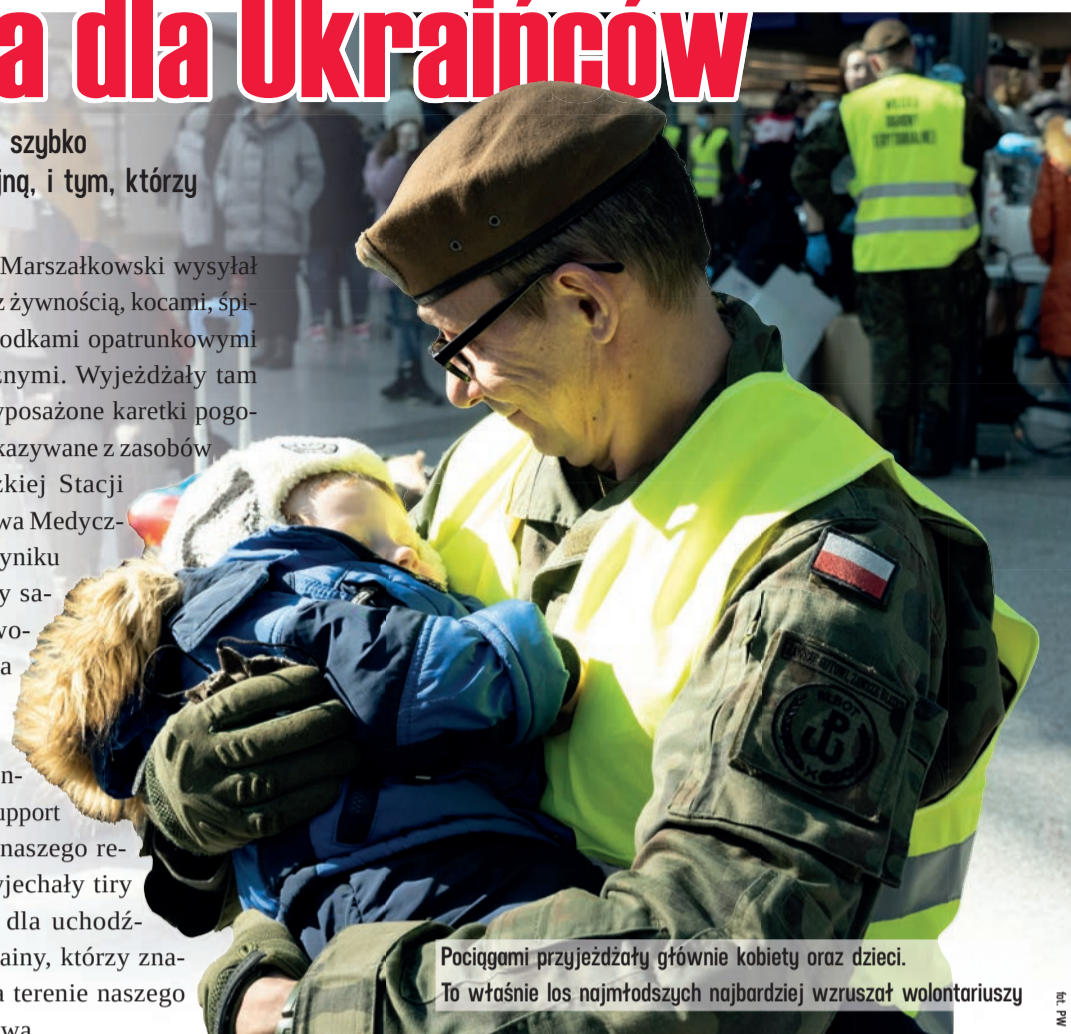
Pociągami przyjeżdżały głównie kobiety oraz dzieci. To właśnie los najmłodszych najbardziej wzruszał wolontariuszy

zaraz po wybuchu wojny. W Spale spędziły kolonie dzieci z obwodów partnerskich województwa łódzkiego w Ukrainie: winnickiego, odeskiego i wołyńskiego. AA