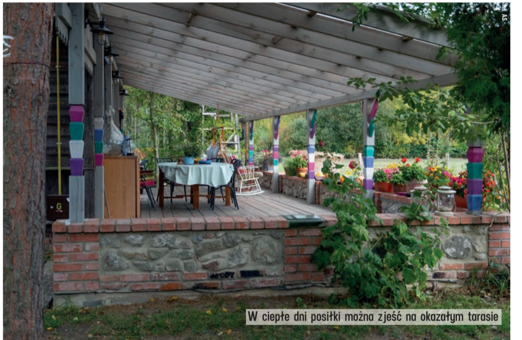
W ciepłe dni posiłki można zjeść na okazałym tarasie

W listopadzie poznaliśmy laureatów konkursu Urzędu Marszałkowskiego WŁ „Weekend na wsi - pełen smaku i atrakcji”. Nagradzamy w nim, między innymi, miejsca, gdzie można spędzić fantastyczny urlop oraz ludzi, którzy je stworzyli. Jury, po przejechaniu setek kilometrów i odwiedzeniu kilkunastu miejsc na mapie województwa, wybrało najciekawsze propozycje.