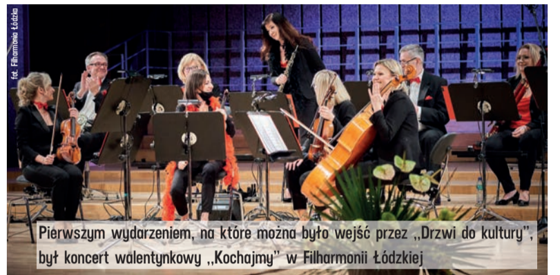
Pierwszym wydarzeniem, na które można było wejść przez „Drzwi do kultury”, był koncert walentynkowy „Kochajmy” w Filharmonii Łódzkiej