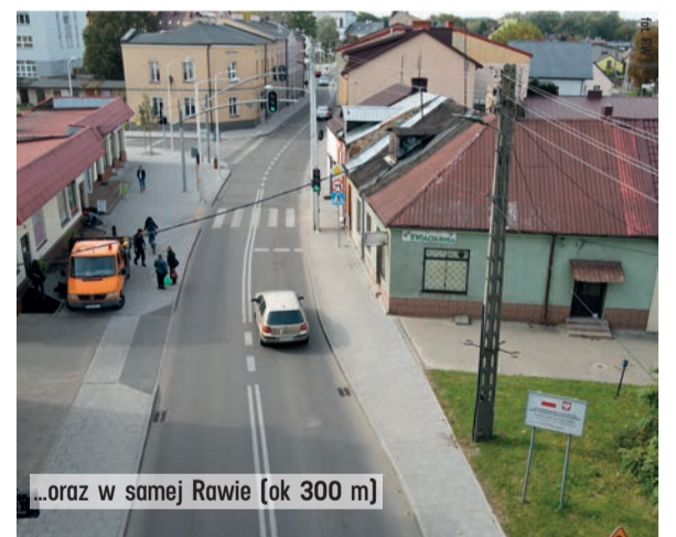
...oraz w samej Rawie [ok 300 m]