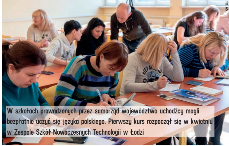
W szkołach prowadzonych przez samorząd województwa uchodźcy mogli bezpłatnie uczyć się języka polskiego. Pierwszy kurs rozpoczął się w kwietniu w Zespole Szkół Nowoczesnych Technologii w Łodzi