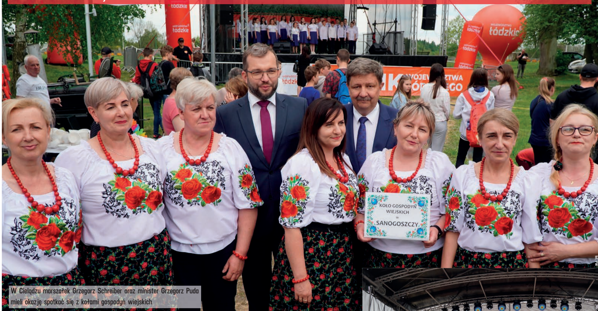
W Cielądzu marszałek Grzegorz Schreiber oraz minister Grzegorz Puda mieli okazję spotkać się z kołami gospodyń wiejskich

Ponad dwa tysiące kilometrów przemierzali od wiosny do jesieni w 2022 roku eksperci Urzędu Marszałkowskiego Województwa Łódzkiego z informacjami o ofercie i funduszach europejskich. Odwiedzili wszystkie powiaty w regionie. Na spotkaniach obecnych było łącznie ponad tysiąc osób, wręczono ponad dwieście czeków z dotacjami.