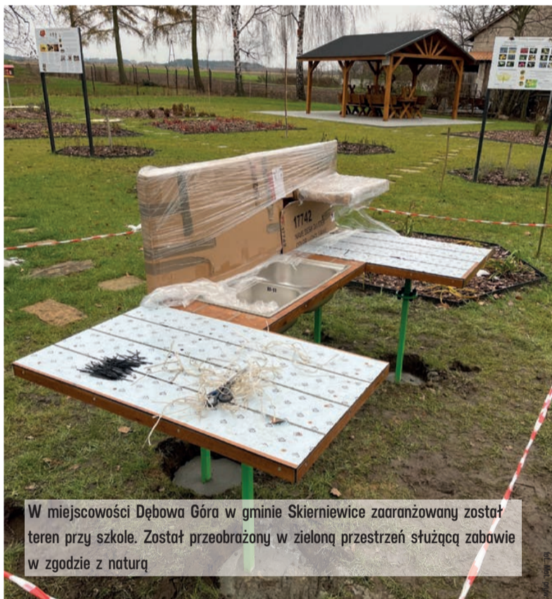
W miejscowości Dębowa Góra w gminie Skierniewice zaaranżowany został teren przy szkole. Został przeobrażony w zieloną przestrzeń służącą zabawie w zgodzie z naturą