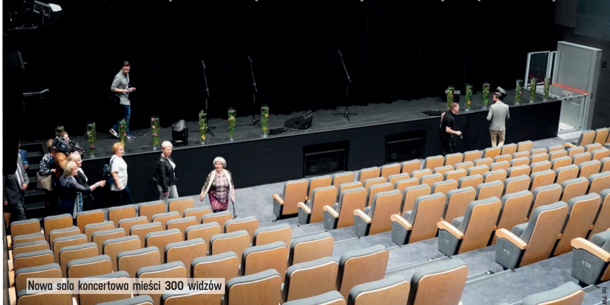
Nowa sala koncertowa mieści 300 widzów

zdecydowanie zwiększyło dostępność dla osób ze szczególnymi potrzebami. Wyremontowano pomieszczenie po dawnej piwnicy, którą mieszkańcy darzą wielkim sentymentem.