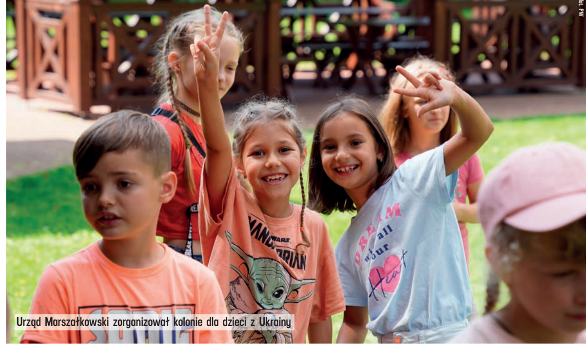
Urząd Marszałkowski zorganizował kolonie dla dzieci z Ukrainy