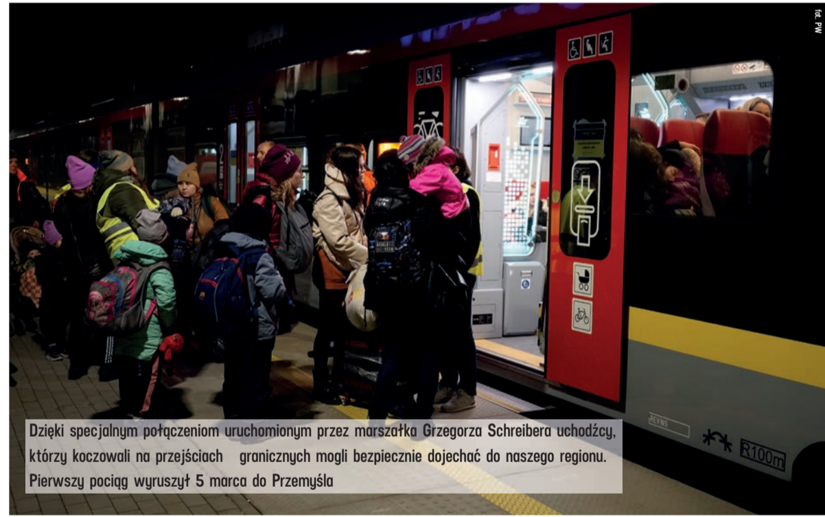
Dzięki specjalnym połączeniom uruchomionym przez marszałka Grzegorza Schreibera uchodźcy, którzy koczowali na przejściach granicznych mogli bezpiecznie dojechać do naszego regionu. Pierwszy pociąg wyruszył 5 marca do Przemysła