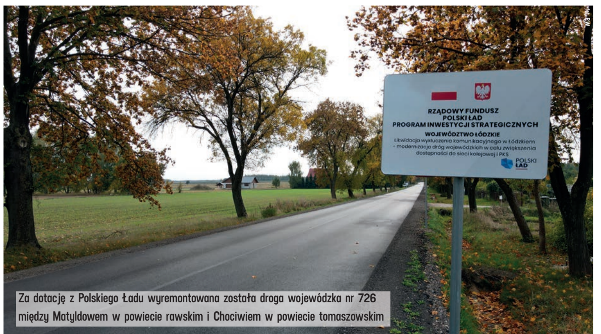
Za dotację z Polskiego Ładu wyremontowana została droga wojewódzka nr 726 między Matyldowem w powiecie rawskim i Chociwem w powiecie tomaszowskim