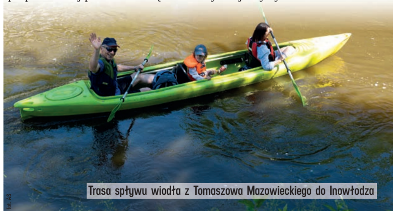
Trasa splywu wiodła z Tomaszowa Mazowieckiego do Inowłodzi