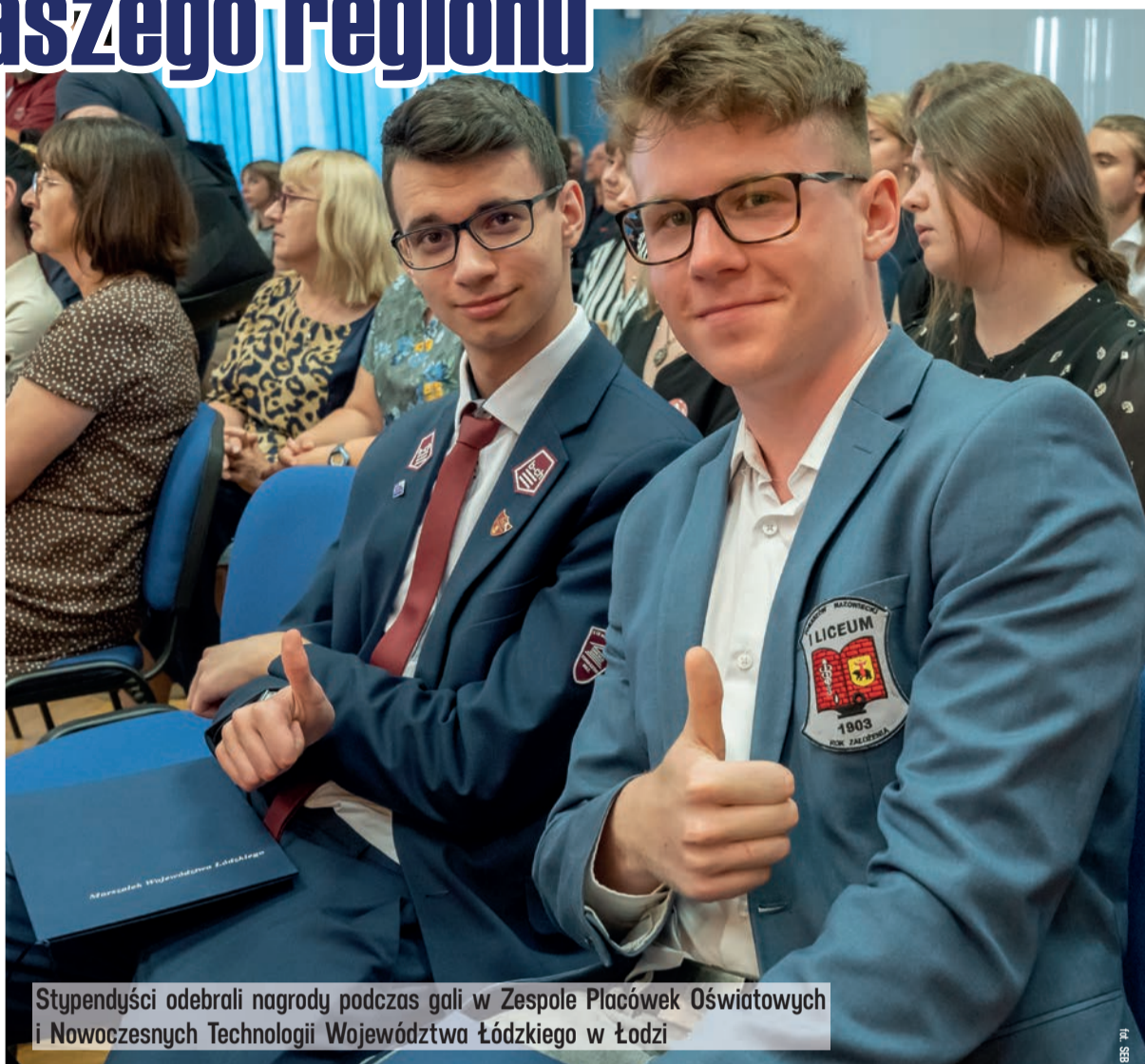
Stypendyści odebrali nagrody podczas gali w Zespole Placówek Oświatowych i Nowoczesnych Technologii Województwa Łódzkiego w Łodzi

W czerwcu wręczone zostały stypendia naukowe i artystyczne marszałka województwa łódzkiego. Pierwsze otrzymało 48 uczniów i studentów z Łódzkiego. Do stypendystów trafiło ponad 150 tys. zł. Nagrody - od 2,5 tys. do 4 tys. zł - przyznane zostały 25 uczniom szkół ponadpodstawowych, którzy uczą się na terenie województwa łódzkiego. Wyróżnieni są pasjonatami w swoich dziedzi-