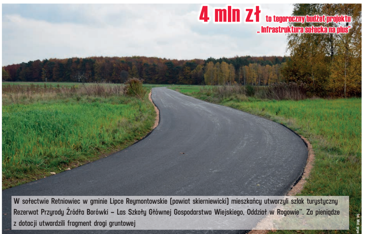
W sołectwie Retniowiec w gminie Lipce Reymontowskie (powiat skierniewicki) mieszkańcy utworzyli szlak turystyczny Rezerwat Przyrody Źródła Borówki - Las Szkoły Głównej Gospodarstwa Wiejskiego, Oddział w Rogowie. Za pieniądze z dotacji utwardzili fragment drogi gruntowej

4 mln zł to tegoroczny budżet projektu „Infrastruktura sołecka na plus”