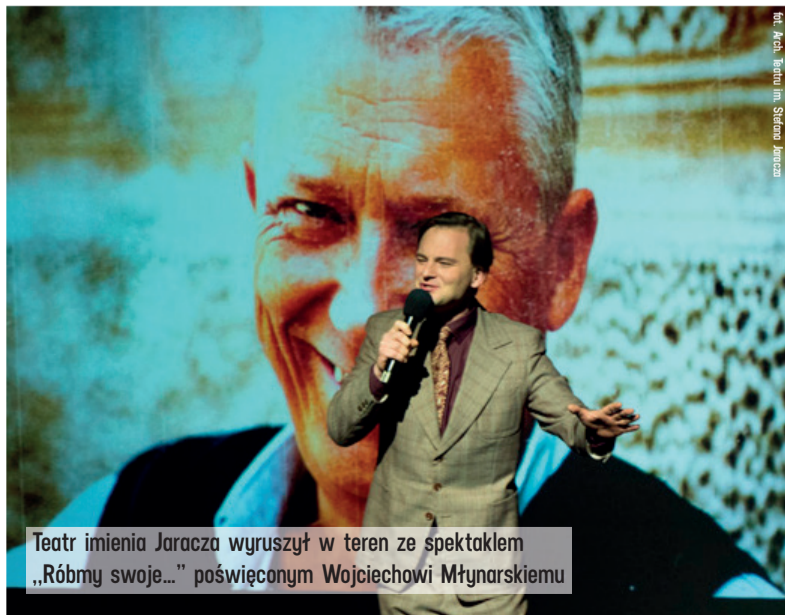
Teatr imienia Jaracza wyruszył w teren ze spektaklem „Róbmy swoje...” poświęconym Wojciechowi Młynarskiemu

niczą wstępnie trzy miasta, ale projekt będzie rozwijany na pozostałe miasta i gminy województwa. Warto śledzić repertuar Teatru im. Stefana Jaracza. AA