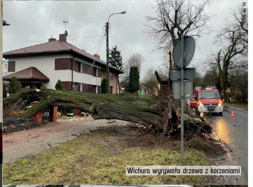
Wichura wyrzywała drzewa z korzeniami

Na początku 2022 roku Zarząd Województwa Łódzkiego zdecydował o utworzeniu stowarzyszenia, dzięki któremu ofiary klęsk żywiołowych mogą otrzymać szybkie wsparcie. Stowarzyszenia już działają.