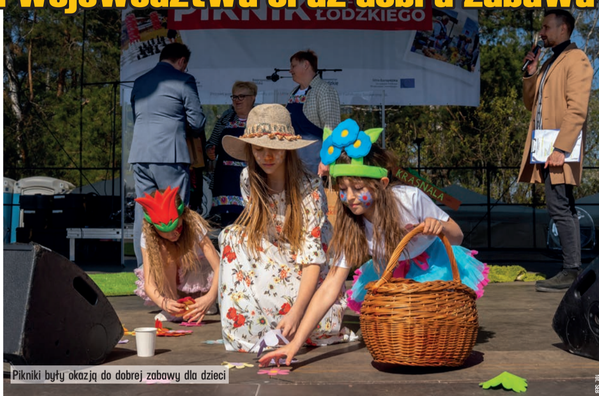
Pikniki były okazją do dobrej zabawy dla dzieci