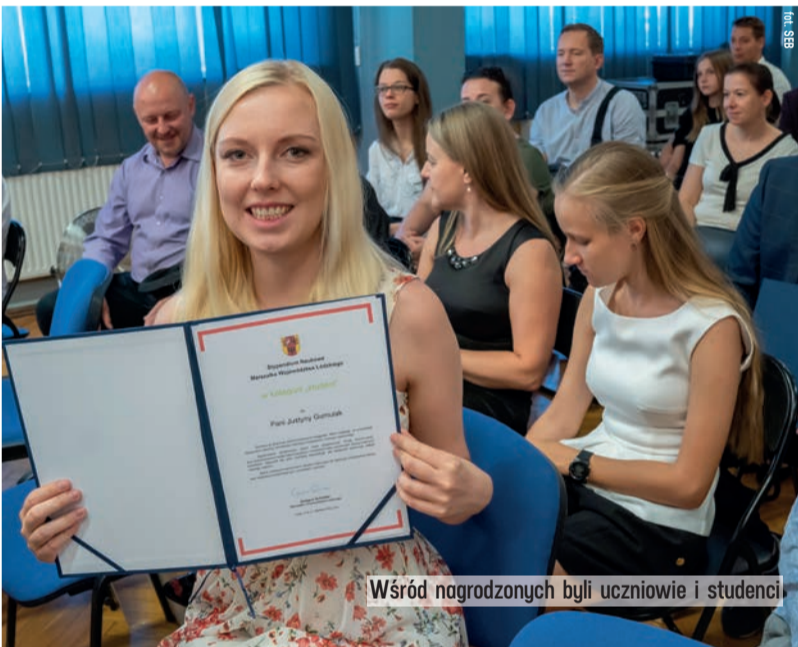
Wśród nagrodzonych byli uczniowie i studenci

nach, olimpijczykami i zwycięzcami konkursów przedmiotowych. Wśród stypendystów było też 12 studentów z Uniwersytetu Medycznego w Łodzi, 8 z Politechniki Łódzkiej, 2 z Uniwersytetu Łódzkiego oraz 1 student piotrkowskiej filii Uniwersytetu Jana Kochanowskiego w Kielcach. Łącznie