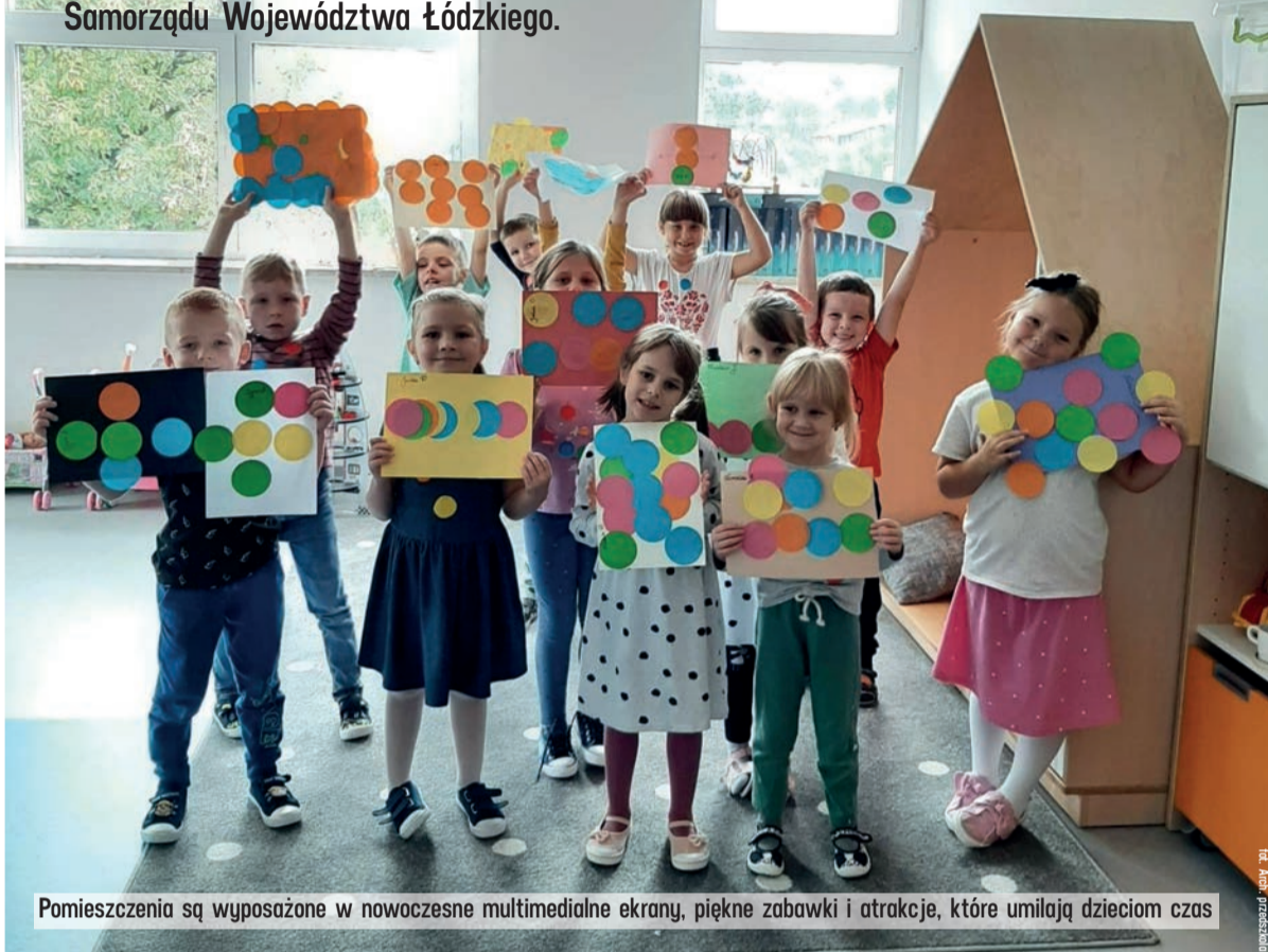
Pomieszczenia są wyposażone w nowoczesne multimedialne ekrany, piękne zabawki i atrakcje, które umilają dzieciom czas

W czerwcu 2022 roku w Gomunicach w powiecie radomszczańskim zostało otwarte nowoczesne, ekologiczne przedszkole. Blisko połowa wartości inwestycji to wsparcie Samorządu Województwa Łódzkiego.