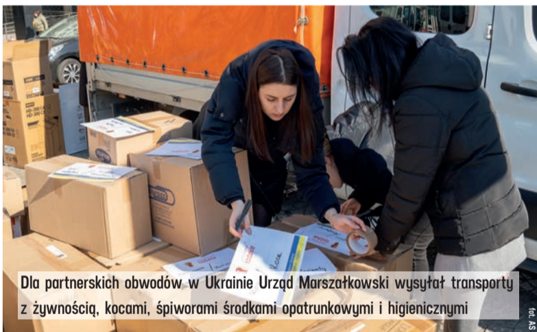
Dla partnerskich obwodów w Ukrainie Urząd Marszałkowski wysyłał transporty z żywnością, kocami, śpiworami środkami opatrunkowymi i higienicznymi