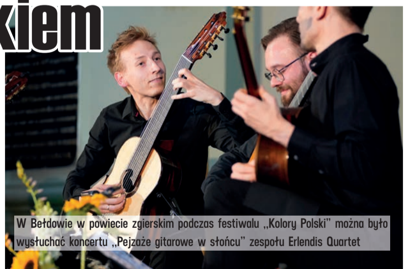
W Bełchatowie w powiecie zgierskim podczas festiwalu „Kolory Polski” można było wysłuchać koncertu „Pejzaże gitarowe w stońcu” zespołu Erlendis Quartet

W 2022 roku w teren wychodziły także inne instytucje kultury prowadzone przez Samorząd Województwa Łódzkiego.