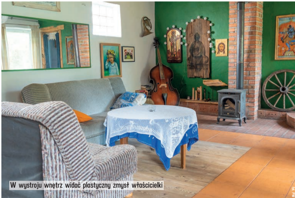
W wystroju wewnątrz widać plastyczny zmysł właścicielki