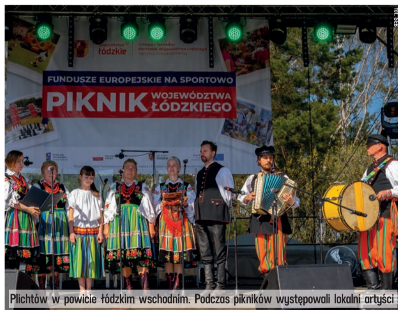
Plichtów w powiecie łódzkim wschodnim. Podczas pikników występowali lokalni artyści