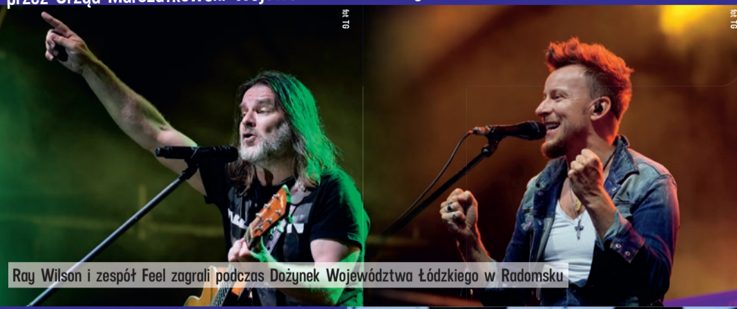
Ray Wilson i zespół Feel zagrali podczas Dożynek Województwa Łódzkiego w Radomsku

Popularni artyści zagrali i zaśpiewali podczas imprez organizowanych w 2022 roku przez Urząd Marszałkowski Województwa Łódzkiego.