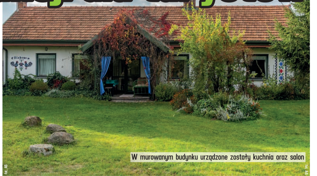
W murowanym budynku urządzone zostały kuchnia oraz salon