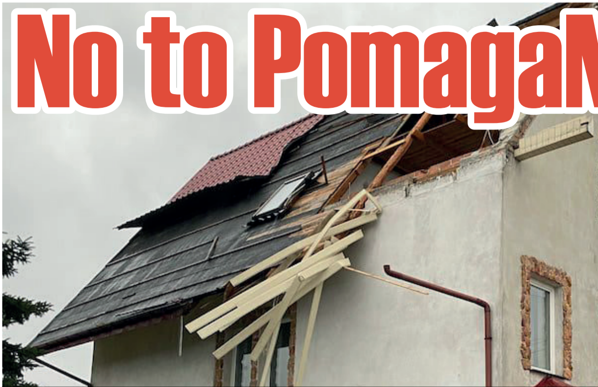
Podczas wichur w lutym olbrzymie straty ponieśli między innymi mieszkańcy powiatu piotrkowskiego, w tym gminy Wolbórz. Wiatr był tak silny, że zrywał dachy