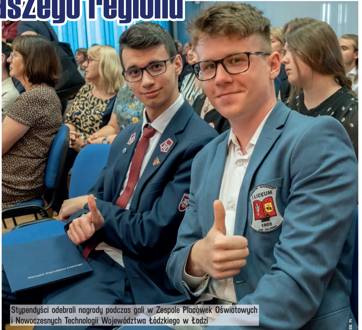
Stypendyści odebrali nagrody podczas gali w Zespole Placówek Oświatowych i Nowoczesnych Technologii Województwa Łódzkiego w Łodzi

W czerwcu wręczone zostały stypendia naukowe i artystyczne marszałka województwa łódzkiego. Pierwsze otrzymało 48 uczniów i studentów z Łódzkiego. Do stypendystów trafiło ponad 150 tys. zł. Nagrody - od 2,5 tys. do 4 tys. zł - przyznane zostały 25 uczniom szkół ponadpodstawowych, którzy uczą się na terenie województwa łódzkiego. Wyróżnieni są pasjonatami w swoich dziedzi-