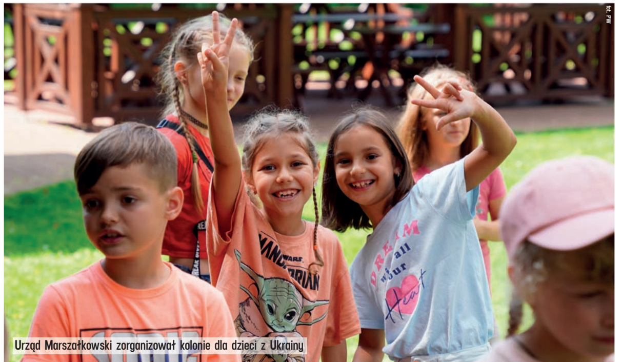
Urząd Marszałkowski zorganizował kolonie dla dzieci z Ukrainy