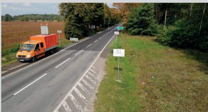
Wyremontowana droga wojewódzka nr 483 w okolicach Chabielic w powiecie bełchatowskim

Remonty dróg wojewódzkich ze wsparciem dotacji z Polskiego Ładu już dobiegają końca. Oto kilka przykładów: