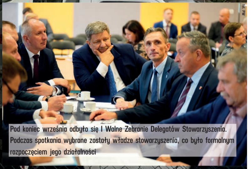
Pod koniec września odbyła się I Walne Zebranie Delegatów Stowarzyszenia. Podczas spotkania wybrane zostały władze stowarzyszenia, co było formalnym rozpoczęciem jego działalności

Na ten apel odpowiedziało czterdzieści samorządów. Te, które przystąpiły do stowarzyszenia, będą udzielać sobie wzajemnej pomocy finansowej, kiedy któryś z samorządów zostanie dotknięty skutkami klęsk żywiołowych i innych nieoczekiwanych zdarzeń. Budżet „PomagaMY” wynosił w 2022 roku 500 tys. zł i pochodził ze składek członków stowarzyszenia. Z tego 300 tys. zł to wkład samorządu województwa łódzkiego. Na koniec 2022 roku stowarzyszenie tworzyło już 56 samorządów z naszego regionu. OS, AK