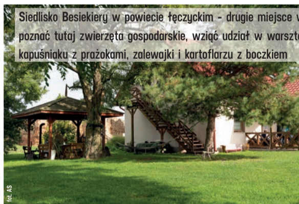
Siedlisko Besiekierzy w powiecie łęczyckim - drugie miejsce w kategorii „Weekend pełen atrakcji i smaku”. Goście mogą poznać tutaj zwierzęta gospodarskie, wziąć udział w warsztatach ginących rzemiosł, np. bibułkarstwa. Warto spróbować kapuśniaku z przczkami, zalewajki i kartoflarzu z boczkami

W kategorii „Weekend pełen atrakcji i smaku” wyróżnienia zdobyły Dwór Kiełczówka z powiatu piotrkowskiego oraz Agrochatka - Zielony Zakątek ze Skrzywna w powiecie wieluńskim.