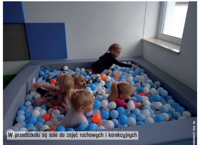
W przedszkolu są sale do zajęć ruchowych i korekcyjnych

Dzieci z gminy Gomunice chodzą do nowej placówki od września. Przedszkole wygląda jak z bajki. Jest tu sześć sal dla około 150 dzieci. Pomieszczenia są wyposażone w nowoczesne multimedialne ekrany, piękne zabawki i atrakcje, które umilają dzieciom czas. Są sale do zajęć ruchowych i korekcyjnych, pokoje dla pedagogów i logopedy. Z kolei lokalni samorządowcy nie muszą się głowić nad tym, skąd wziąć pieniądze na ogrzanie budynku. Bo przedszkole należy do najnowocześniejszych w kraju. Przede wszystkim dzięki systemowi ogrze-