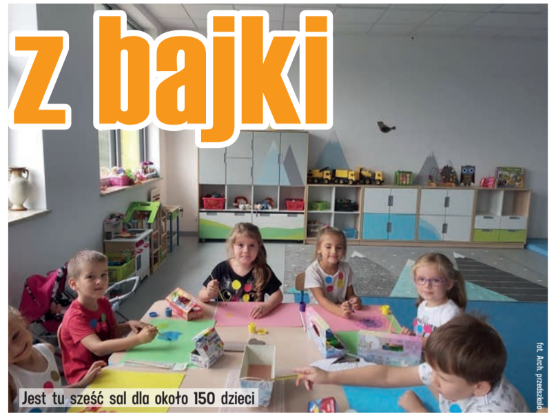
Jest tu sześć sal dla około 150 dzieci