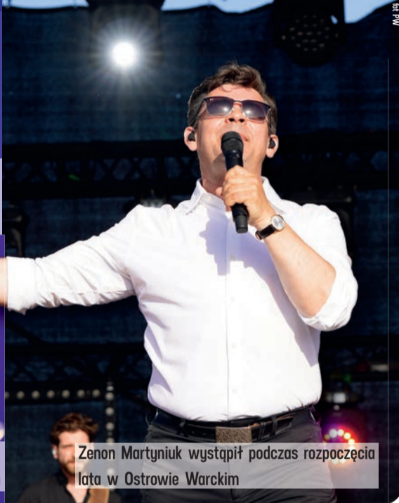
Zenon Martyniuk wystąpił podczas rozpoczęcia lata w Ostrowie Warckim