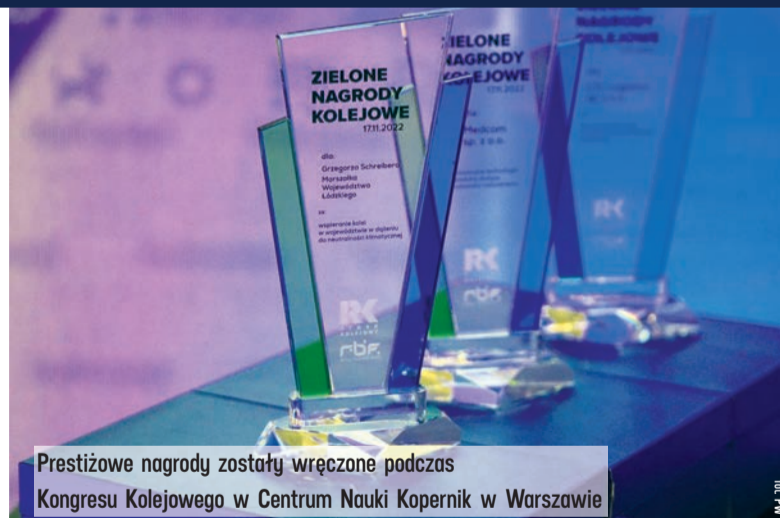
Prestiżowe nagrody zostały wręczone podczas Kongresu Kolejowego w Centrum Nauki Kopernik w Warszawie