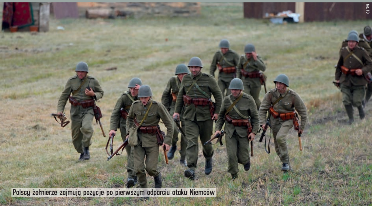
Polscy żołnierze zajmują pozycje po pierwszym odparciu ataku Niemców

zostały zapalone znicze symbolizujące śmierć około 260 polskich żołnierzy. Piknik zakończył się koncertami na scenie. Wystąpiła Orkiestra Reprezentacyjna Wojsk Lądowych we Wrocławiu. Gwiazdą wieczoru był Piotr Cugowski z zespołem. AA