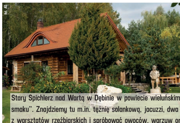
Stary Spichlerz nad Wartą w Dębnie w powiecie wieluńskim - trzecie miejsce w kategorii „Weekend pełen atrakcji i smaku”. Znajdziemy tu m.in. łożnię solankową, jacuzzi, dwa stawy i plac zabaw dla dzieci. Możemy skorzystać z warsztatów rzeźbiarskich i spróbować owoców, warzyw oraz ziół z ekologicznych upraw