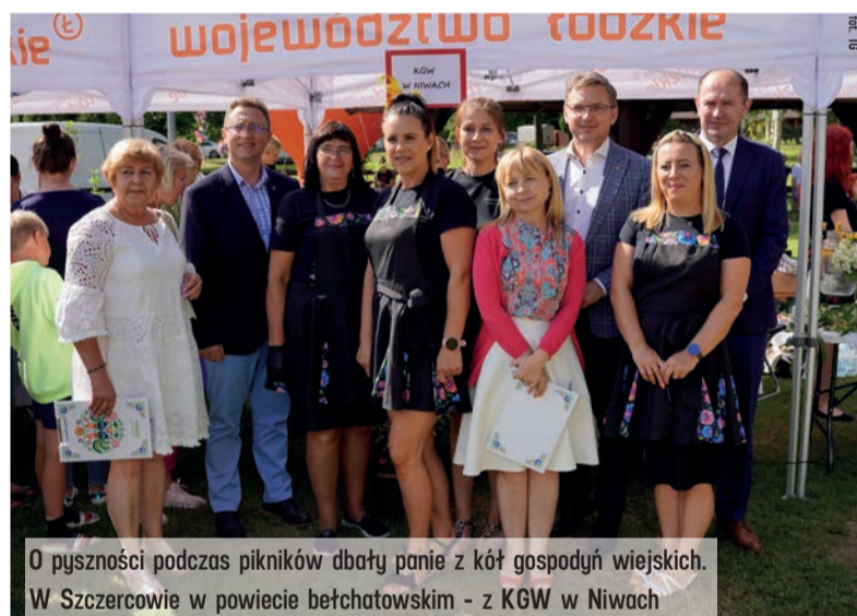
O pyszności podczas pikników dbały panie z kół gospodyń wiejskich. W Szczercowie w powiecie bełchatowskim - z KGW w Niwach