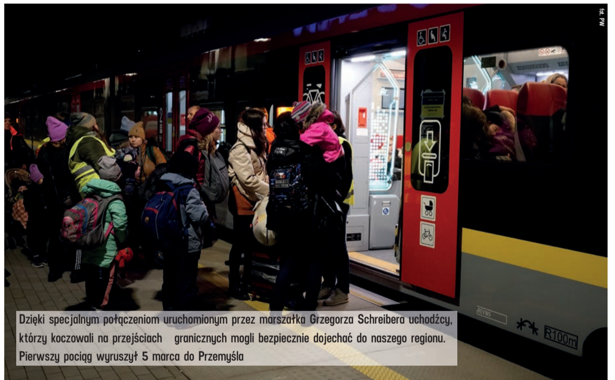
Dzięki specjalnym połączeniom uruchomionym przez marszałka Grzegorza Schreibera uchodźcy, którzy koczowali na przejściach granicznych mogli bezpiecznie dojechać do naszego regionu. Pierwszy pociąg wyruszył 5 marca do Przemysła