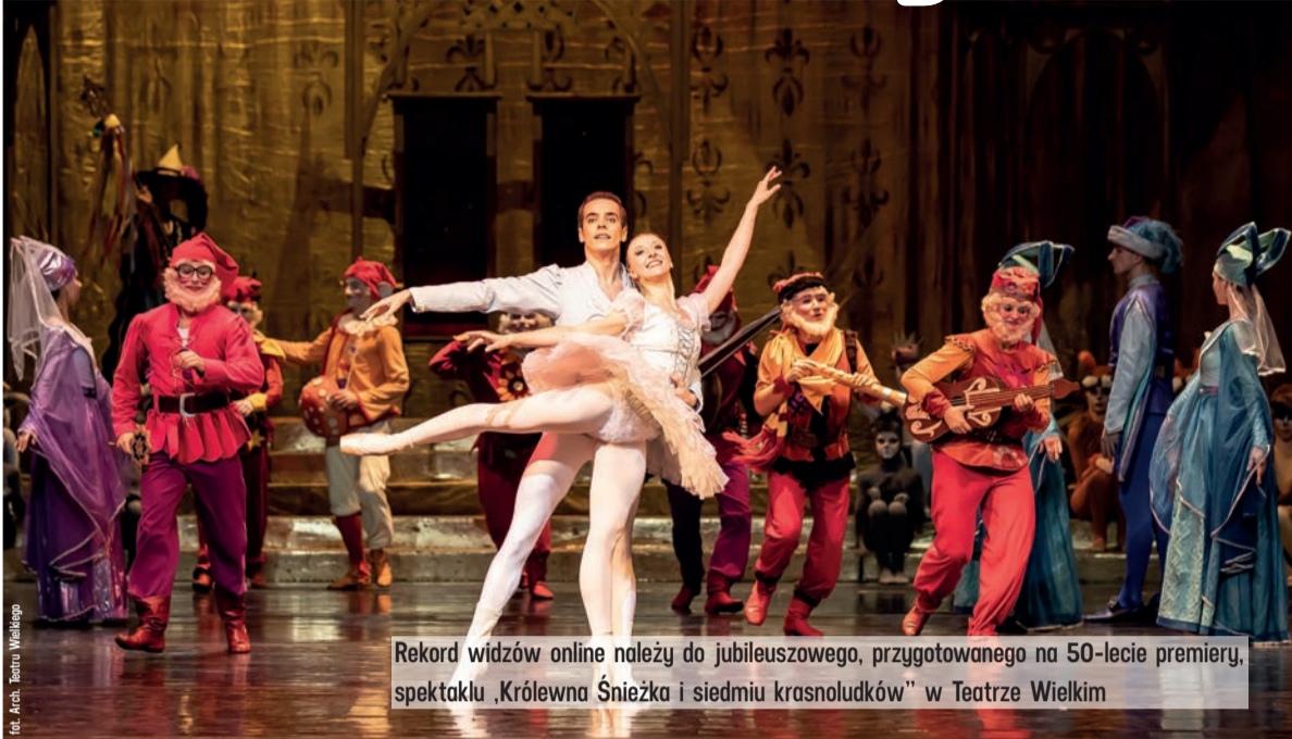
Rekord widzów online należy do jubileuszowego, przygotowanego na 50-lecie premiery, spektaklu „Królowa Śnieżka i siedmiu krasnoludków” w Teatrze Wielkim