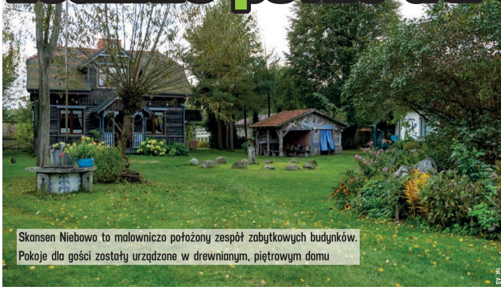
Skansen Niebowo to malowniczo położony zespół zabytkowych budynków. Pokoje dla gości zostały urządzone w drewnianym, piętrowym domu