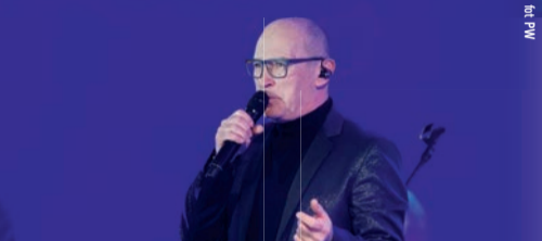
Zespół De Mono był gwiazdą Gali Nagrody Gospodarczej Województwa Łódzkiego podczas Europejskiego Forum Gospodarczego w Łodzi