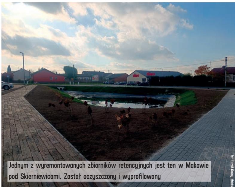
Jednym z wyremontowanych zbiorników retencyjnych jest ten w Makowie pod Skierniewicami. Został oczyszczony i wyprofilowany