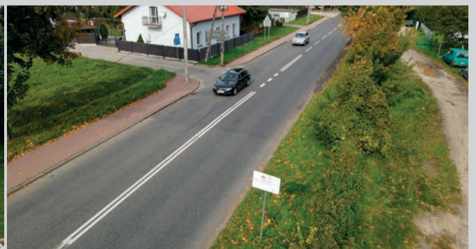
Odnowiona droga wojewódzka nr 707 w Rawie Mazowieckiej