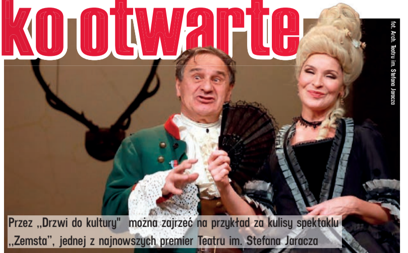
Przez „Drzwi do kultury” można zajrzeć na przykład za kulisy spektaklu „Zemsta”, jednej z najnowszych premier Teatru im. Stefana Jaracza

Portal zawiera materiały z instytucji kultury prowadzonych przez samorząd województwa. To: Teatr Wielki, Teatr im. Stefana Jaracza, Filharmonia Łódzka, Muzeum Sztuki, Muzeum Archeologiczne i Etnograficzne, Łódzki Dom Kultury, Wojewódzka Biblioteka Publiczna. Ale „Drzwi do kultury” to także możliwość zaprezentowania Łódzkiego jako województwa filmowego. Dzięki portalowi mamy możliwość pokazania filmów z zasobów Wytwórni Filmów Oświatowych w Łodzi. AA