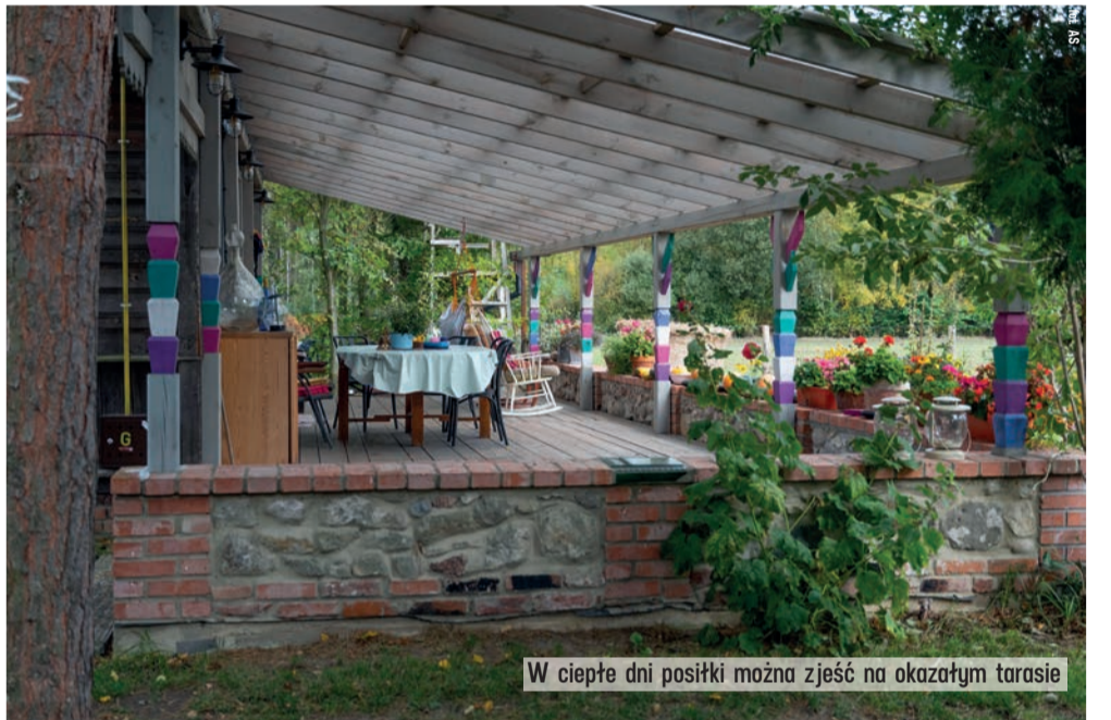
W ciepłe dni posiłki można zjeść na okazałym tarasie

W listopadzie poznaliśmy laureatów konkursu Urzędu Marszałkowskiego WŁ „Weekend na wsi - pełen smaku i atrakcji”. Nagradzamy w nim, między innymi, miejsca, gdzie można spędzić fantastyczny urlop oraz ludzi, którzy je stworzyli. Jury, po przejechaniu setek kilometrów i odwiedzeniu kilkunastu miejsc na mapie województwa, wybrało najciekawsze propozycje.