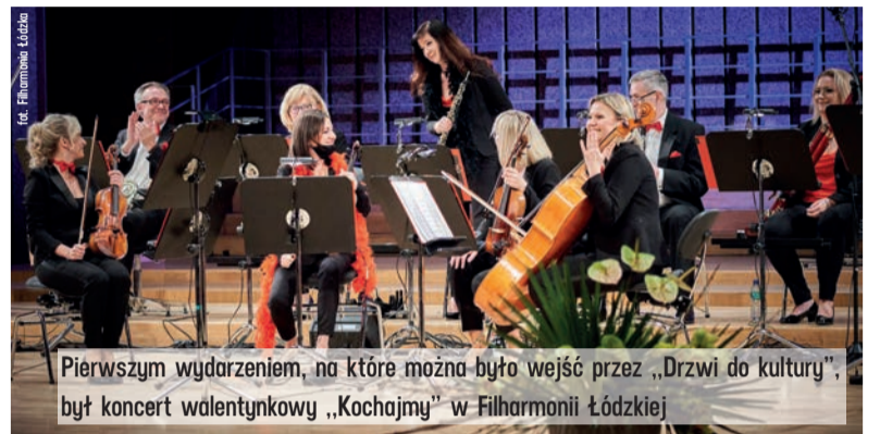
Pierwszym wydarzeniem, na które można było wejść przez „Drzwi do kultury”, był koncert walentynkowy „Kochajmy” w Filharmonii Łódzkiej