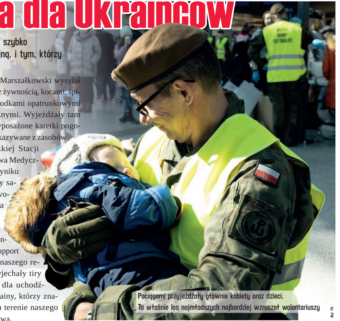
Pociągami przyjeżdżały głównie kobiety oraz dzieci. To właśnie los najmłodszych najbardziej wzruszał wolontariuszy

zaraz po wybuchu wojny. W Spale spędziły kolonie dzieci z obwodów partnerskich województwa łódzkiego w Ukrainie: winnickiego, odeskiego i wołyńskiego. AA