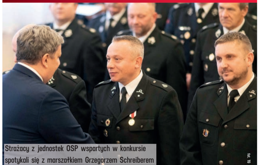
Strażacy z jednostek OSP wspartych w konkursie spotkali się z marszałkiem Grzegorzem Schreiberem

Nowe agregaty, pompy, węże, radiostacje, kamery termowizyjne, odzież bojowa - to sprzęt, jaki w 2022 roku trafił do 156 jednostek OSP. Samorząd Województwa Łódzkiego przekazał na ten cel 3 miliony złotych.