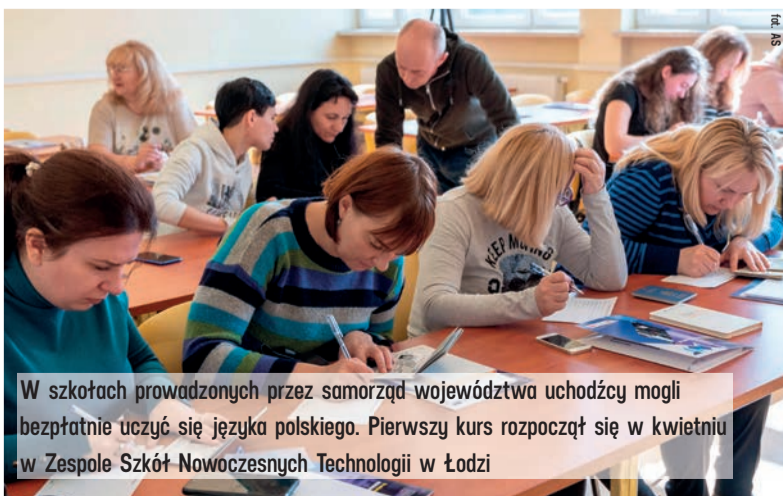
W szkołach prowadzonych przez samorząd województwa uchodźcy mogli bezpłatnie uczyć się języka polskiego. Pierwszy kurs rozpoczął się w kwietniu w Zespole Szkół Nowoczesnych Technologii w Łodzi