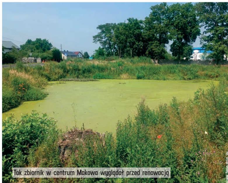
Tak zbiornik w centrum Makowa wyglądał przed renowacją