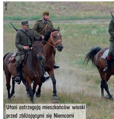
Ułani ostrzegają mieszkańców wioski przed zbliżającymi się Niemcami