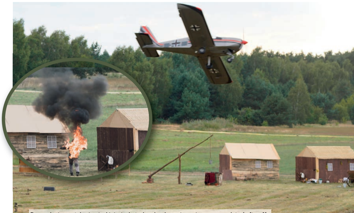
Poprzedzające atak niemieckiej piechoty bombardowanie wsi przez samoloty Luftwaffe