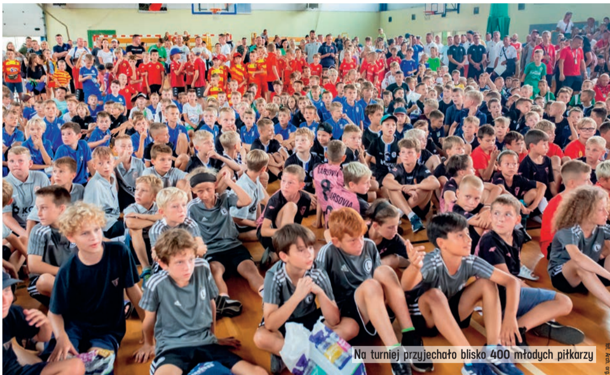
Na turniej przyjechało blisko 400 młodych piłkarzy