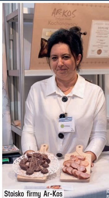
Stoisko firmy Ar-Kos