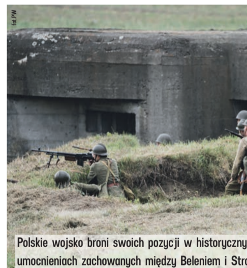
Polskie wojsko broni swoich pozycji w historycznych umocnieniach zachowanych między Beleniem i Strońskiem