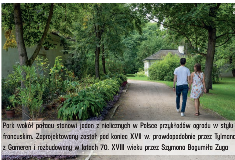
Park wokół pałacu stanowi jeden z nielicznych w Polsce przykładów ogrodu w stylu francuskim. Zaprojektowany został pod koniec XVII w. prawdopodobnie przez Tylmana z Gameren i rozbudowany w latach 70. XVIII wieku przez Szymona Bogumiła Zuga