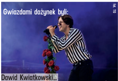
Gwiazdami dożynek byli: