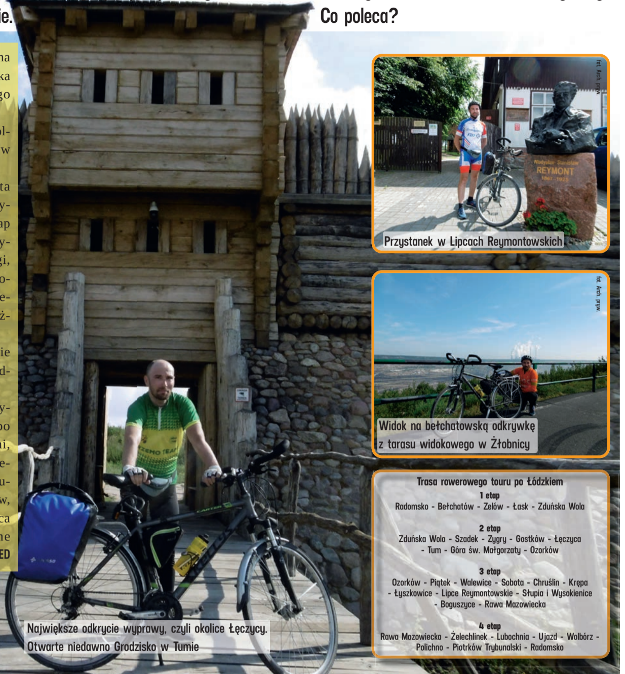
Największe odkrycie wyprawy, czyli okolice Łęczycy. Otwarte niedawno Grodzisko w Tumie

W głowie układa już plan przyszłorocznej, dużej wyprawy po Łódzkiem. Rajd potrwa 6-7 dni, a na trasie znajdą się m.in. Wieluń, Ożarów, Bolesławiec, Wieruszów, Jeziersko, Uniejów, Oporów, Tomaszów Mazowiecki i miejsca wokół tego miasta, Poświętne i Przedbórz. ED