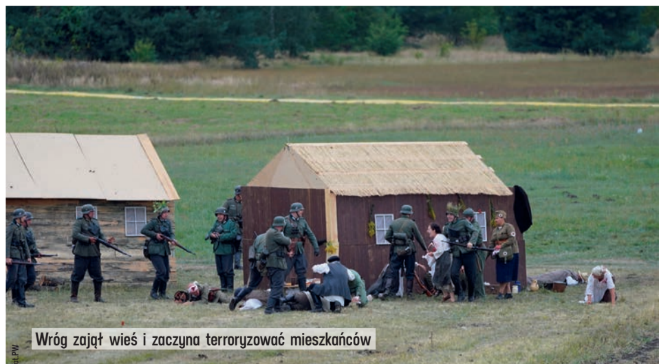
Wróg zajął wieś i zaczyna terroryzować mieszkańców