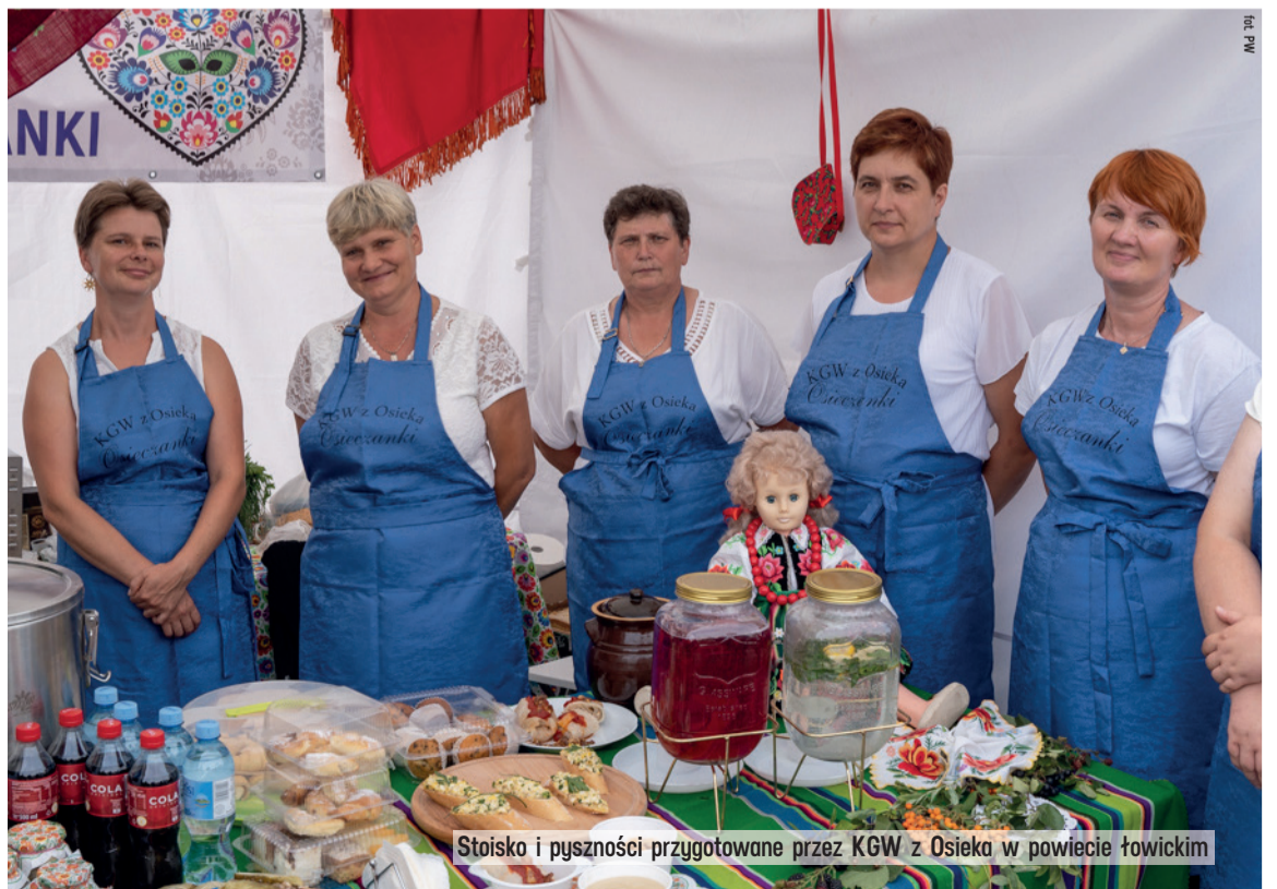
Stoisko i pyszności przygotowane przez KGW z Osieka w powiecie łowickim