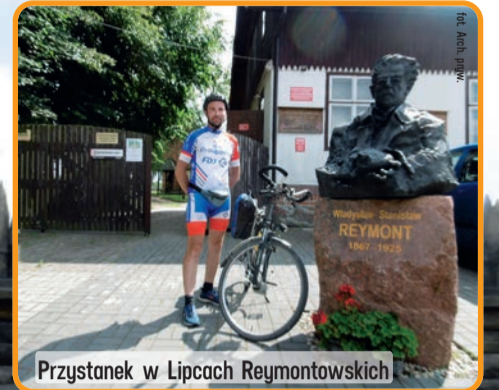
Przystanek w Lipcach Reymontowskich