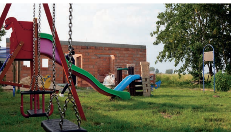
W miejscowości Czerkiesy w gminie Pajęczno dom ludowy jest w trakcie budowy. Inwestycja została wsparta kwotą 100 tys. zł z programu Infrastruktura Sołecka Plus

to tegoroczny budżet projektu Infrastruktura Sołecka Plus