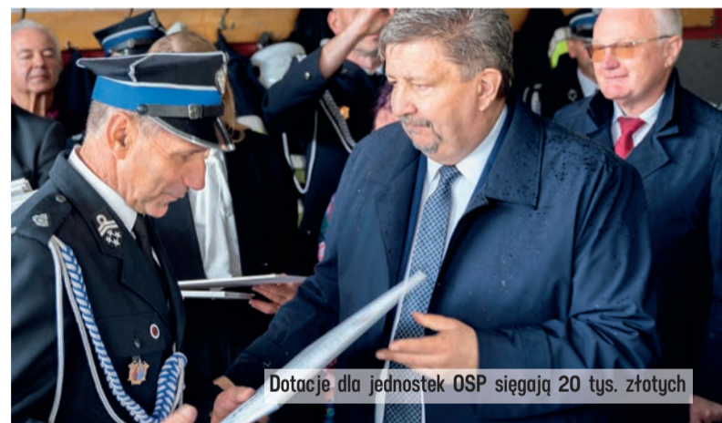
Dotacje dla jednostek OSP sięgają 20 tys. złotych