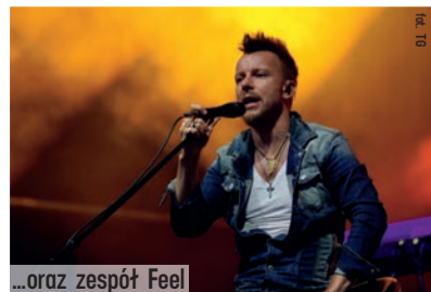
...oraz zespół Feel