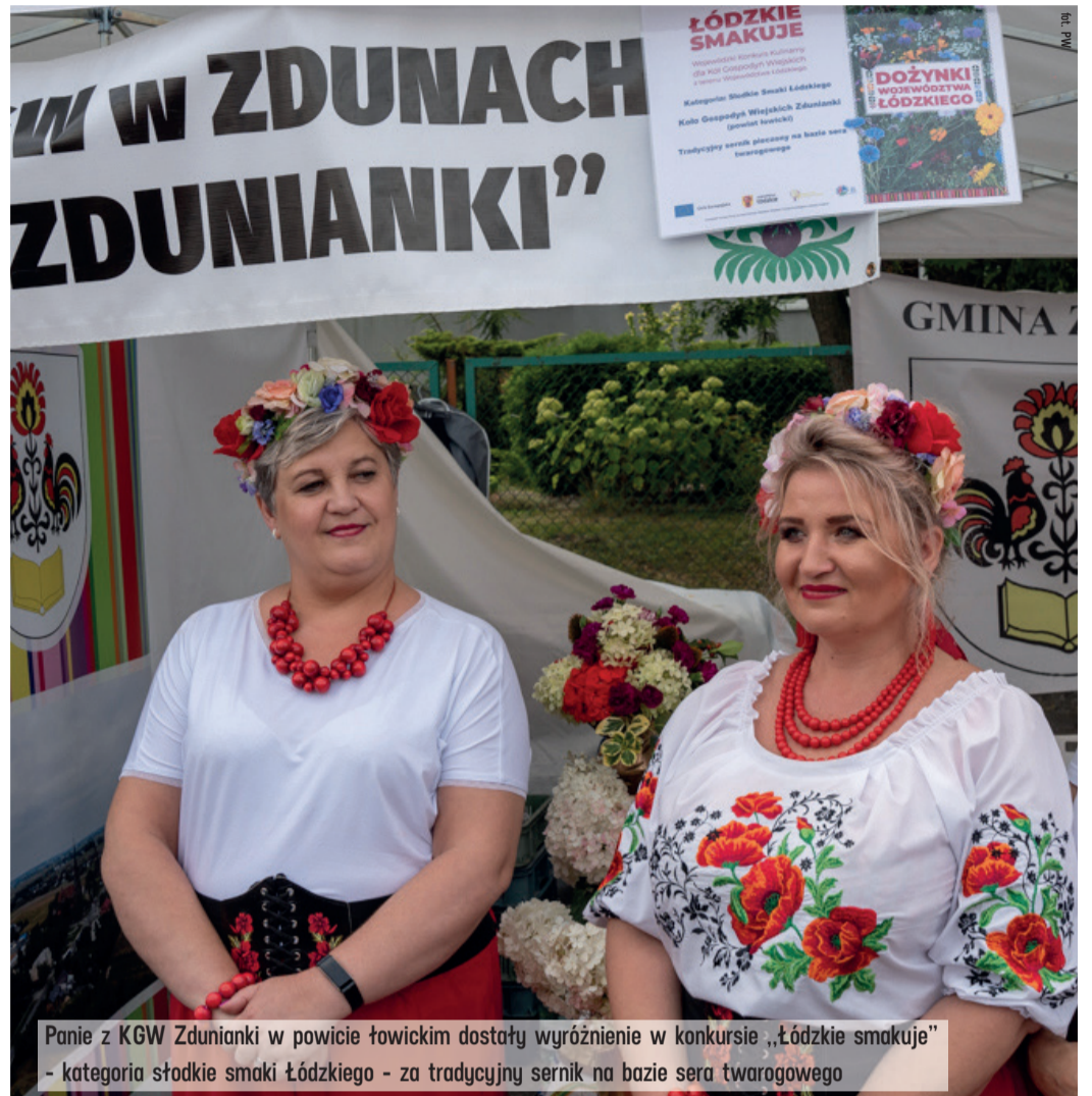
Panie z KGW Zdunianki w powiecie łowickim dostały wyróżnienie w konkursie „Łódzkie smakuje” - kategoria słodkie smaki Łódzkiego - za tradycyjny sernik na bazie sera twarogowego