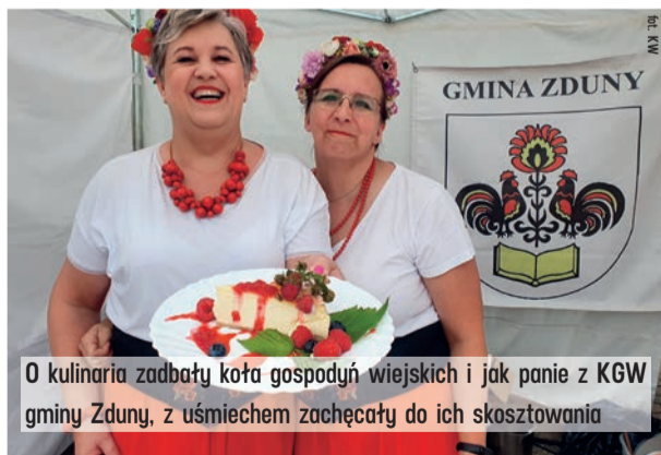
O kulinaria zadbały koła gospodyń wiejskich i jak panie z KGW gminy Zduny, z uśmiechem zachęcały do ich skosztowania

KGW Górczynianki (pow. łaski) - za tartę z konfiturą