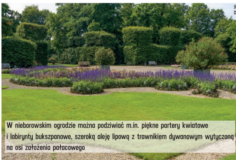
W nieborowskim ogrodzie można podziwiać m.in. piękne partery kwiatowe i labirynty bukszpanowe, szeroką aleję lipową z trawnikiem dywanowym wytyczoną na osi założenia pałacowego