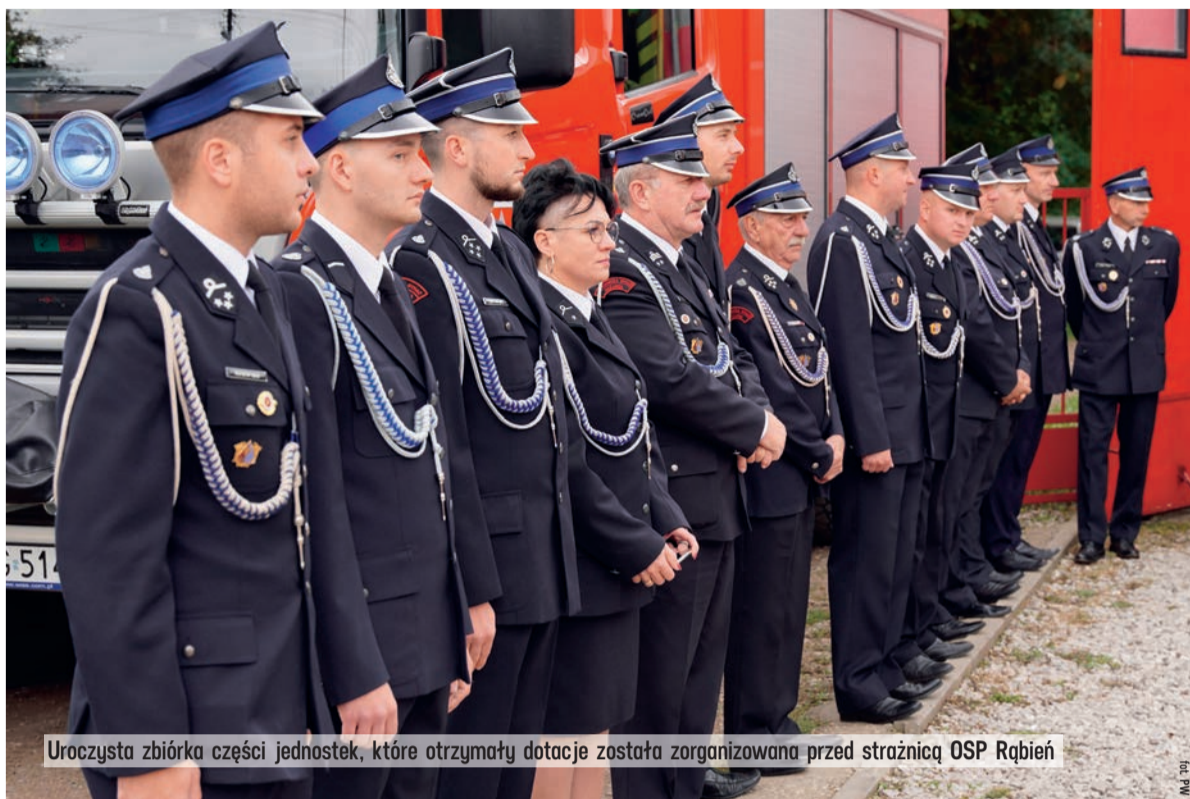
Uroczysta zbiórka części jednostek, które otrzymały dotacje została zorganizowana przed strażnicą OSP Rąbień