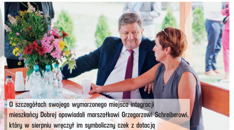
O szczegółach swojego wymarzonego miejsca integracji mieszkańcy Dobrej opowiadali marszałkowi Grzegorzowi Schreiberowi, który w sierpniu wręczył im symboliczny czek z dotacją