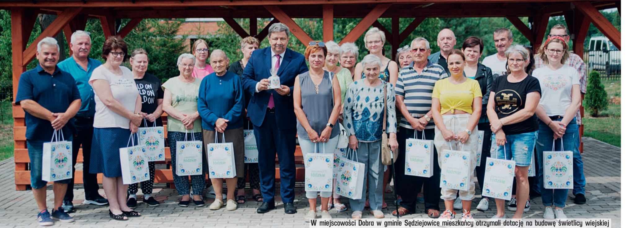
W miejscowości Dobra w gminie Sędziejowice mieszkańcy otrzymali dotację na budowę świetlicy wiejskiej

4 miliony złotych z tej puli zostały przeznaczone na nowy program wsparcia obszarów wiejskich - Infrastruktura Sołecka Plus.