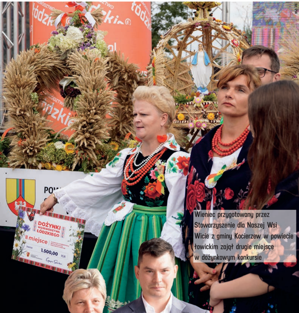
Wieniec przygotowany przez Stowarzyszenie dla Naszej Wsi Wicie z gminy Kocierzew w powiecie łowickim zajął drugie miejsce w dożynkowym konkursie