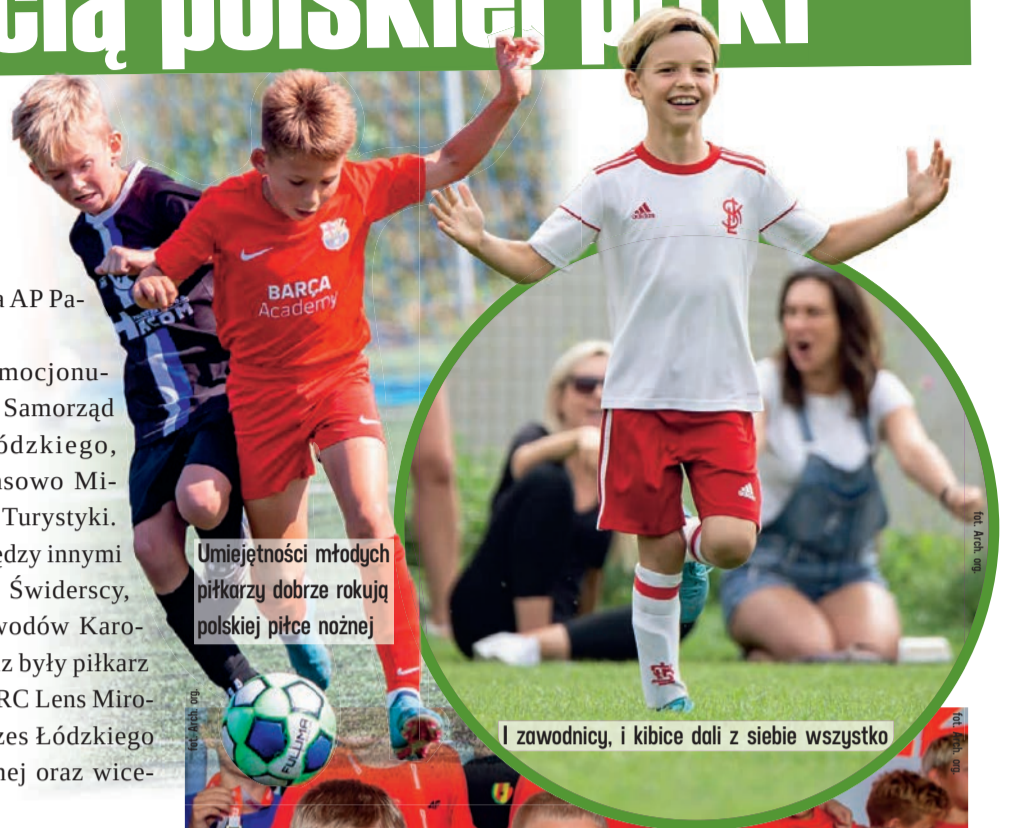
Umiejętności młodych piłkarzy dobrze rokują polskiej piłce nożnej