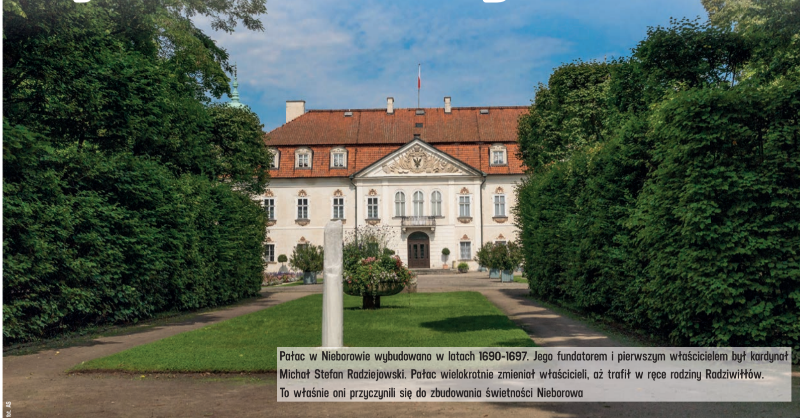
Pałac w Nieborowie wybudowano w latach 1690-1697. Jego fundatorem i pierwszym właścicielem był kardynał Michał Stefan Radziejowski. Pałac wielokrotnie zmieniał właścicieli, aż trafił w ręce rodziny Radziwiłłów. To właśnie oni przyczynili się do zbudowania świetności Nieborowa

Zespół pałacowo-ogrodowy w Nieborowie wraz z ogrodem sentymentalnym w pobliskiej Arkadii jako pierwsze w naszym województwie otrzymały specjalny certyfikat dla obszarów, które mają szczególne walory przyrodnicze lub krajobrazowe.