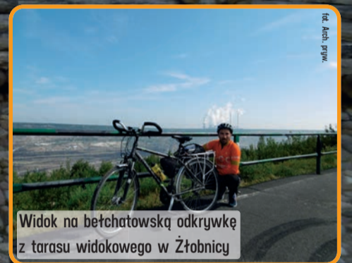
Widok na bełchatowską odkrywkę z tarasu widokowego w Żłobnicy