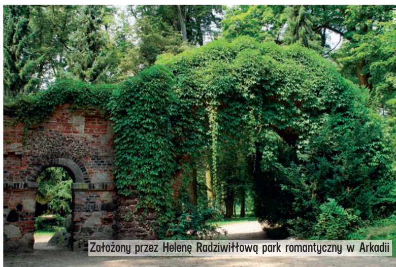
Założony przez Helenę Radziwiłłową park romantyczny w Arkadii