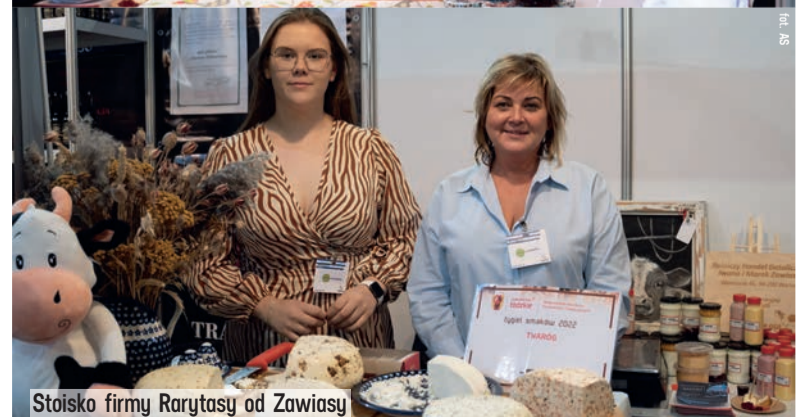
Stoisko firmy Rarytasy od Zawiasy