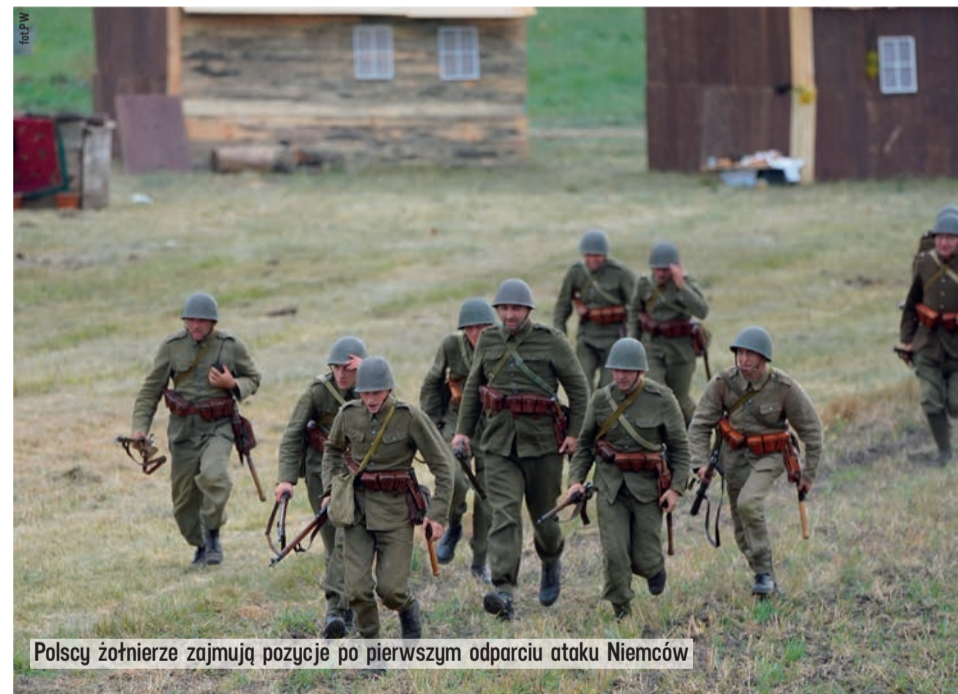
Polscy żołnierze zajmują pozycje po pierwszym odparciu ataku Niemców