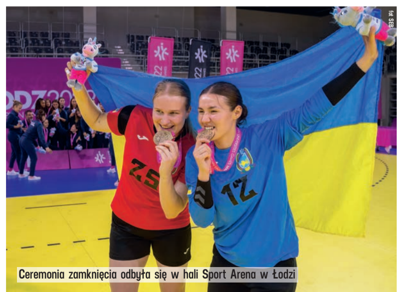
Ceremonia zamknięcia odbyła się w hali Sport Arena w Łodzi