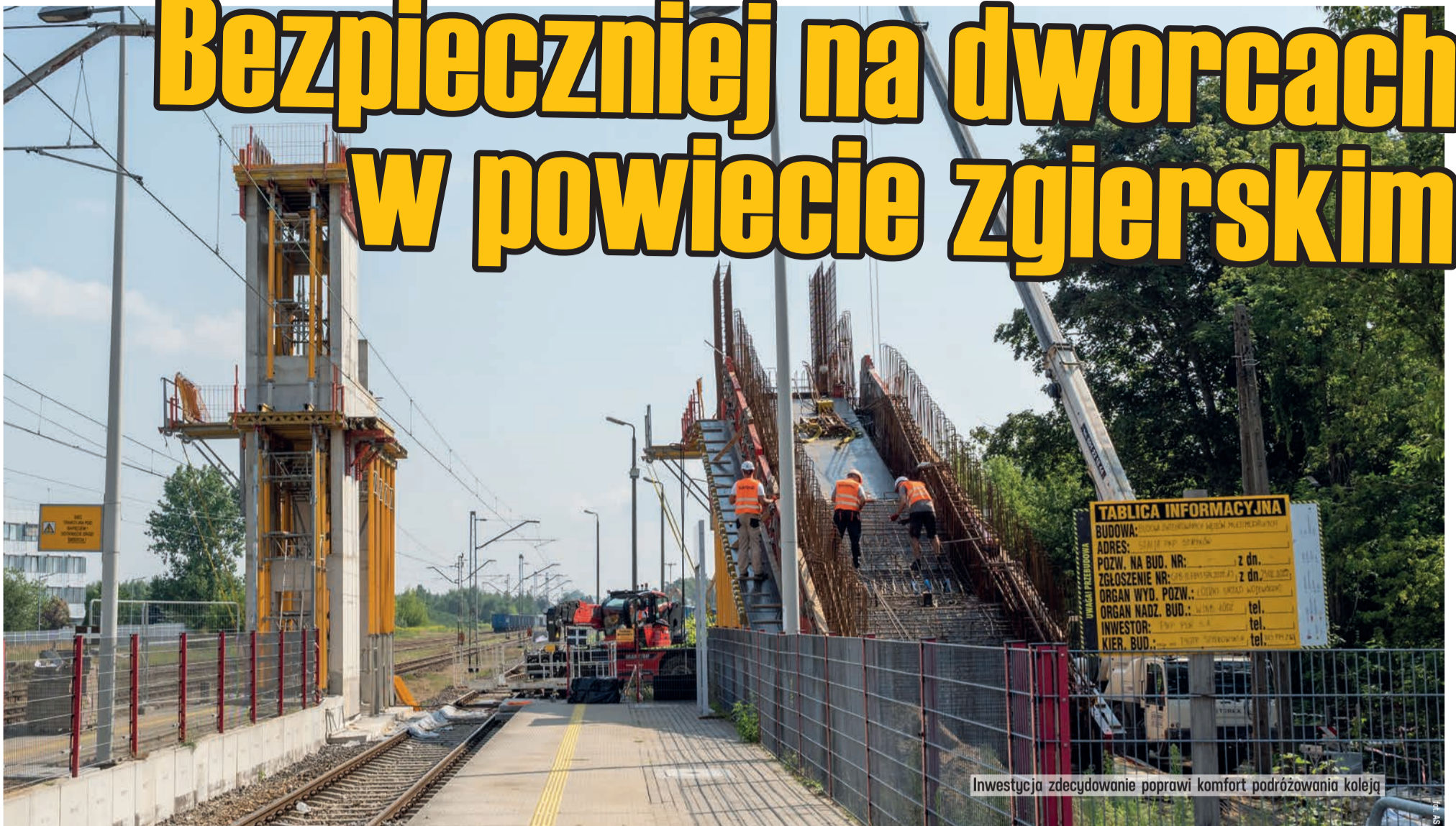
Investycja zdecydowanie poprawi komfort podróżowania koleją

Trwa budowa kładek nad torami na dworcach w Strykowie i Głownie. Inwestycję realizuje PKP PLK dzięki dofinansowaniu z Urzędu Marszałkowskiego Województwa Łódzkiego.