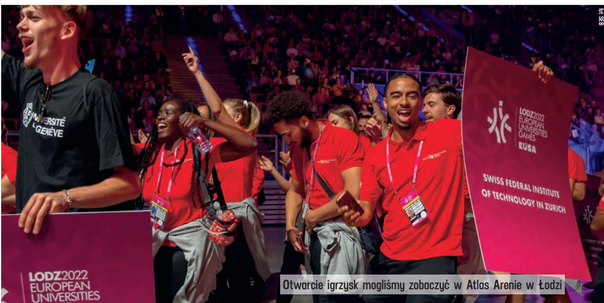
Otwarcie igrzysk mogliśmy zobaczyć w Atlas Arenie w Łodzi