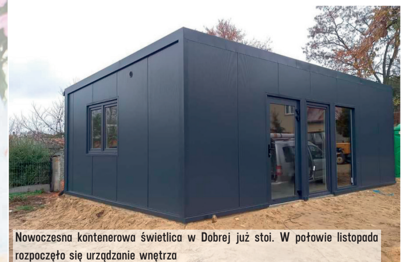
Nowoczesna kontenerowa świetlica w Dobrej już stoi. W połowie listopada rozpoczęło się urządzenie wnętrza