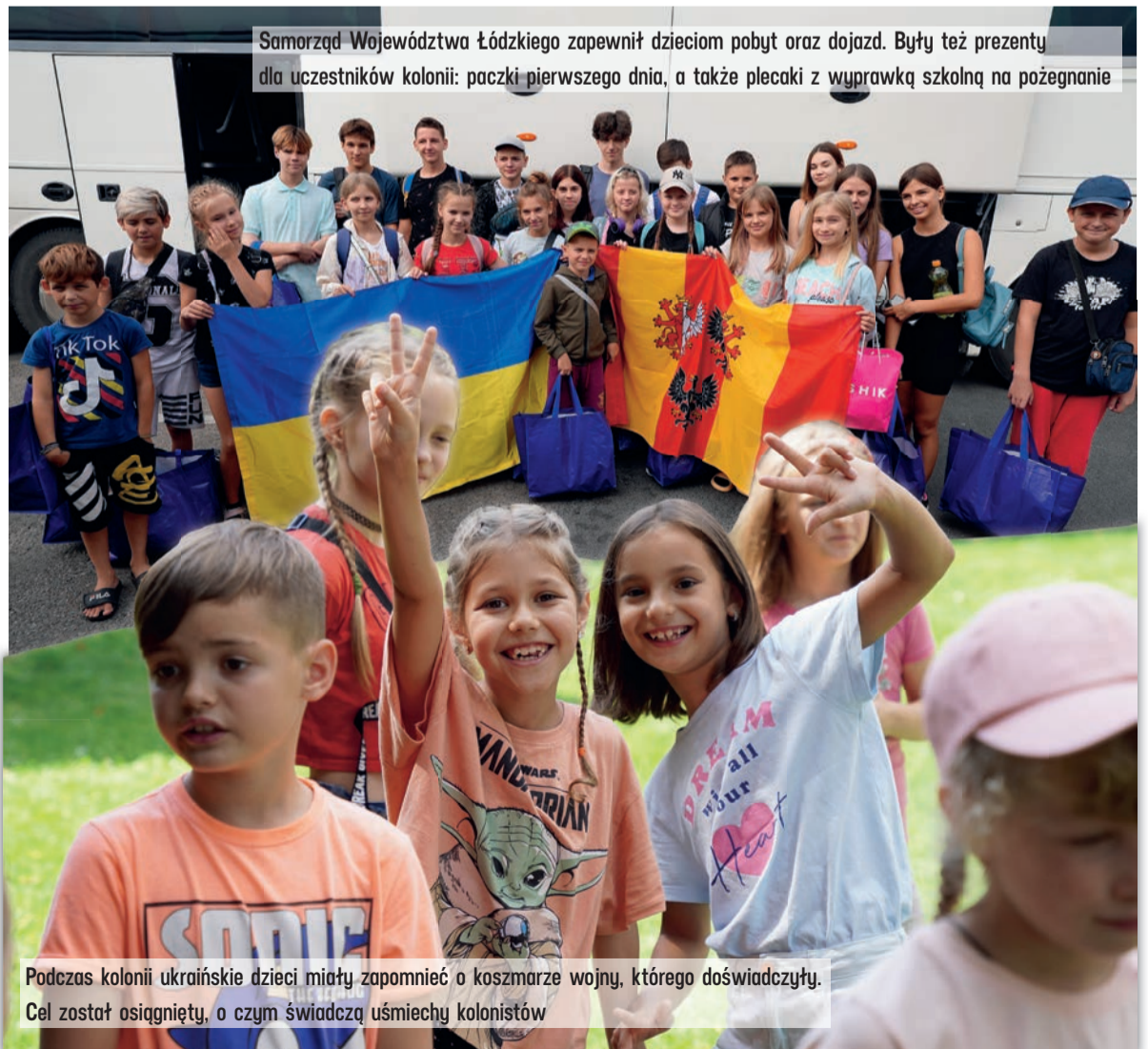
Samorząd Województwa Łódzkiego zapewnił dzieciom pobyt oraz dojazd. Były też prezenty dla uczestników kolonii: paczki pierwszego dnia, a także plecaki z wyprawką szkolną na pożegnanie