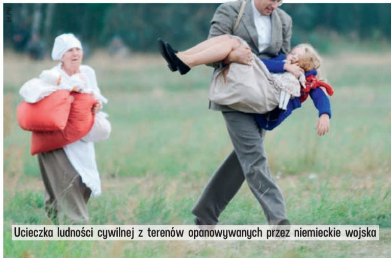
Ucieczka ludności cywilnej z terenów opanowywanych przez niemieckie wojska