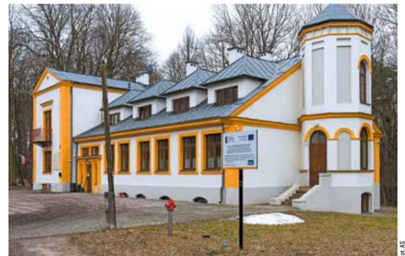
Dziś jest nie tylko ładny, ale też nowoczesny