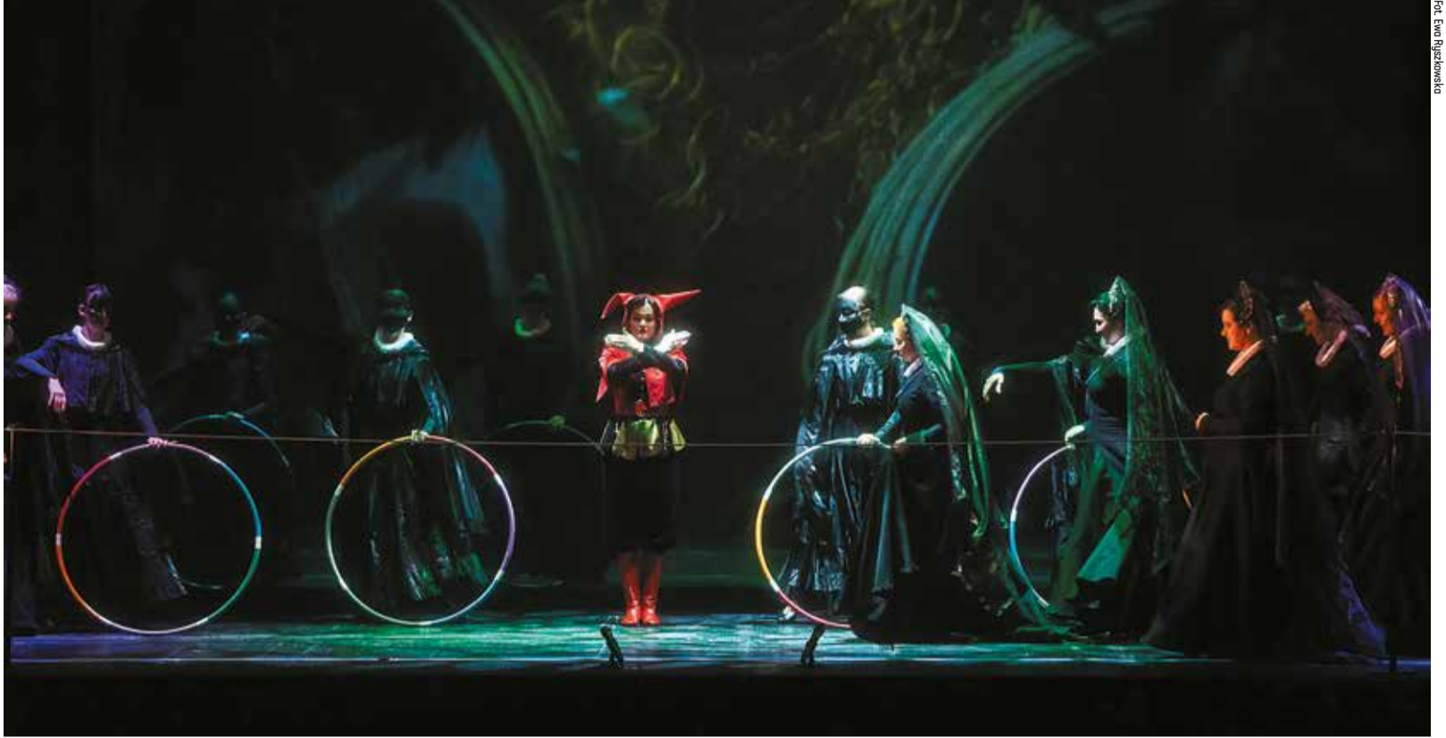
Fot. Ewa Ryszewska