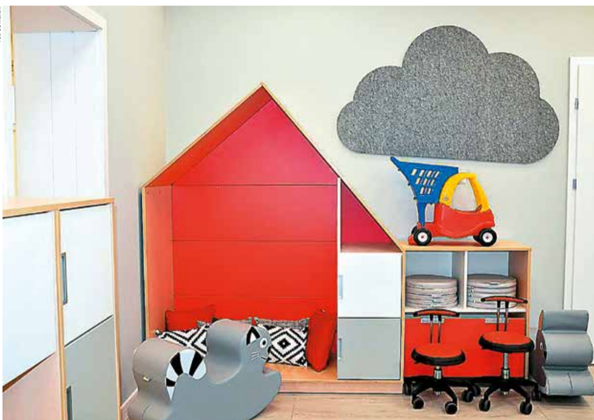
...przyjazny dla maluchów...