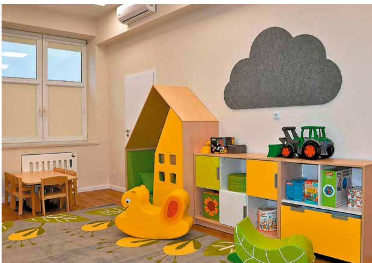
...i dobrze wyposażony