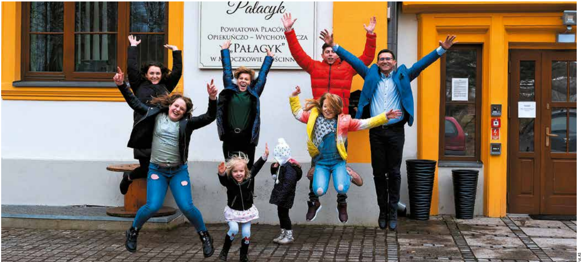
W Pałacyku dzieci czują się jak w rodzinnych domach