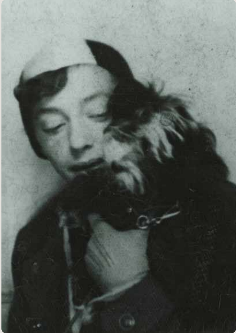
Katarzyna Kobro na początku lat 30. ubiegłego wieku

W lutym minęła 70. rocznica śmierci Katarzyny Kobro, awangardowej artystki związanej z naszym regionem, zasłużonej dla Łodzi.