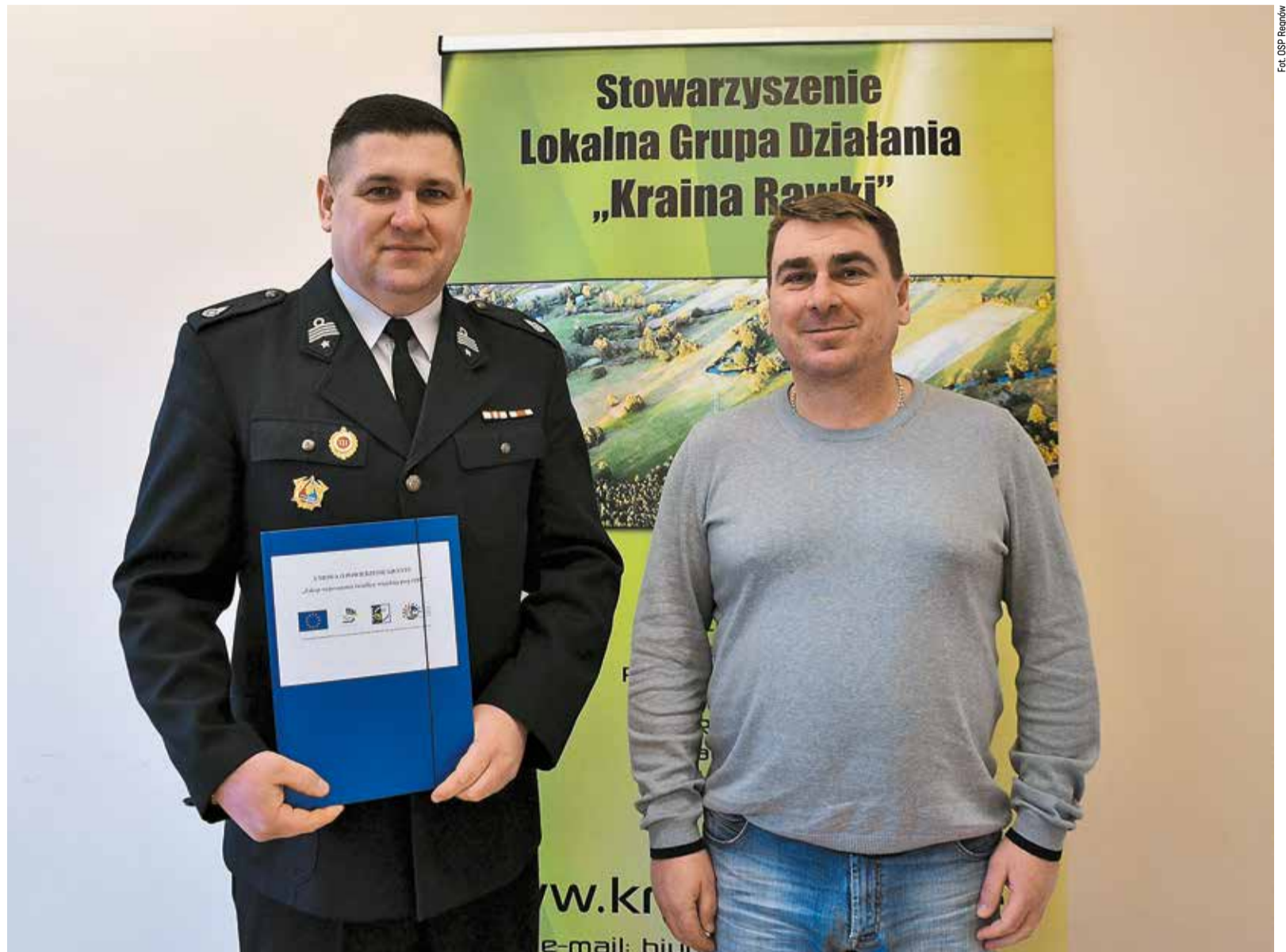
Strażacy z OSP w Bartnikach marzyli o nowym wyposażeniu do swojej świetlicy

– Budynek pochodzi z lat 70. Jest z białej cegły i wygląda brzydko. A wszystko dookoła pięknieje. Chcemy go otynkować i pomalować. Jak jest ładny dom, to każdy do niego