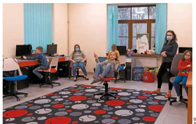
Jest tu sala komputerowa (na zdjęciu), świetlica i miejsce do ćwiczeń