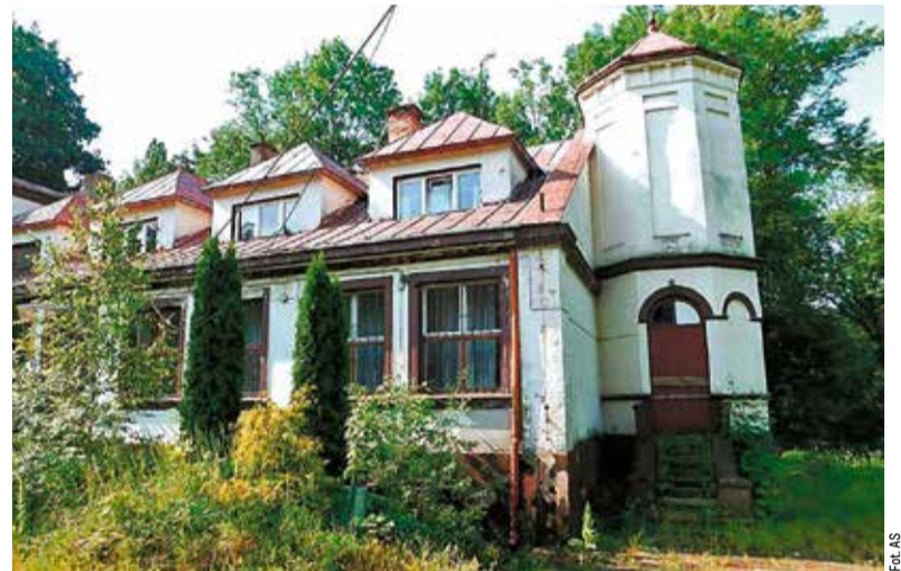
Wcześniej Pałacyk wyglądał, tak, że rozważana była jego rozbiórka