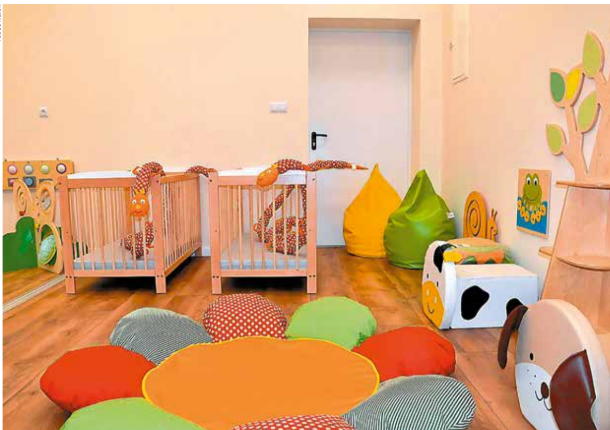
Żłobek jest bajecznie kolorowy...