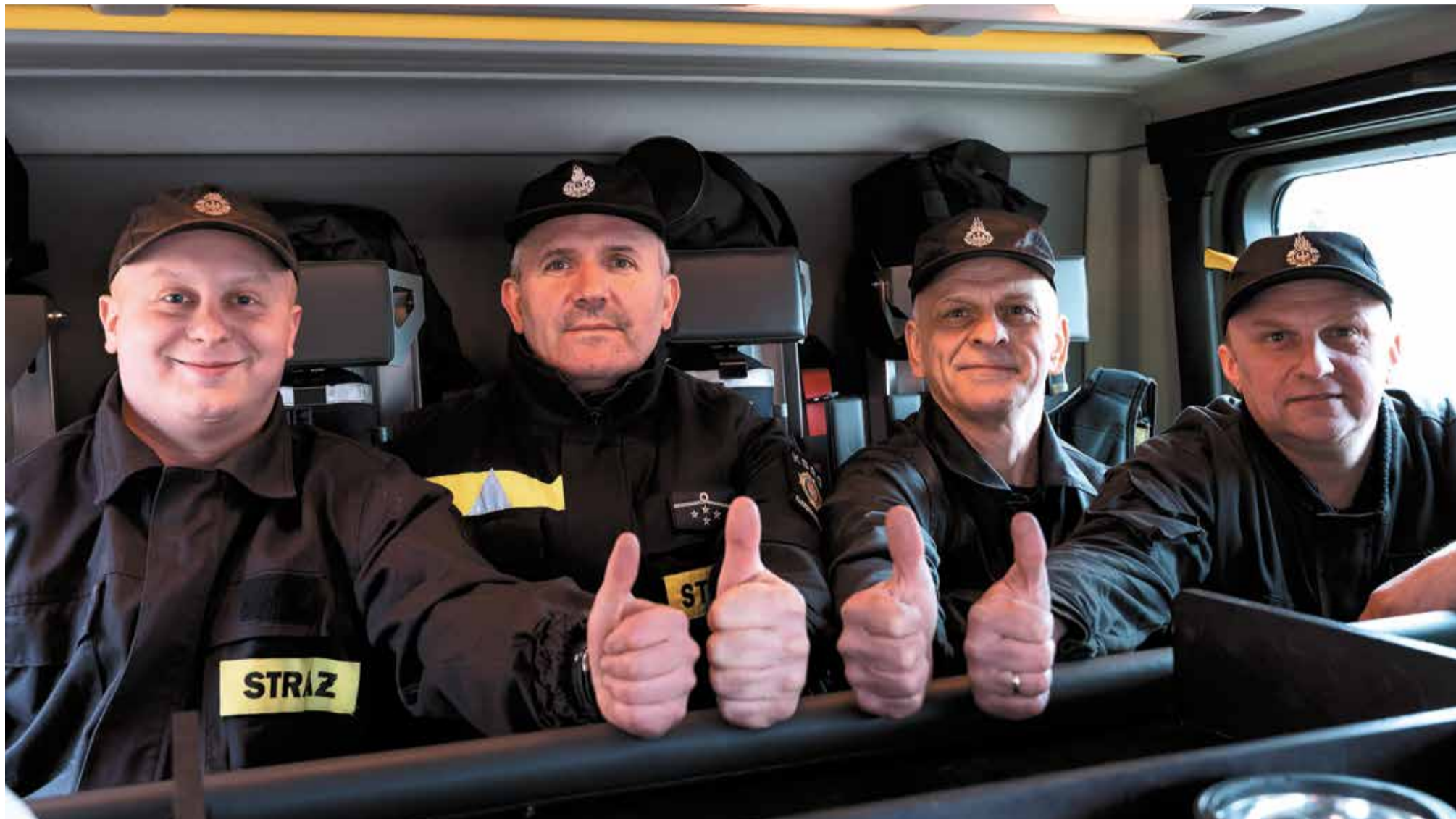
Strażacy OSP Czerniewice są zadowoleni ze swego nowego wozu

Niezawodny, wygodny, nowoczesny. Druhowie Ochotniczej Straży Pożarnej w Czerniewicach (powiat tomaszowski) nie wyobrażają już sobie akcji bez swojej scanii P450XT.