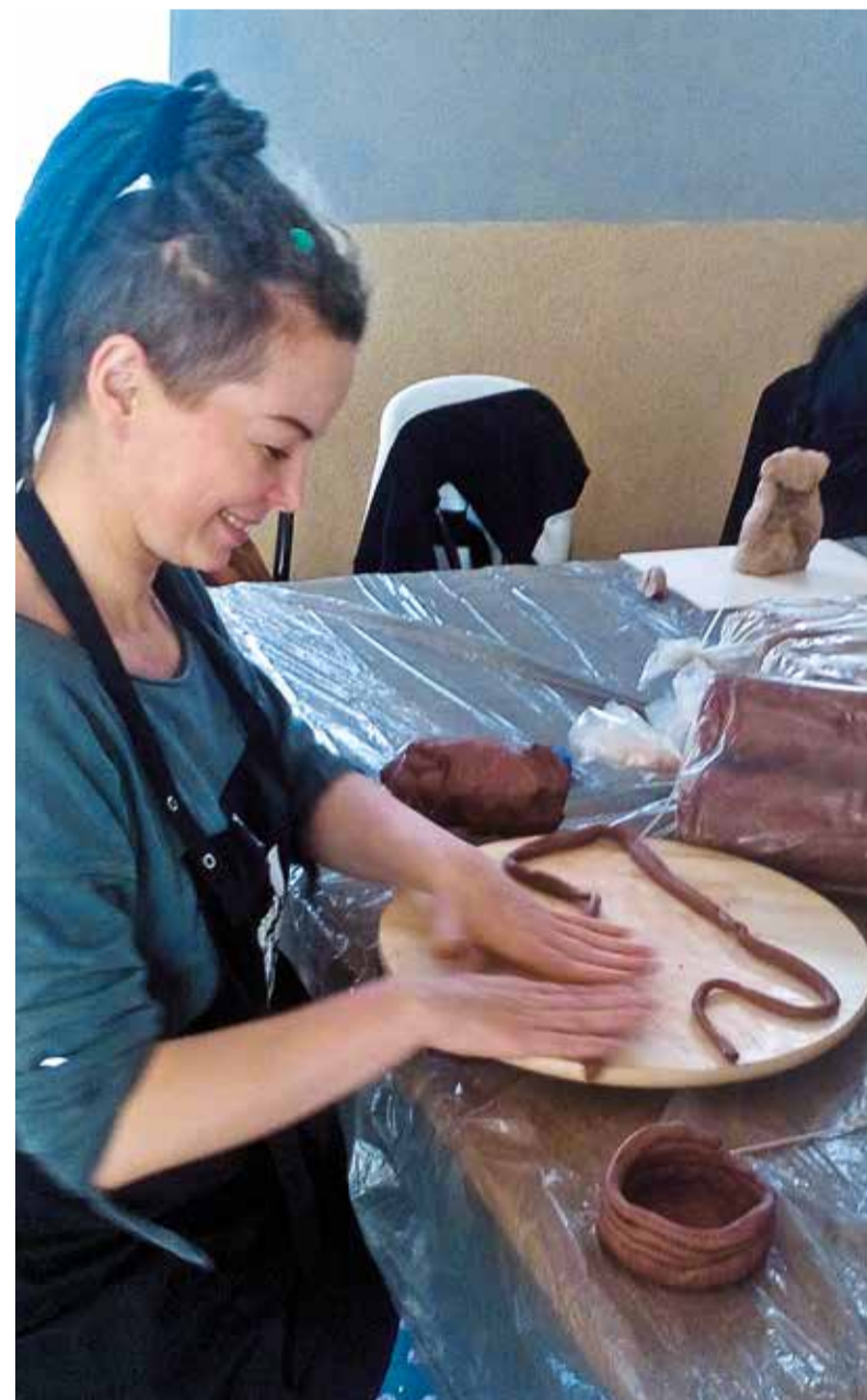
Dzięki grantom z Urzędu Marszałkowskiego udało się zorganizować cykl warsztatów