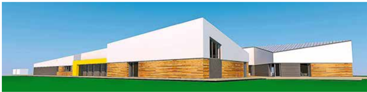
Tak będzie wyglądać nowe przedszkole

złotych. Przedszkole ma być gotowe pod koniec maja. Przedszkolaki po raz pierwszy spotkają się tu w nowym roku szkolnym.