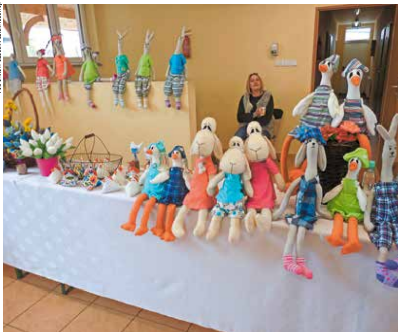
Przygotowane pyszności i rękodzieło panie prezentują podczas wielu imprez