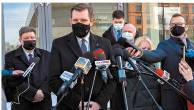
Szpital tymczasowy został otwarty 22 marca przez wojewodę Tobiasza Bocheńskiego oraz marszałka Grzegorza Schreibera

Przed świętami w szpitalu w hali Expo otwarte były już wszystkie moduły, czyli 272 łóżka. Decyzją