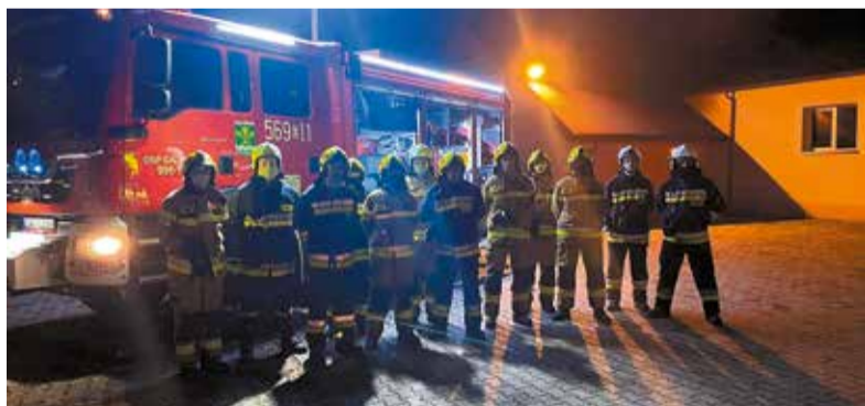
Nowy samochód dla OSP Galewice został kupiony dzięki wsparciu z Urzędu Marszałkowskiego

Starym wozem – marki MAN TGM 13.290, druhowie z Galewic jeździli cztery lata. Służył podczas