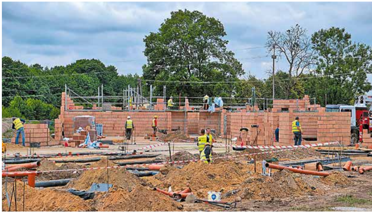
Budowa przedszkola ma się zakończyć pod koniec maja

Na budowę przedszkola w Sędziejowicach Urząd Marszałkowski przekazał dotację z Europejskiego Funduszu Rozwoju Regionalnego w ramach Regionalnego Programu Operacyjnego Województwa Łódzkiego na lata 2014–2020 w wysokości prawie 7 milionów złotych. Całkowita wartość projektu wyniesie ok. 12 milionów