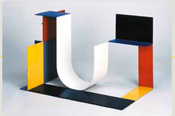
Kompozycja przestrzenna (4)

na kontraście bieli i błękitu oraz na sprzeczności form, które jednak zdają się dążyć do wzajemnego przenikania, harmonii, a w końcu – jedności.