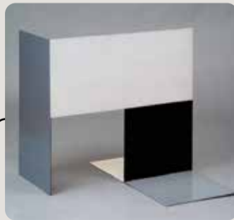
Kompozycja przestrzenna (2)

warstwy polichromii) poddana była konserwacji prawdopodobnie pod nadzorem autorki, w okresie przygotowań do otwarcia nowego gmachu muzeum w Łodzi (1948).