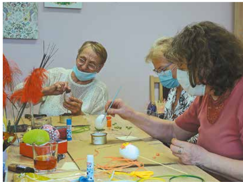
Można się też zrelaksować na przykład w fotelu masującym