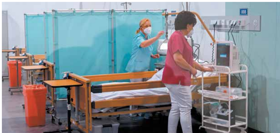
Wsparciem został objęty także szpital tymczasowy w hali Expo w Łodzi

– W ostatnich tygodniach posłowie i osoby reprezentujące opozycję głośno mówiły: po co ten szpital,