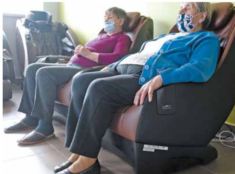
Zajęcia to świetna okazja, żeby wyjść z domu, nauczyć się nowych rzeczy, porozmawiać ze znajomymi