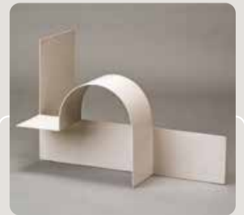
Kompozycja przestrzenna (3)

Chronologicznie druga, autorstwo datowana i tytułowana. W 1940 r. ocalona przez artystkę przed zniszczeniem i przekazana tuż po wojnie muzeum w Łodzi.