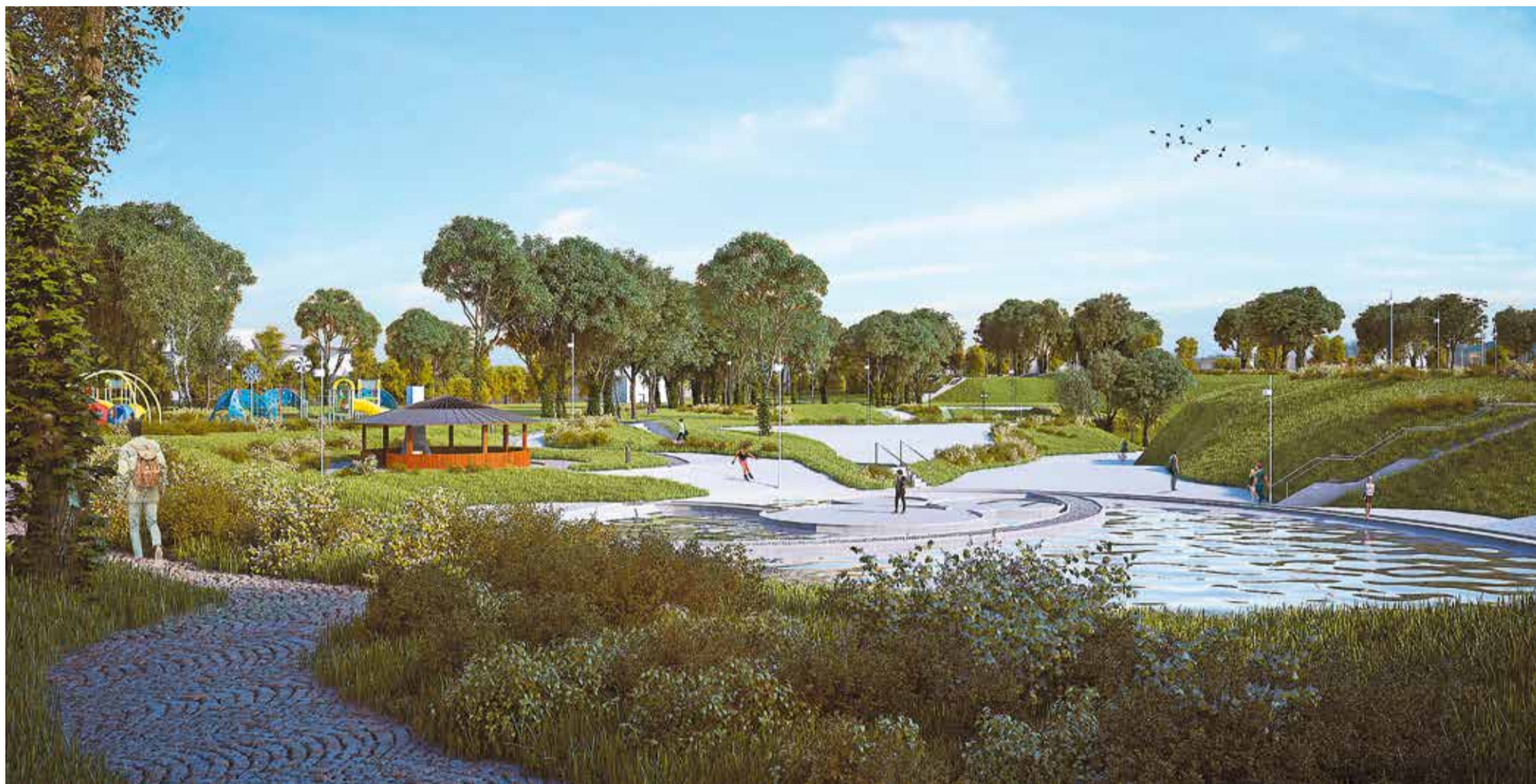
Tak będą wyglądać radomszczańskie glinianki

Amfiteatr, multimedialne fontanny, boiska, skatepark, sensoryczny plac zabaw, interaktywna szklana kładka. To tylko część atrakcji, które już za dwa lata będą do dyspozycji mieszkańców Radomska, odwiedzających glinianki.