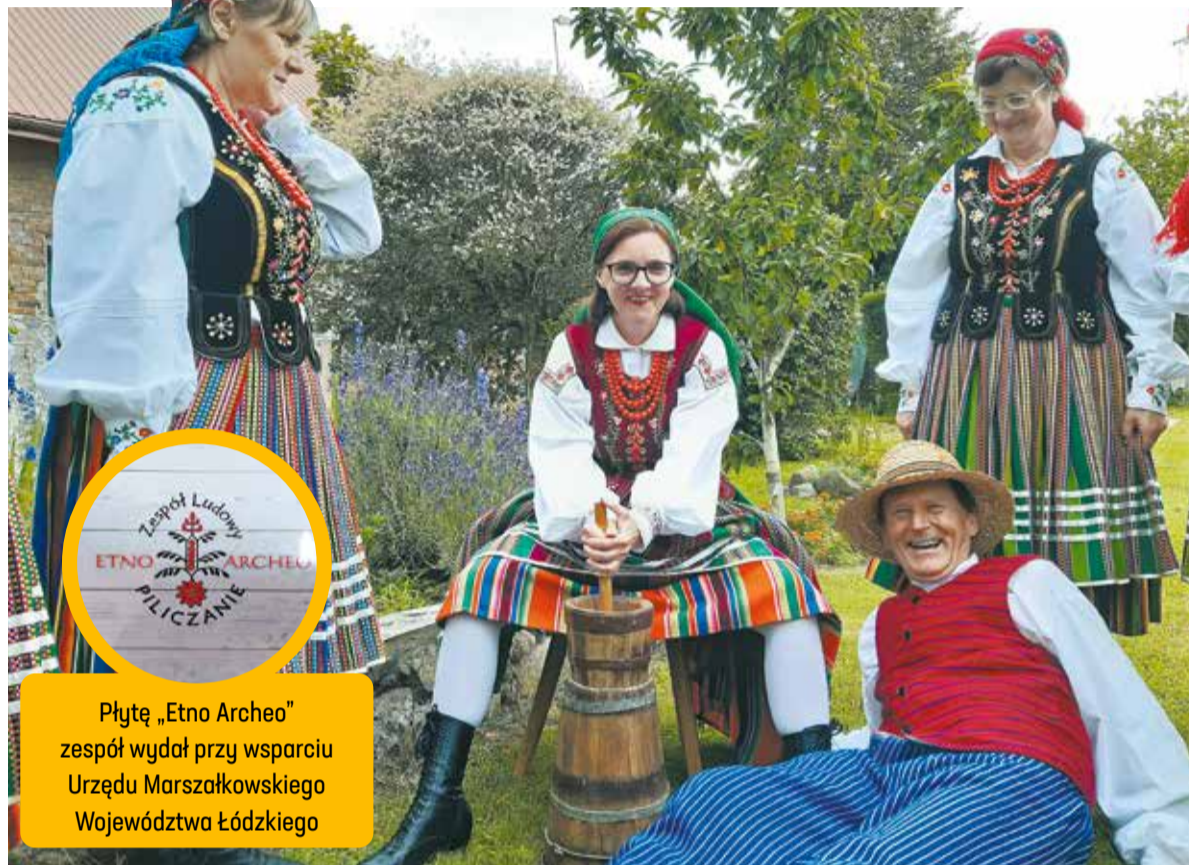
Płytę „Etno Archeo” zespół wydał przy wsparciu Urzędu Marszałkowskiego Województwa Łódzkiego

– Przypuszczamy, że piosenki zostały spisane w latach 50. i 60. XX