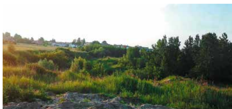
Tak ten teren wygląda dziś