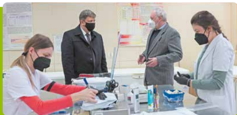
Centrum Bioróżnorodności Ogrodniczej odwiedził na początku marca marszałek Grzegorz Schreiber

Marszałek obejrzał przy okazji chłodnię doświadczalną Zakładu Przechowalnictwa i Przetwórstwa Owoców i Warzyw. Instytut Ogrodnictwa zmodernizuje ją przy udziale dofinansowania w wysokości 5,8 miliona zł, które Zarząd Województwa przyznał w ramach Regionalnego Programu Operacyjnego. „Laboratorium Fizjologii Pozbiorczej Produktów Ogrodniczych” będzie najnowocześniejszą w Polsce komórką badawczo-rozwojową. Inwestycje pozwolą na prowadzenie badań i kreowanie innowacji w dziedzinie technologii przechowywania.