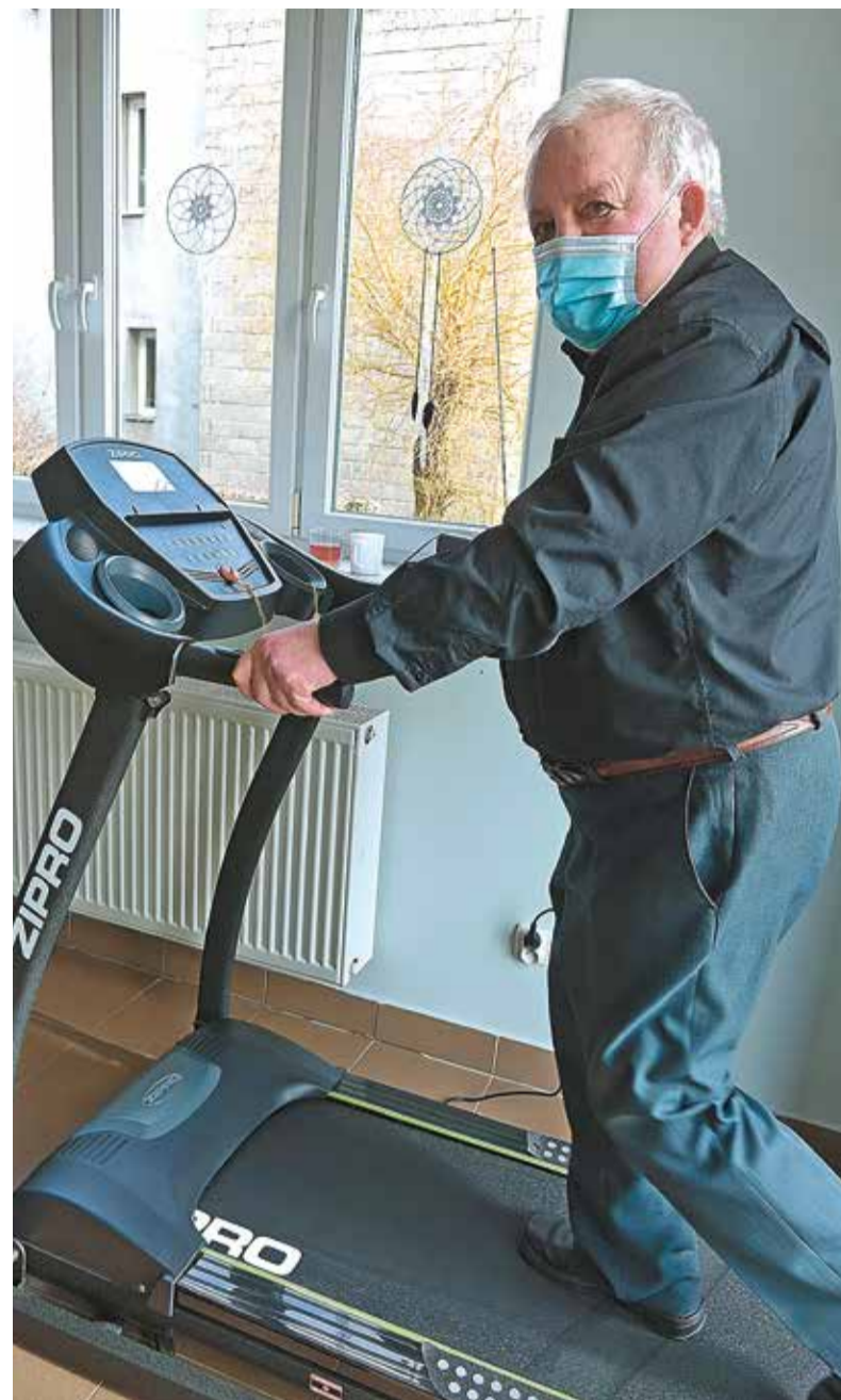
Największą popularnością cieszą się zajęcia z fizjoterapeutą i usprawniające