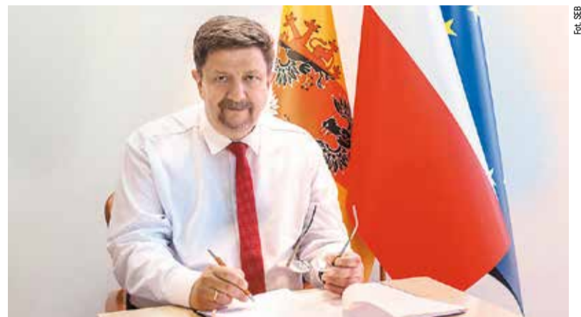
Umowę na dofinansowanie Księżego Młyna marszałek Grzegorz Schreiber podpisał pod koniec marca