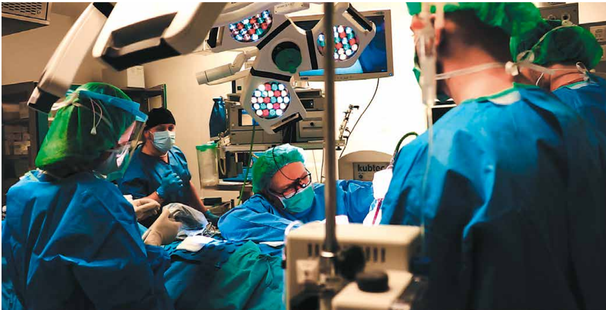
Operacja mikrozespolenia wymaga koncentracji i precyzji oraz specjalistycznych urządzeń

Dwie unikatowe operacje przeprowadzili lekarze Oddziału Chirurgii Onkologicznej Szpitala Kopernika w Łodzi. Jedna z nich polegała na operacji nowotworu metodą laparoskopową, druga - na skomplikowanym zespoleniu naczyń, które mają średnicę mniejszą niż milimetr!