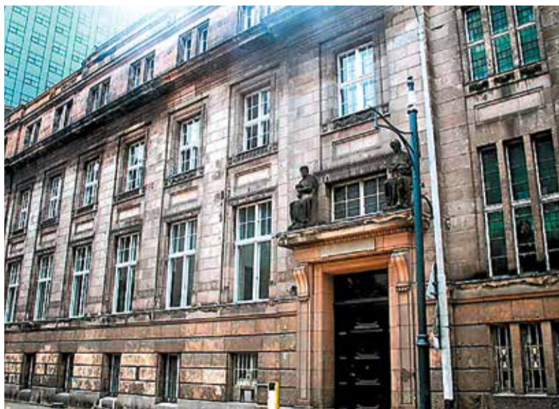
Tak dziś wygląda budynek przy ul. Roosevelta 15

Aż trudno uwierzyć, że w tej szarej kamienicy był kiedyś bank wzniesiony w latach 1910–1911 na zlecenie Towarzystwa Wzajemnego Kredytu Przemysłowców Łódzkich. Obiekt wybudowała łódzka firma „Wende i Klause” według planów architektonicznych Wilhelma Martensa, berlińskiego architekta, specjalizującego w obiektach w stylu wczesnomodernistycznym. Biuro architekta