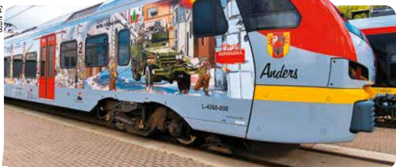
Grafika na pociągu przedstawia szlak bojowy 2. Korpusu Polskiego

Grafika na pociągu ŁKA przedstawia szlak bojowy 2. Korpusu Polskiego i bohaterskie czyny polskiego żołnierza w bitwach pod Monte Cassino, Ankoną i Bolonią. „Anders” to już trzeci historyczny pociąg Łódzkiej Kolei Aglomeracyjnej. Poprzednicy to „Pogonowski” i „Marszałek”. ■