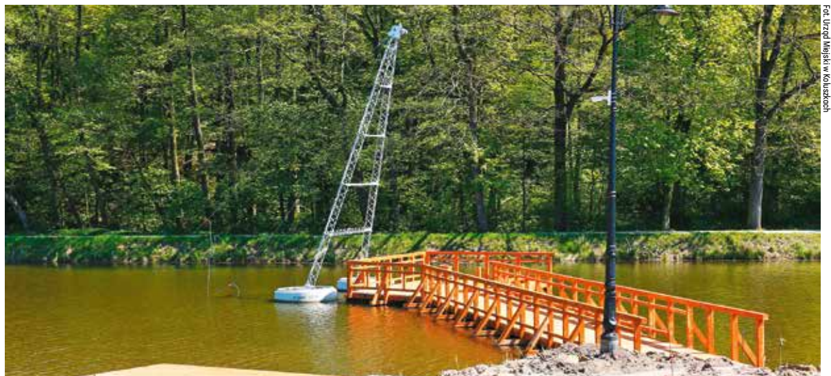
Jednym z atutów będzie tor do ślizgania się po wodzie na wakeboardach

no piaszczystą plażę, która ma 7 tysięcy metrów kwadratowych, kąpielisko oraz dwa baseny. Bezpieczeństwa turystów będzie strzegło 20 kamer monitoringu, a obraz z kilku na bieżąco będzie transmitowany w internecie.