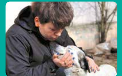
Jedna z nagrodzonych fotografii nadesłanych przez Łódzkie Towarzystwo Opieki nad Zwierzętami