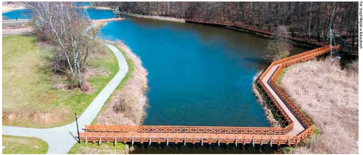
Kładka dla pieszych i rowerzystów przez rzekę Mrogę

Do tej pory wybudowane zostały alejki spacerowe i rowerowe. Powstały drewniane pomosty przez zalew oraz wzdłuż zalewu, kładka dla pieszych i rowerzystów przez rzekę Mrogę, wiaty na ogniska, prysznic. Oświetlona została linia brzegowa. Zrewitalizowany teren w Lisowicach będzie kuśm wkrótce turystów również parkiem linowym, torem dla amatorów ślizgania się po wodzie na wakeboardach. Zbudowane zostały budynek restauracji oraz gmach, który będzie stanowił zaplecze dla korzystających z wakeboardu. W tej chwili do użytku odda-