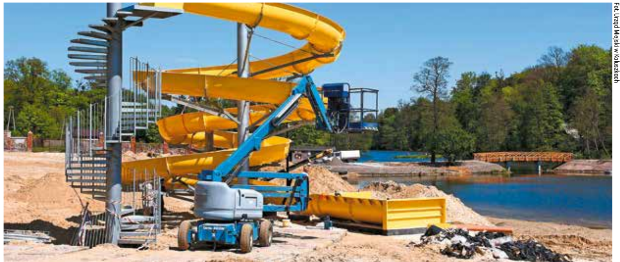
Lisowice oddalone są od Łodzi niespełna 30 km, od Koluszek niecałe 15 kilometrów