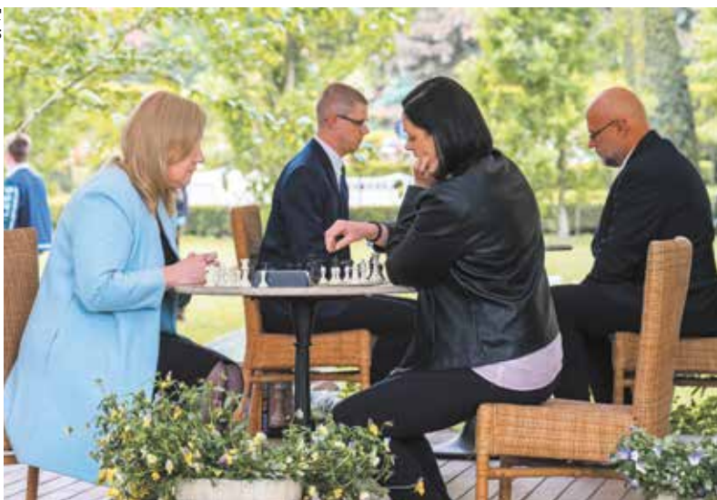
W turnieju szachowym, który był zwieńczeniem pierwszego etapu projektu, rywalizowali nauczyciele biorący udział w kursach