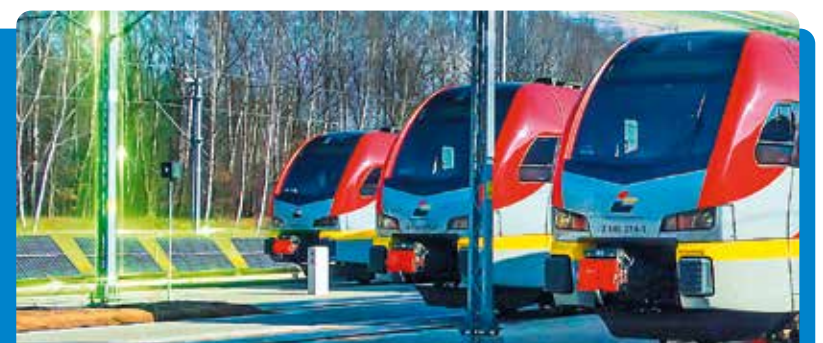
Łódzka Kolej Aglomeracyjna jest pierwszym przewoźnikiem pasażerskim, który zadeklarował aktywne dołączenie do procesu transformacji energetycznej kolei

– Udział Łódzkiej Kolei Aglomeracyjnej w programie Zielona Kolej świetnie wpisuje się w Strategię Rozwoju Województwa Łódzkiego 2030. I to w dwa istotne cele na najbliższe