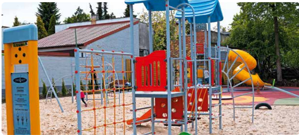
Plac zabaw w gminie Burzenin zbudowany z dotacją z poprzedniej edycji programu „Infrastruktura sportowa PLUS”

75 samorządów z naszego województwa otrzyma dotacje na budowę lub modernizację boisk, siłowni, placów zabaw. To pieniądze z programu Urzędu Marszałkowskiego „Infrastruktura sportowa PLUS”.