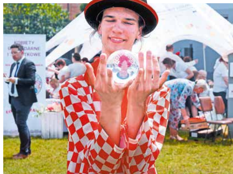
Pikniki potrwają jeszcze w sierpniu i we wrześniu

Popołudniami mieszkańcy bawią się na piknikach rodzinnych. Na straganach można dowiedzieć się wszystkiego o funduszach unijnych, ofercie Urzędu Marszałkowskiego i podległych mu teatrów, domu kultury, filharmonii, czy Wytwórni