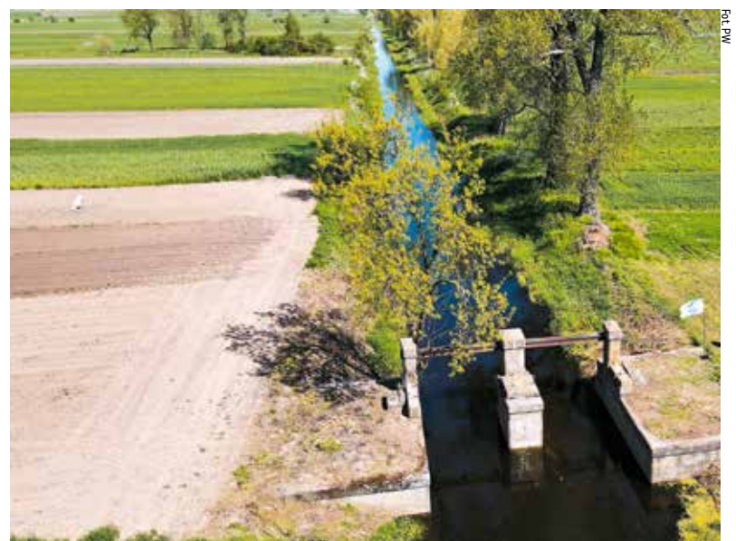
Jaz w miejscowości Złaków Borowy nie był remontowany od 1945 roku