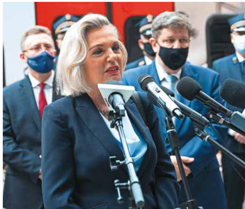
Gościem honorowym uroczystości była Anna Maria Anders, ambasador RP we Włoszech, córka generała Andersa

W tym roku przypada 80. rocznica powstania Armii Polskiej w Związku Sowieckim pod dowództwem gen. Władysława Andersa. To dzięki jego determinacji było możliwe stworzenie armii, wyszkolenie jej i przygotowanie do działań u boku