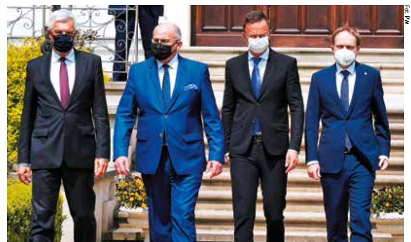
Gospodarzem spotkania był Zbigniew Rau, minister spraw zagranicznych (drugi z lewej)