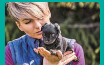
Nagrodzone zdjęcie nadesłane przez Stowarzyszenie Animal SOS z Aleksandrowa Łódzkiego