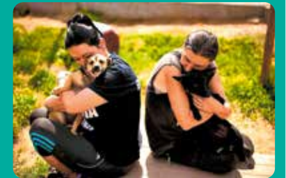
Nagrodzone zdjęcie nadesłane przez Towarzystwo Przyjaciół Zwierząt „ARKADIA” z Głowna