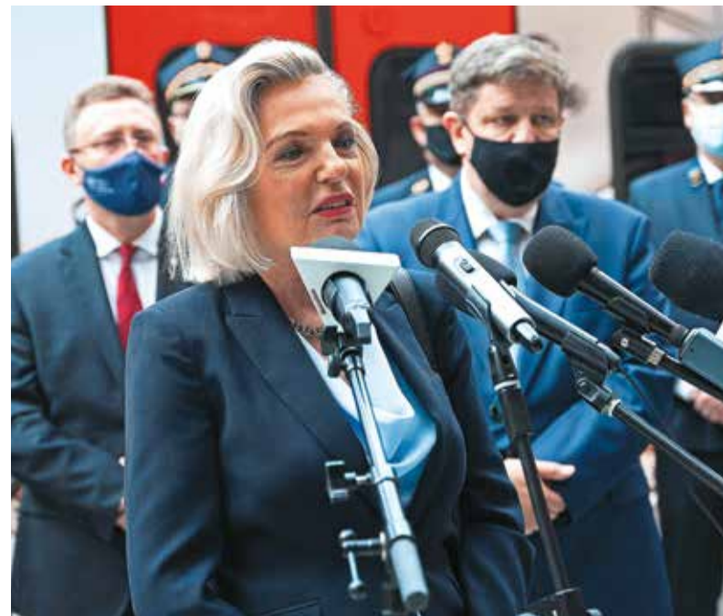
Gościem honorowym uroczystości była Anna Maria Anders, ambasador RP we Włoszech, córka generała Andersa

W tym roku przypada 80. rocznica powstania Armii Polskiej w Związku Sowieckim pod dowództwem gen. Władysława Andersa. To dzięki jego determinacji było możliwe stworzenie armii, wyszkolenie jej i przygotowanie do działań u boku