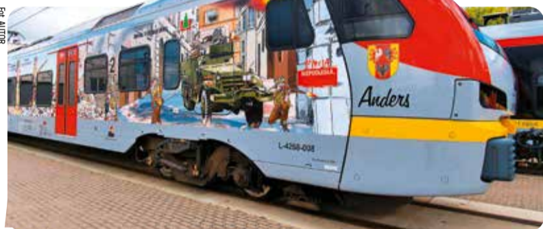
Grafika na pociągu przedstawia szlak bojowy 2. Korpusu Polskiego

Grafika na pociągu ŁKA przedstawia szlak bojowy 2. Korpusu Polskiego i bohaterskie czyny polskiego żołnierza w bitwach pod Monte Cassino, Ankoną i Bolonią. „Anders” to już trzeci historyczny pociąg Łódzkiej Kolei Aglomeracyjnej. Poprzednicy to „Pogonowski” i „Marszałek”. ■