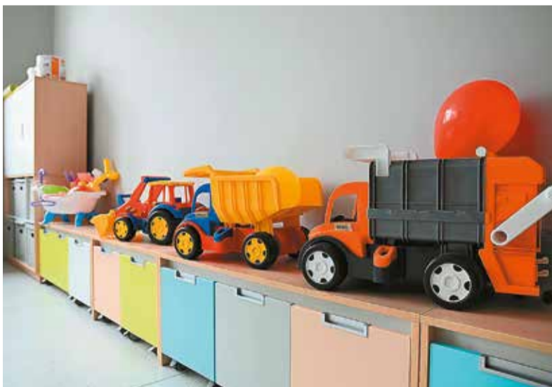
Żłobek jest kolorowy i dobrze wyposażony