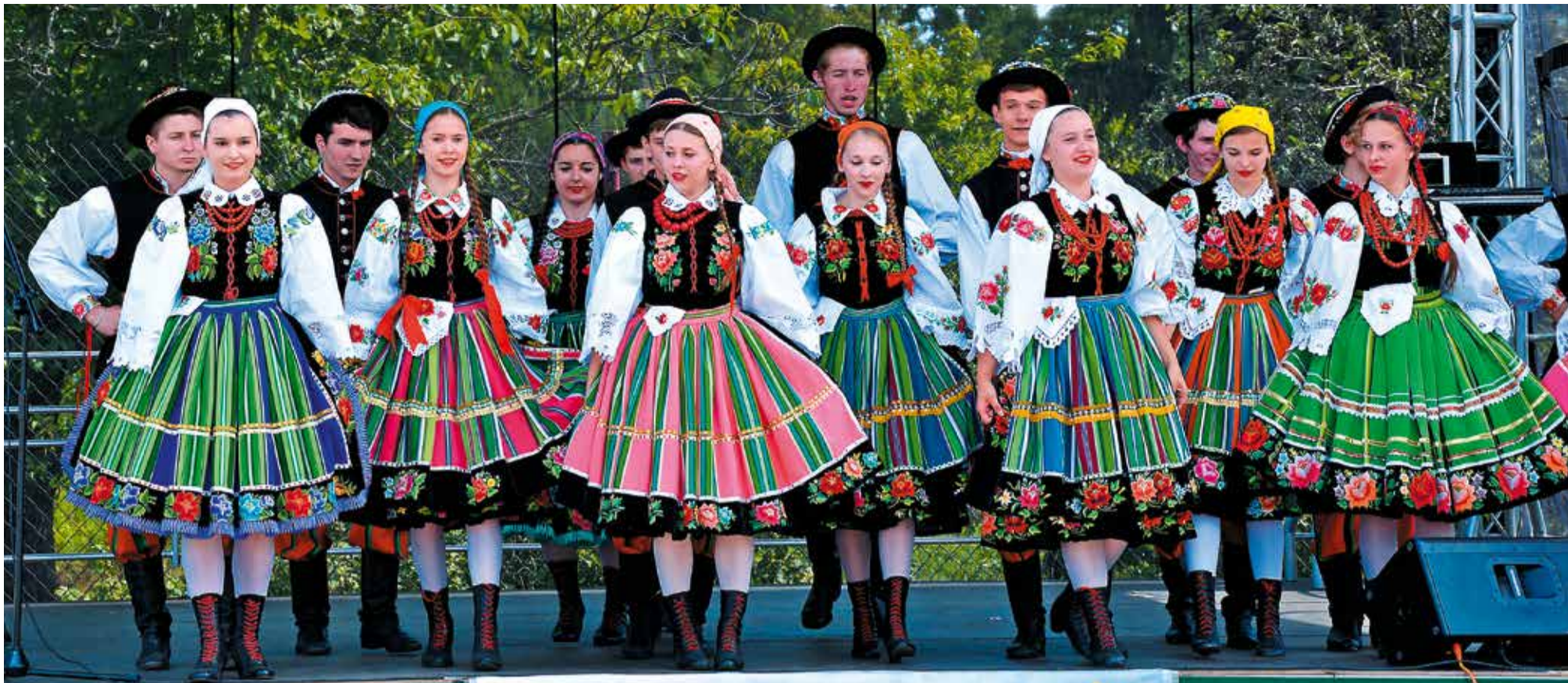
Spichlerz stanie się bazą edukacji kulturalnej młodzieży. Ma też służyć jako siedziba Zespołu Pieśni i Tańca „Blichowiaczy”