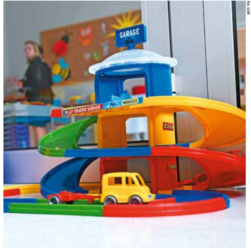
Zabawki powinny podobać się dzieciom