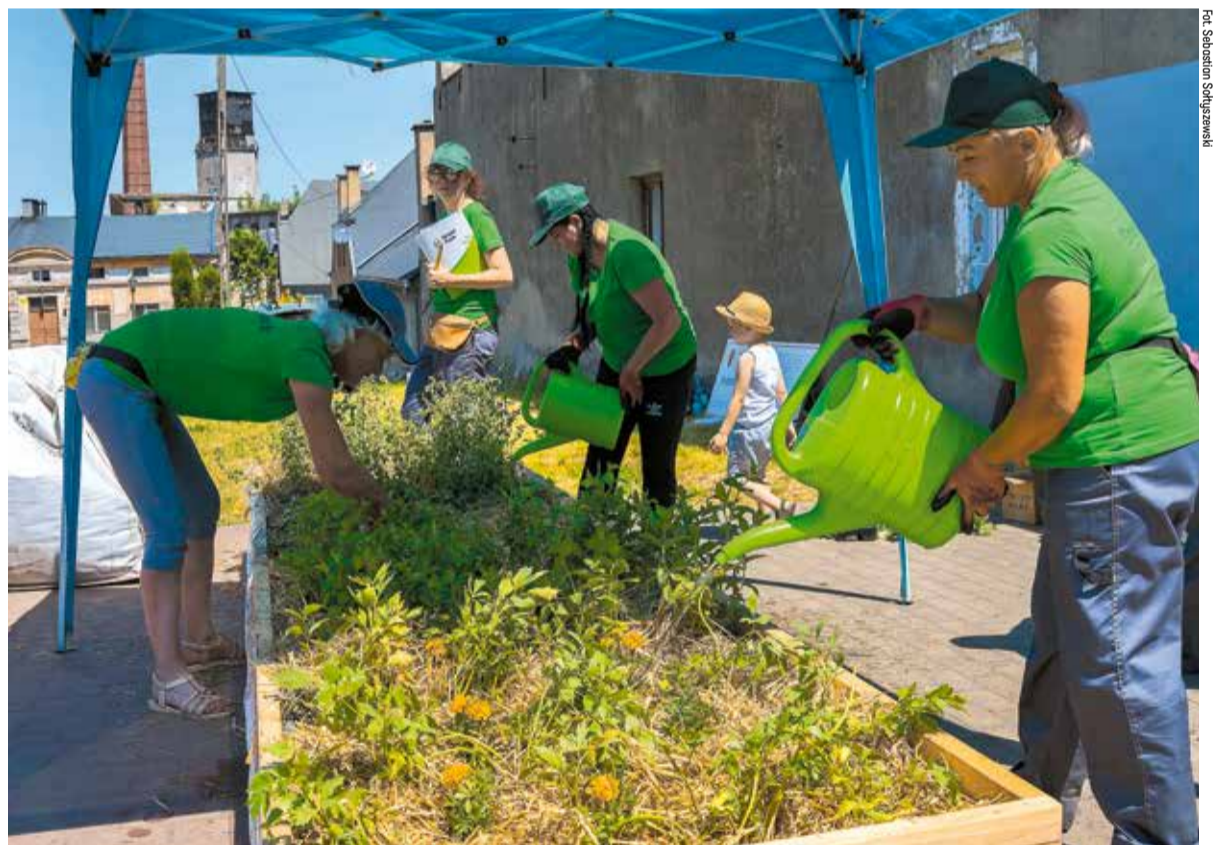
■ Rośliny zostały zasadzone w pięciu skrzyniach na terenie Parku Kulturowego Miasto Tkaczy