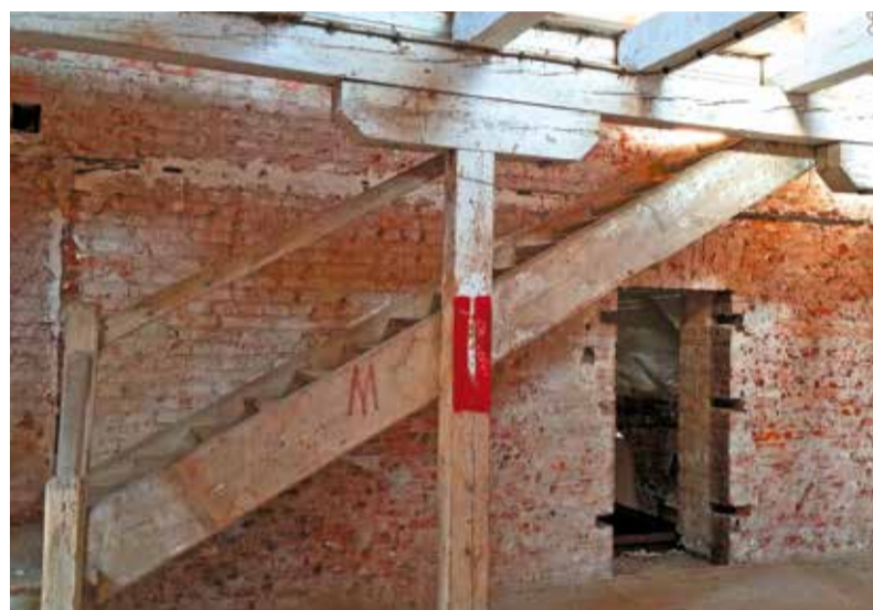
Wnętrze spichlerza podczas prac

W tym roku powiat łowicki planuje wykonanie elewacji budynku. ■