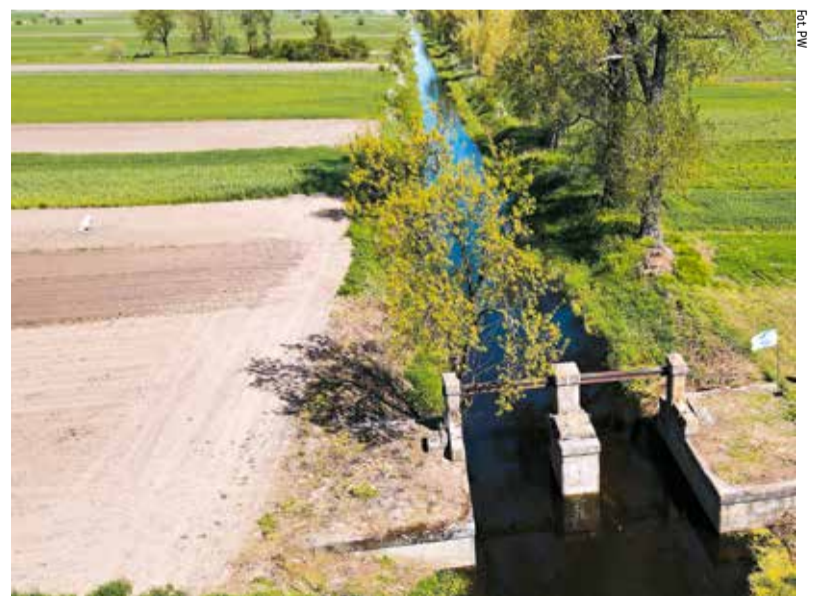
Jaz w miejscowości Złaków Borowy nie był remontowany od 1945 roku