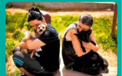
Nagrodzone zdjęcie nadesłane przez Towarzystwo Przyjaciół Zwierząt „ARKADIA” z Głowna