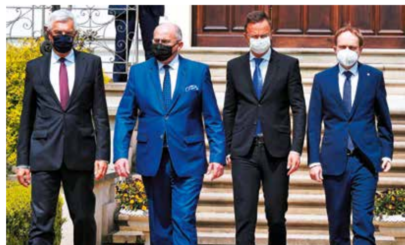
Gospodarzem spotkania był Zbigniew Rau, minister spraw zagranicznych (drugi z lewej)