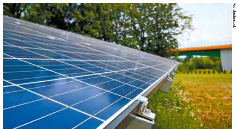
Na realizację projektu gmina otrzymała 2 mln zł z Regionalnego Programu Operacyjnego Wł