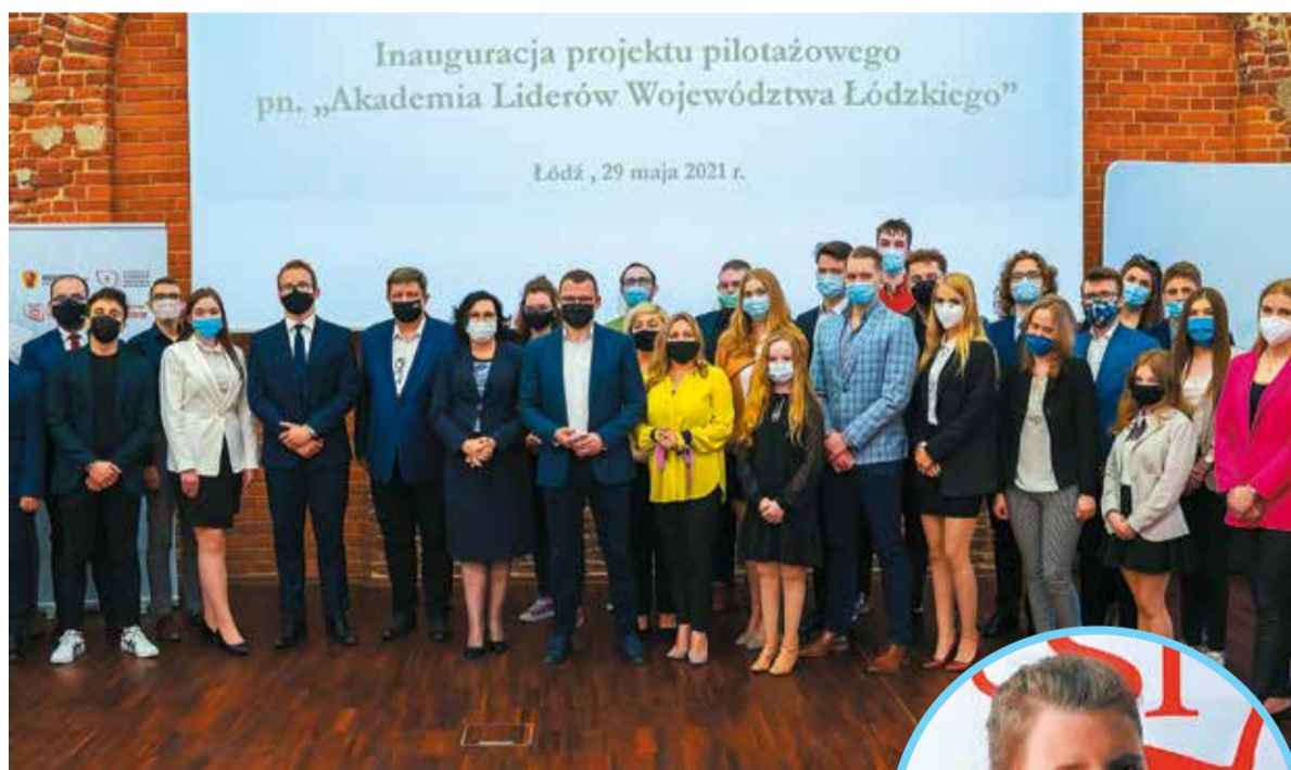
Akademia Liderów rozpoczęła działalność 29 maja

– Cieszę się z takich inicjatyw tym bardziej, że jesteśmy w okresie niezwykle ważnym dla przyszłości naszych małych ojczyzn i całego kraju – mówił minister Paweł Szefernaker. – W tym gronie są zapewne przyszli radni, burmistrzowie, wójtowie, pre-