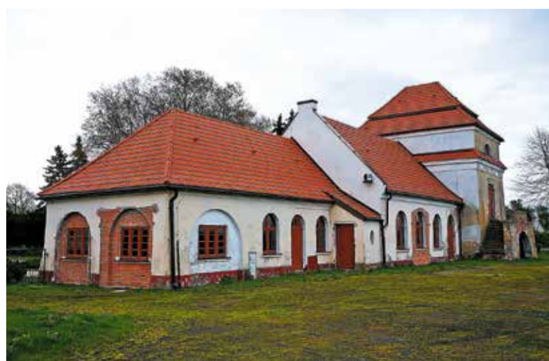
Budynek spichlerza stanowi przykład zabudowy pofolwarcznej