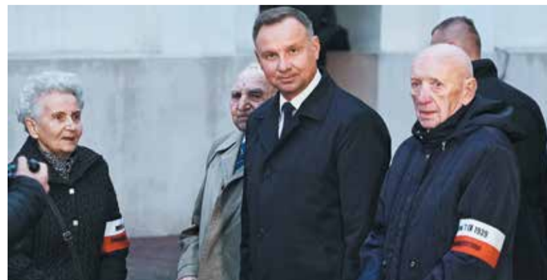
Prezydent Andrzej Duda przyjechał na wieluńskie uroczystości po raz trzeci. Hołd ofiarom napaści na miasto oddali wraz z nim świadkowie bombardowania Wielunia