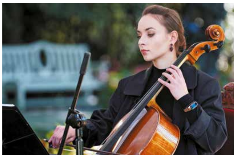
Czytającym towarzyszył kwartet smyczkowy Filharmonii Łódzkiej

Rubinsteina, a także tancerze Teatru Wielkiego w Łodzi.