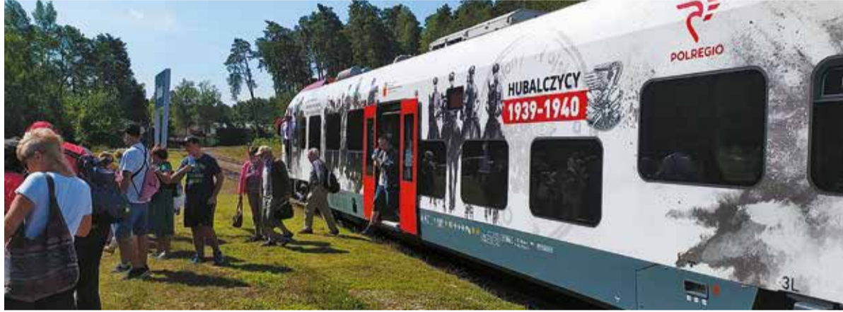
Pierwsze cztery wycieczki odbywały się pociągami Łódzkiej Kolei Aglomeracyjnej

Spacer po malowniczej ścieżce edukacyjnej Spalskiego Parku Krajobrazowego zakończyła wizyta w Spale i zwiedzanie oranżerii carcy (obecnie hotel „Rezydencja Spalska”), powozowni oraz hotelu „Savoy”, rezydencji prezydentów II Rzeczypospolitej, gdzie mieszkali m.in. prezydent Igna-