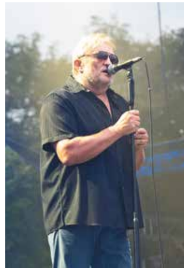
Muzycznymi gwiazdami święta plonów byli: Krzysztof Cugowski...