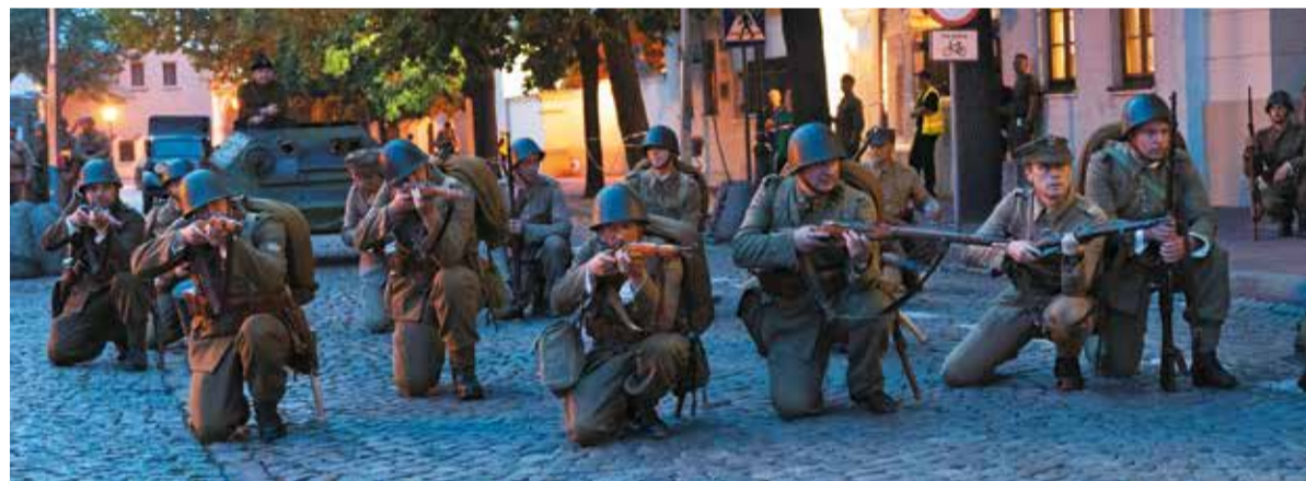
Polskie oddziały szykują się do odparcia wroga atakującego Łowicz