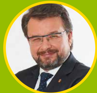
PIOTR ADAMCZYK, WICEMARSZAŁEK WOJEWÓDZTWA ŁÓDZKIEGO I RADNY SEJMIKU:

– Dzięki programowi z tej ważnej formy pomocy skorzysta blisko trzy tysiące mieszkańców województwa. Lekarze zadbają między innymi o poprawę kondycji pacjentów, o zmniejszenie poziomu duszności i przewlekłego zmęczenia, a także będą walczyć z lękami i zaburzeniami nastroju, na które bardzo często narzekają pacjenci, którzy przeszli COVID-19.