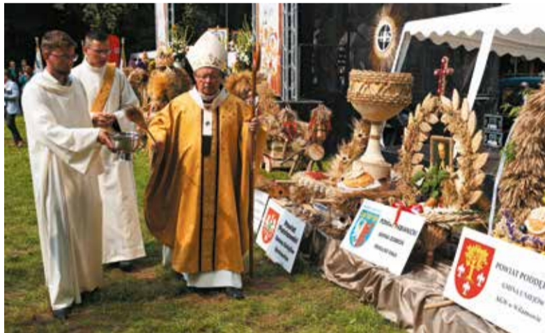
Wojewódzkie święto plonów rozpoczęło się mszą świętą, której przewodniczył ksiądz arcybiskup Grzegorz Ryś