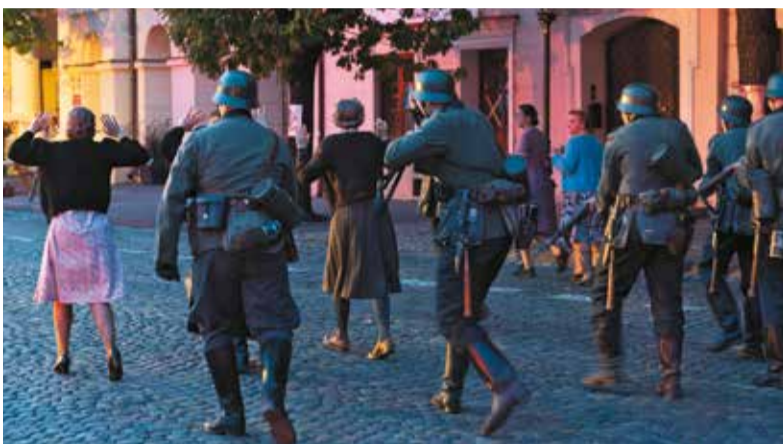
Niemieckie wojsko prowadzi przed atakiem na polskie oddziały cywilów w charakterze żywych tarcz. Do takiego wydarzenia faktycznie doszło podczas walk o Łowicz