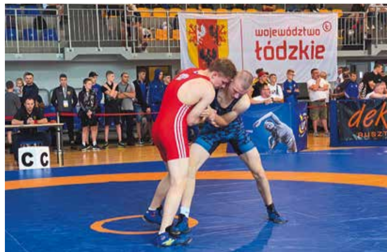
Sportowcy rywalizowali w kilkudziesięciu dyscyplinach, m.in. w zapasach...

– Ta prestiżowa impreza jest przedsmakiem występów na wielkich arenach sportowych całego świata