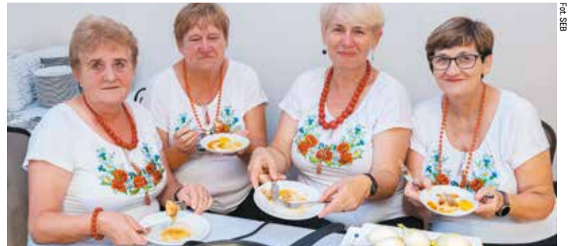
W Zgierzu uczyliśmy się przyrządzać pieczony comber z królika z jabłkiem

We wrześniu podczas kolejnych spotkań, organizowanych w różnych