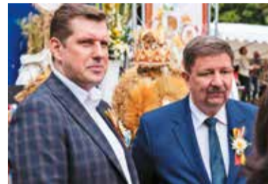
Wśród gości dożynek był wojewoda łódzki Tobiasz Bocheński