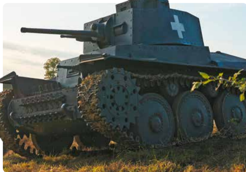
Kontratakujący polscy żołnierze byli ostrzeliwani z czołgu