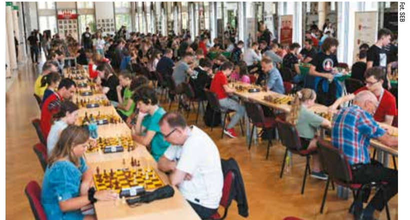
Na turniej do Łodzi przyjechało 311 szachistów