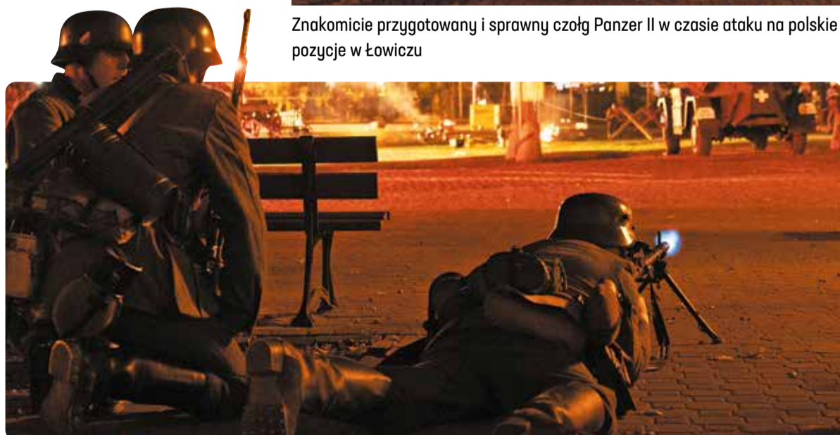
Widowiskowy atak Niemców na polskie pozycje. Na pierwszym planie żołnierz strzela z ciężkiego karabinku maszynowego