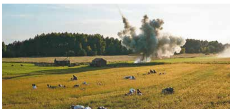
Ludność cywilna ucieka z bombardowanej przez Niemców wsi