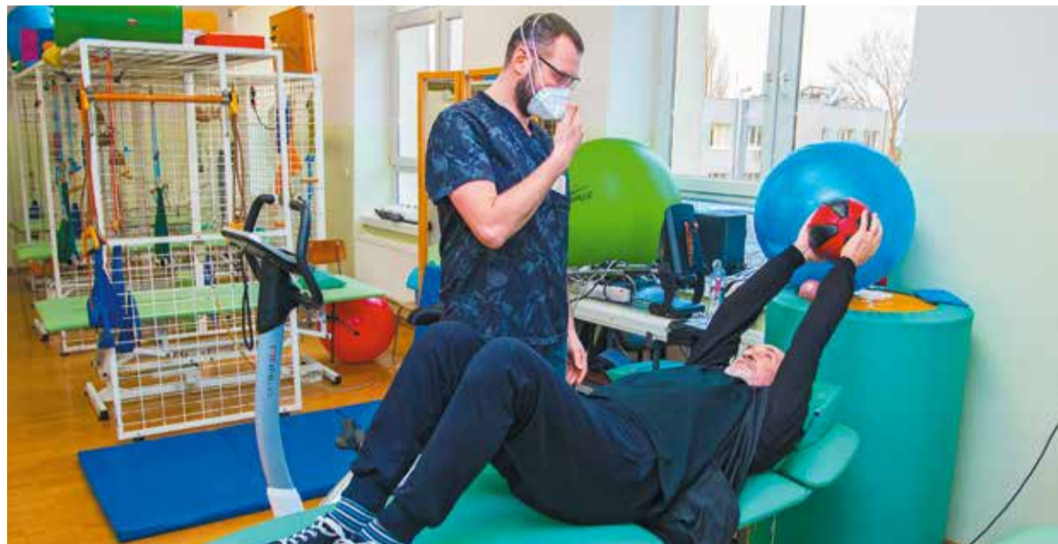
Z programu rehabilitacji pocovidowej skorzysta blisko 3000 mieszkańców województwa łódzkiego

Na walkę z pandemią COVID-19 przeznaczone zostały także środki z budżetu województwa łódzkiego. W tym roku zabezpieczono 5 mln zł na zakupy środków ochrony indywidualnej. Dotychczas dla pod-