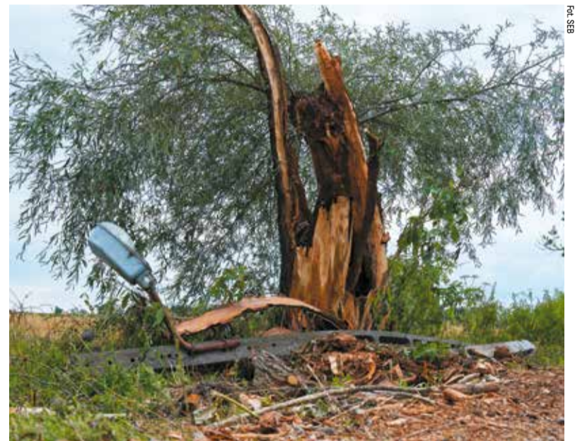
Wichura łamała drzewa i wyrwała ciężkie, betonowe słupy energetyczne

W gminie Zduny część środków od samorządu województwa została przeznaczona na wyposażenie dla ochotniczej straży pożarnej. Wsparcie dla strażaków-ochotników, którzy zawsze z wielkim zaangażowaniem biorą udział w akcjach ratujących życie i dobytek mieszkańców regionu, zapowiada również samorząd województwa. W 2022 roku planowane jest udzielenie pomocy finansowej lokalnym samorządom na zakup sprzętu dla ochotniczych straży pożarnych. Ma to wzmocnić potencjał jednostek OSP i przyczynić się do zwiększenia bezpieczeństwa mieszkańców Łódzkiego. ■