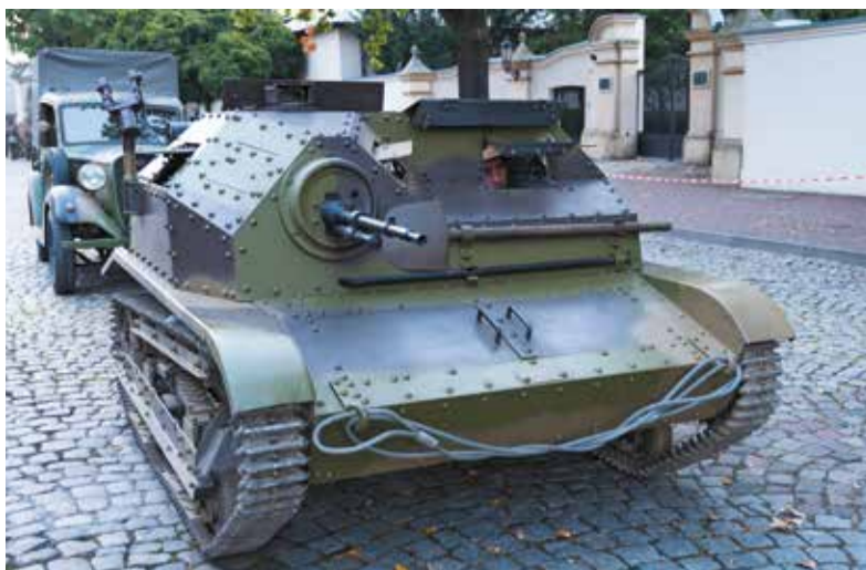
Polska tankietka TKS wspierała wojsko polskie w bitwie o Łowicz

Bitwa o Łowicz miała dramatyczny przebieg. 9 września niemiecka piechota, wchodząca w skład 8 Armii, wkroczyła do Łowicza. 11 września przednie formacje polskiej 16 Dywizji Piechoty dotarły do miasta i wyparły oddziały niemieckie. Niemcy, którym zależało na opanowaniu Łowicza, uderzyli już następnego dnia. Ciężkie walki trwały aż do 16 września i ostatecznego zajęcia miasta przez siły Wehrmachtu. Zginęły setki cywilnych mieszkańców. Niemcy wykorzystywali cywilów do osłony własnego natarcia.