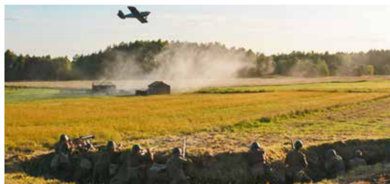
Polskie oddziały atakowane z powietrza