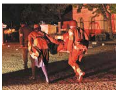
Widowiskowa akcja ewakuacji rannych żołnierzy polskich po niemieckim ataku