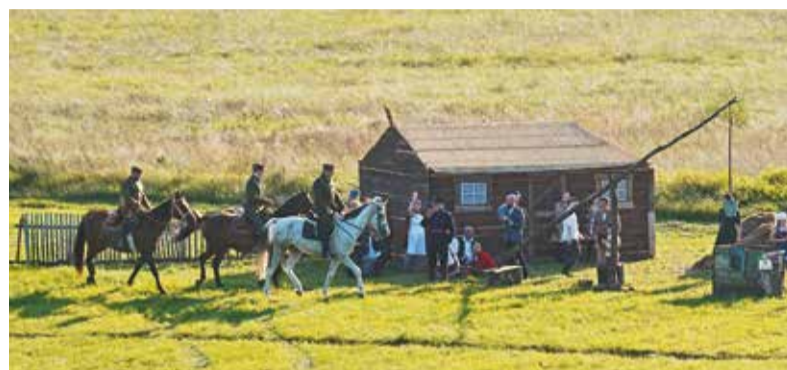
Ułani ostrzegają mieszkańców wsi przed zbliżającą się niemiecką armią