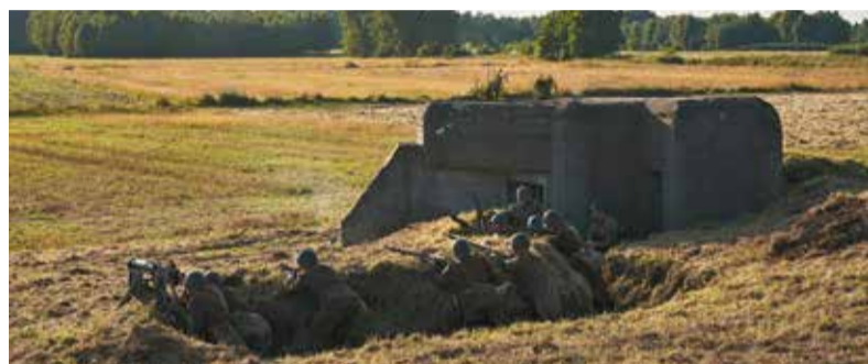
Polscy żołnierze broniący umocnień, które stanowiły strategiczny cel dla Niemców w tej bitwie. W Beleniu zachował się jeden z oryginalnych bunkrów

W Łowiczu dzięki projektowi „Łódzkie Pamięta” mieszkańcy regionu przenieśli się w czasie do 9 września 1939, kiedy toczyła się bitwa o miasto. W inscenizacji wzięło udział 140 rekonstruktorów z 13 grup rekonstrukcyjnych oraz kilkudziesięciu uczniów łowickich szkół grających ludność cywilną. Widzowie mieli okazję zobaczyć kilkanaście pojazdów wojskowych z epoki oraz imponujące, ale też budzące trwogę pokazy pirotechniczne.