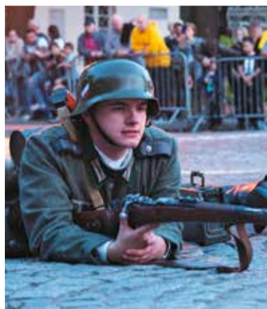
Rekonstruktorzy w niemieckich mundurach ćwiczą przed inscenizacją bitwy