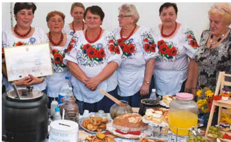
Stoły na stoiskach kół gospodyń wiejskich uginają się pod lokalnymi przysmakami