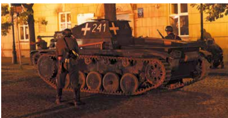
Znakomicie przygotowany i sprawny czołg Panzer II w czasie ataku na polskie pozycje w Łowiczu