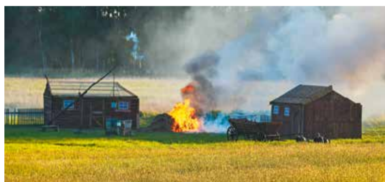
Niemcy palą opuszczoną przez Polaków wieś