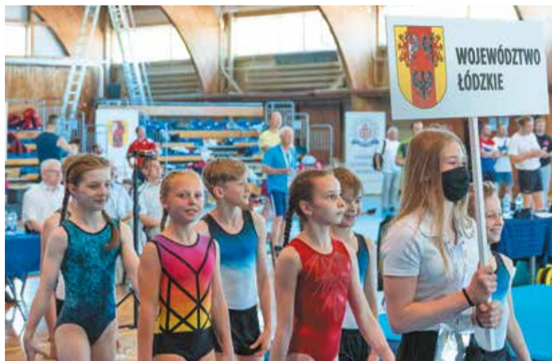
Oficjalne otwarcie olimpiady w Bełchatowie

XXVII Ogólnopolska Olimpiada Młodzi w sportach halowych - Łódzkie 2021 była największym wydarzeniem dla sportowców młodego pokolenia. Na organizację tego święta młodzieżowego sportu samorząd województwa łódzkiego przeznaczył 1,9 miliona złotych.