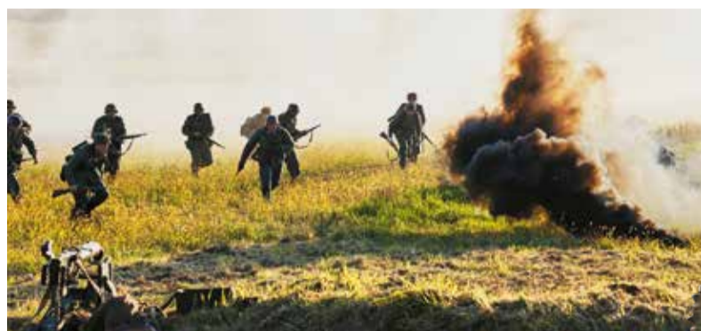
Szturm niemieckich żołnierzy na polski bunkier