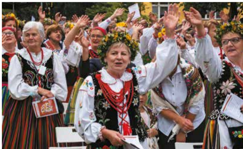
Koła Gospodyń Wiejskich reprezentowały cały region, często w barwnych, ludowych strojach