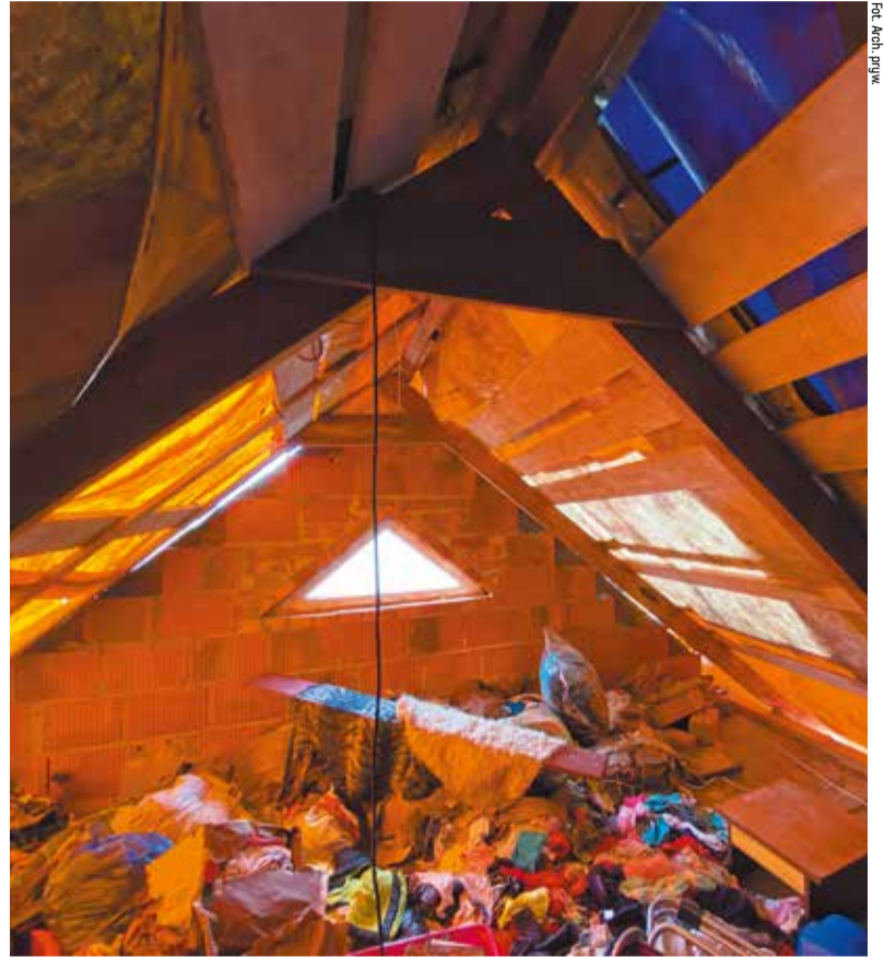
Zalane poddasze domu Katarzyny Gluby