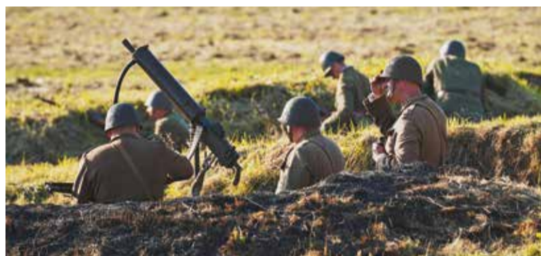
Polskie wojsko w oczekiwaniu na atak wroga