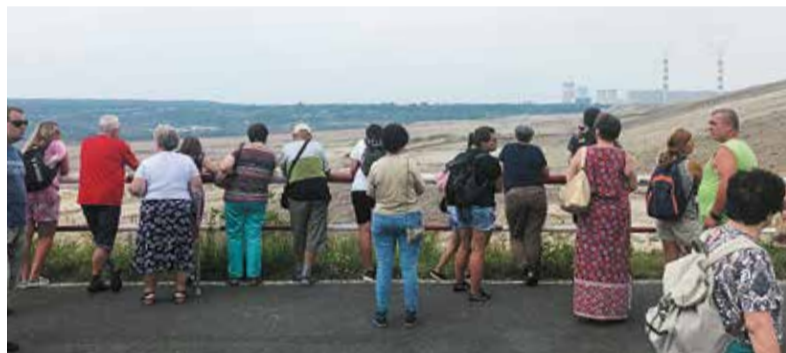
Kopalnię Bełchatów można było zobaczyć z punktów widokowych w Żłobnicy i Kleszczowie

Wśród uczestników zawiązywały się przyjaźnie. Integracji sprzyjała atmosfera, którą tworzyli organizatorzy oraz przewodnicy – pasjonaci z Towarzystwa Przyjaciół Łodzi i przewodnicy po miejscach, które były celami wycieczek. ■