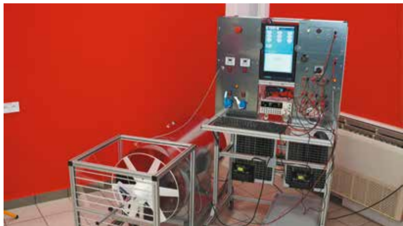
Do dyspozycji słuchaczy są trzy nowoczesne sale wykładowe i znakomicie wyposażona pracownia OZE