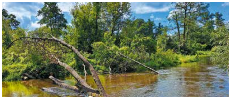
W Bolimowskim Parku Krajobrazowym uczestnicy podziwiali malowniczą dolinę Rawki